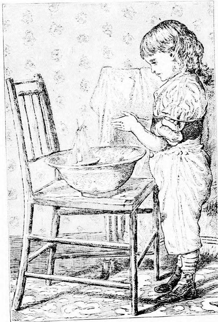
HAJÓRÁZÁS. (Lásd a 359. l.)