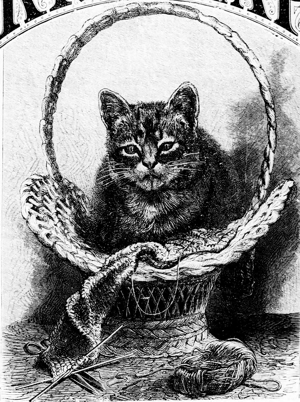
CZICZIBELLA ARCZKÉPE (Lásd a 362. l.)