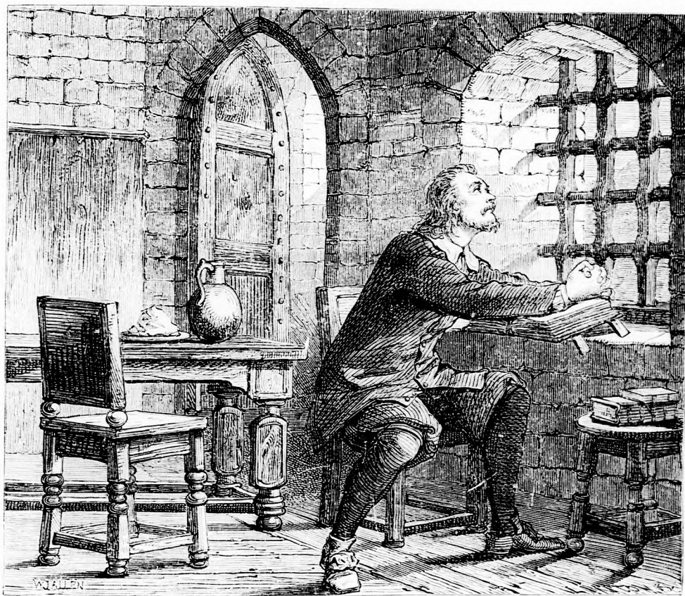
A RAB VIGASZA. (Lásd a 367. l.)

nem elégítheté, mignem egyszer nem messze egy ócska, üres hordót pillantott meg, mely használatlanul állott a sarokban. Ezt oda hengeríté a falhoz s rákapaszzkodva átlátott a falon a tulsó udvarba.