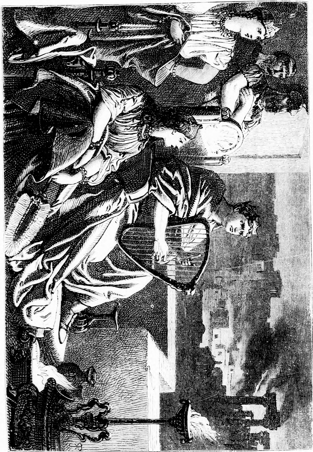
NERO CSÁSZÁR FÖLÉGETTI RÓMÁT. (Lásd a 358. l.)

Felelős szerkesztő: Forgó bacsí . Kiadó-hivatal: Budapest, bálvány-utca 9. sz. Nyomatott Deutsch testvérek könyv- és könyomdai műintézetében Budapesten. Ára negyedévre 1 frt. 20 kr Megjelen hetenként egyszer 16 oldalon.