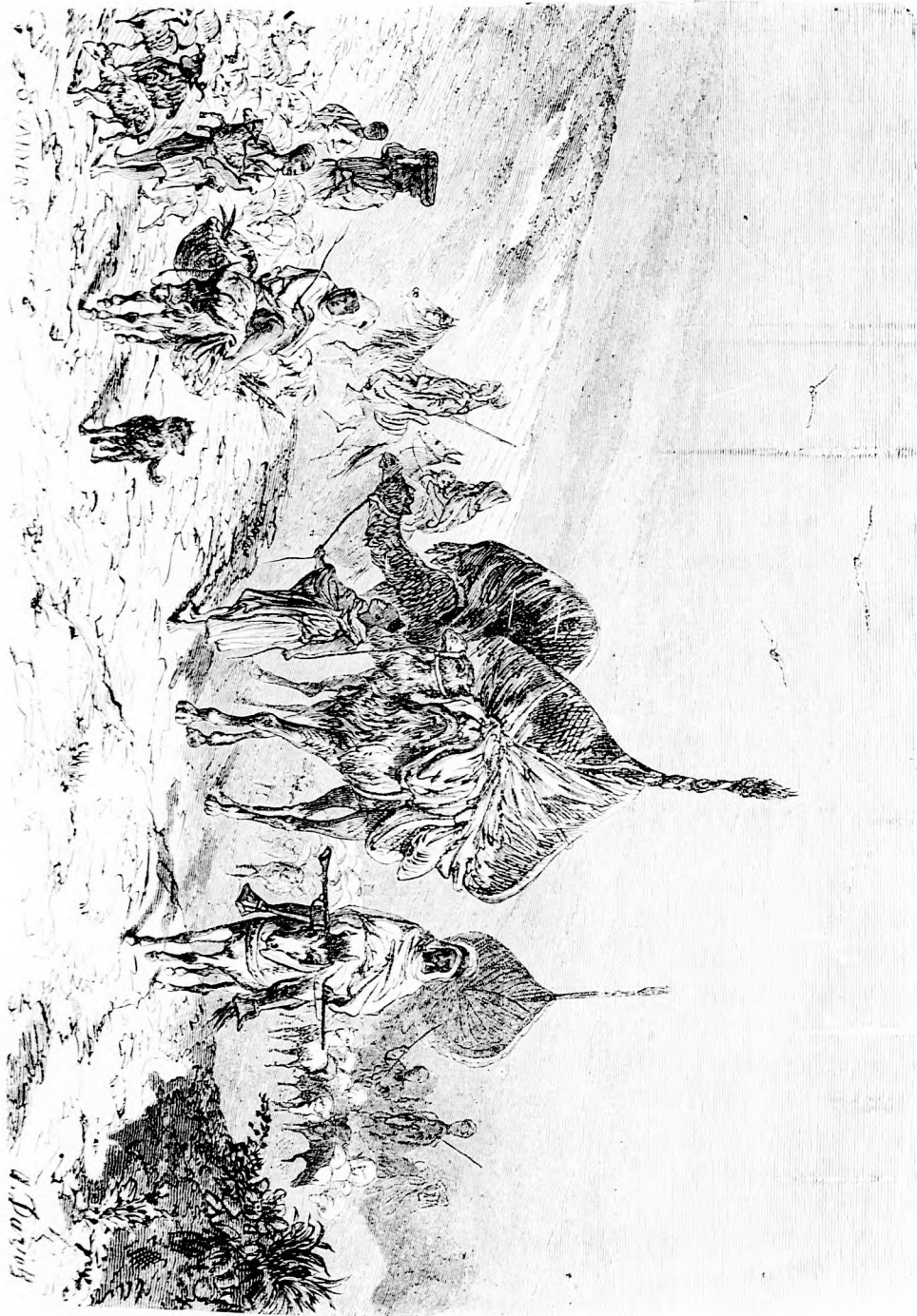
KARAVÁN A SIVAJAGHÁN. (Lásd a 359. l.)