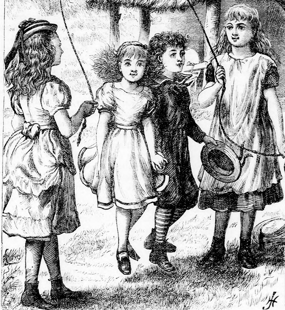
ITT A TAVASZ. (Lásd a 408. l.)