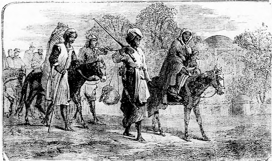
HINDU ZARÁNDOK. (Lásd a 410. l.)

Ez a gondolat nem hagyott neki többé nyugtot. A király javában hor-