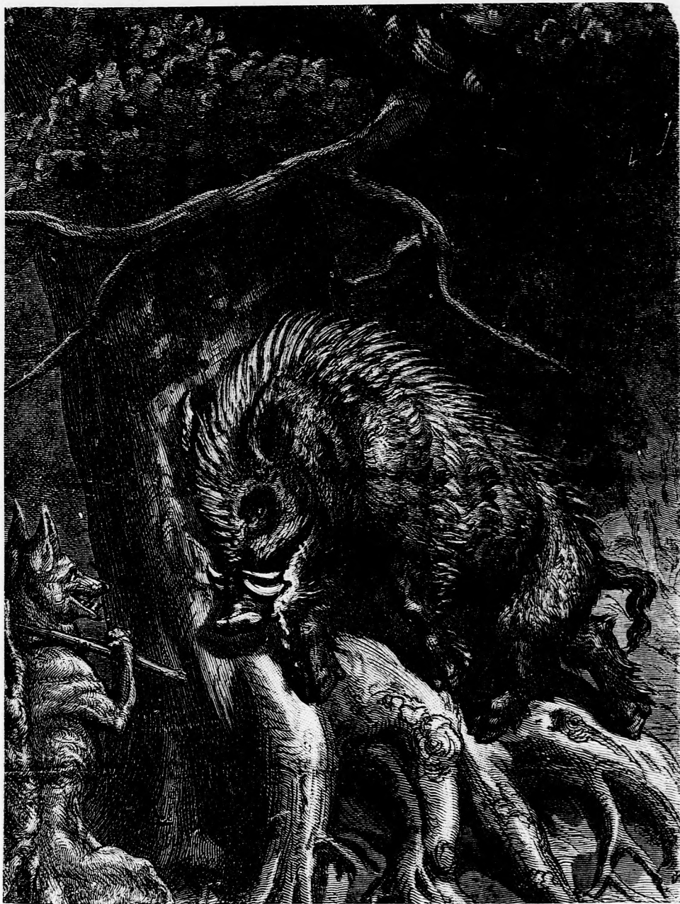
A VADKAN ÉS A RÓKA. (Lásd a 187. l.)