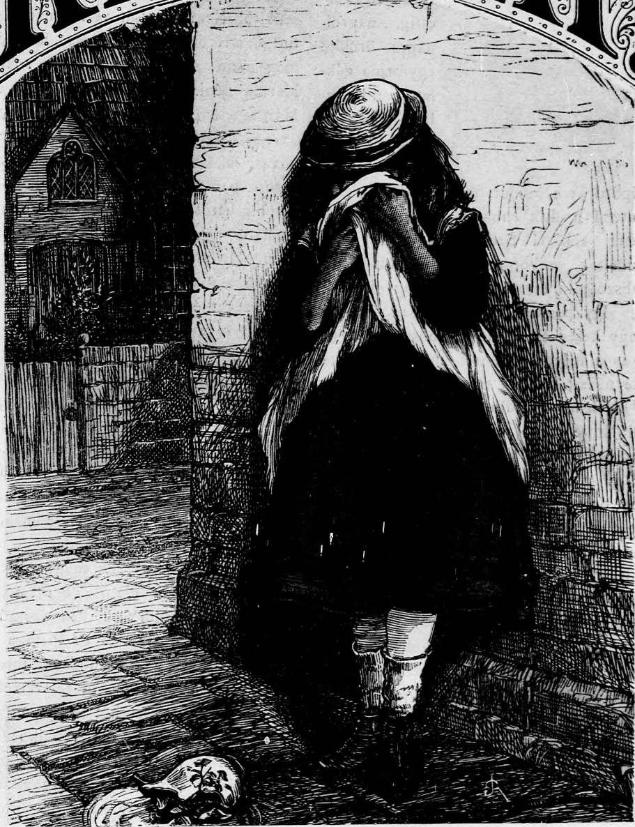
AZ ELTÖRT KORSÓ. (Lásd a 190. l.)