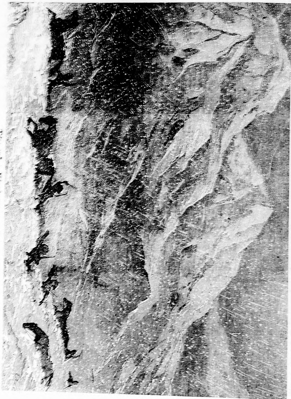
Телу ивѣ в Кипрѣтчанъ. (Лѣтъ в 190. 1.)