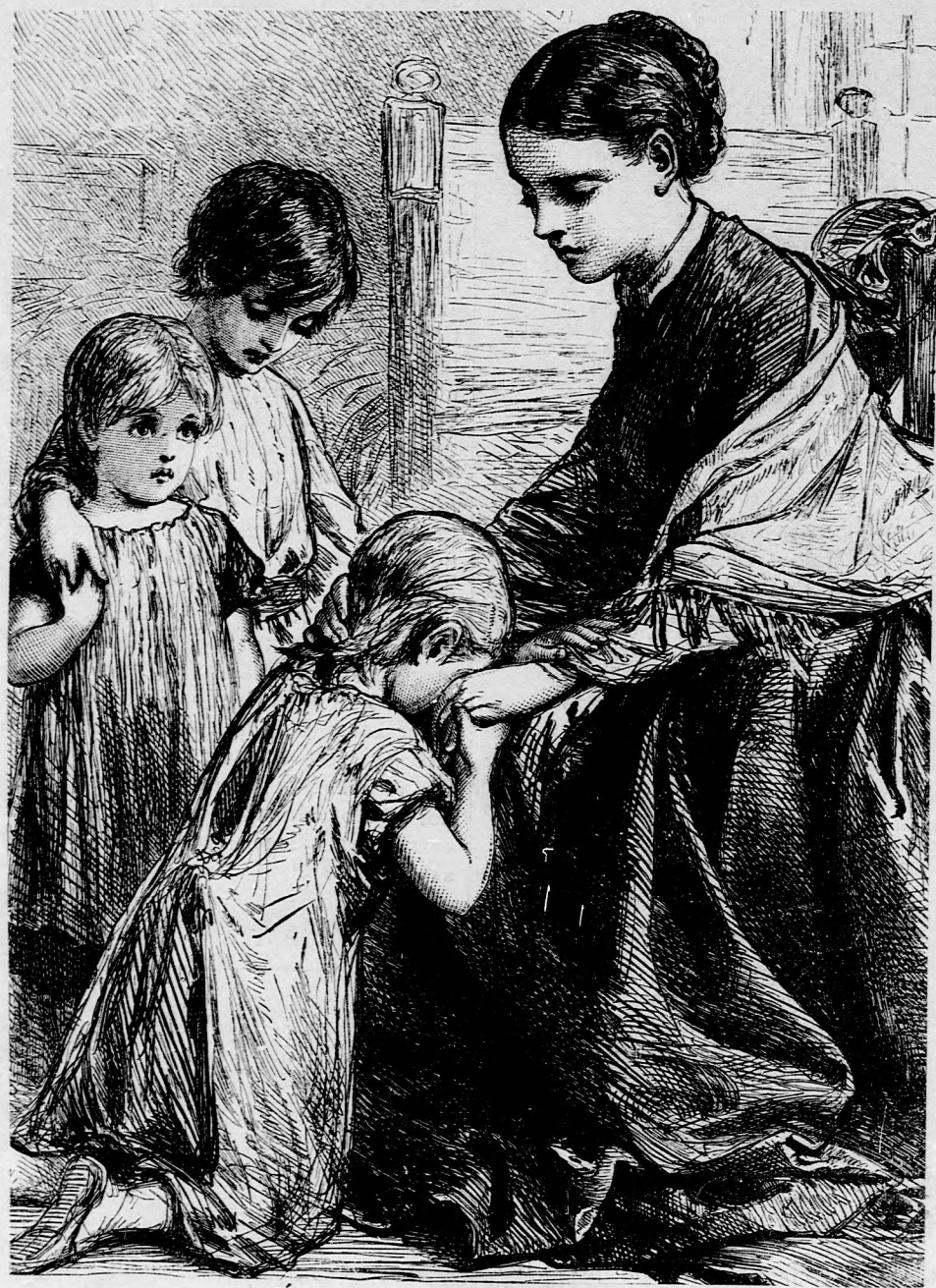
ÁRVA GYERMEK (Lásd a 183.1.)

Felelős szerkesztő: Forgó bácsi . Kiadó-hivatal: Budapest, bálvány-utca 9. sz. Nyomatott Deutseh testvérek könyv- és könyomdai műintézetében Budapesten. Ára negyedévre 1 frt. 20 kr Megjelen hetenként egyszer 16 oldalon.