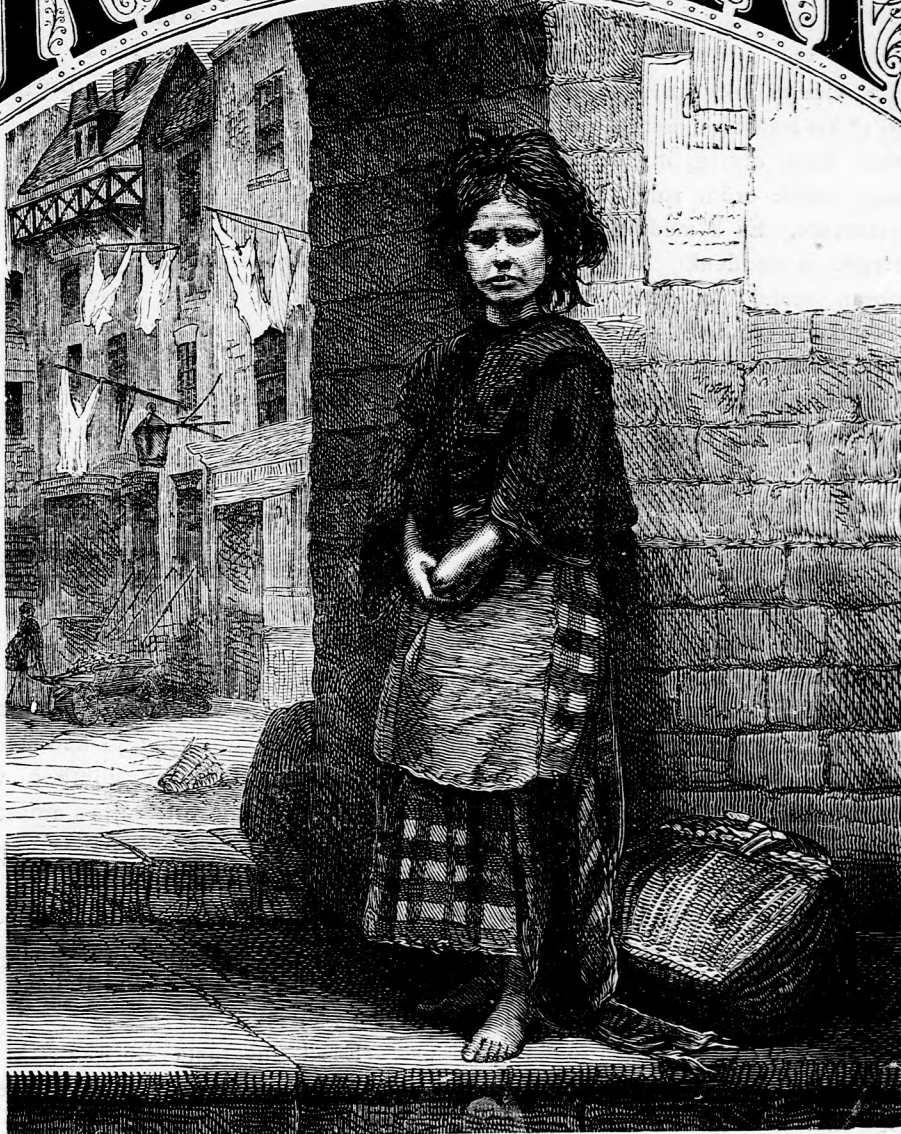
A SZEGÉNY MUNKÁS ÉS CSALÁDJA. I. (Lásd a 390. l.)