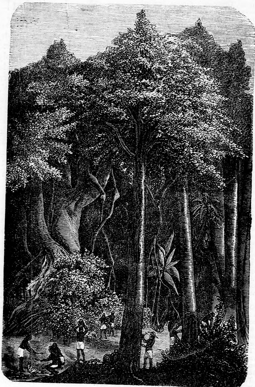
AMERIKAI ŐSERDŐBEN. (Lásd a 391. l.)

Felelős szerkesztő: Forgó bácsi . Kiadó-hivatal: Budapest, bálvány-utca 9. sz. Nyomatott Deutsch testvérek könyv- és könyvnyomdai műintézetében Budapesten. Ára negyedévre 1 frt. 20 kr. Megjelen hetenként egyszer 16 oldalon.