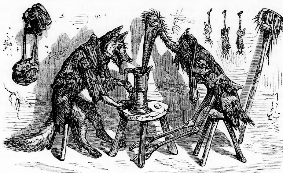
A RÓKA ÉS A GÓLYA. (Lásd a 390. l.)

„Jól tudom, mily szomorú a te sorsod, te jó szivű kis leány,“ szólalt meg a madárka. „Hanem lehet ám segíteni a bajon és mert tegnap oly jó voltál irányomban, ma én fogok segíteni rajtad. Ha összezsedtél negyvenkilencz