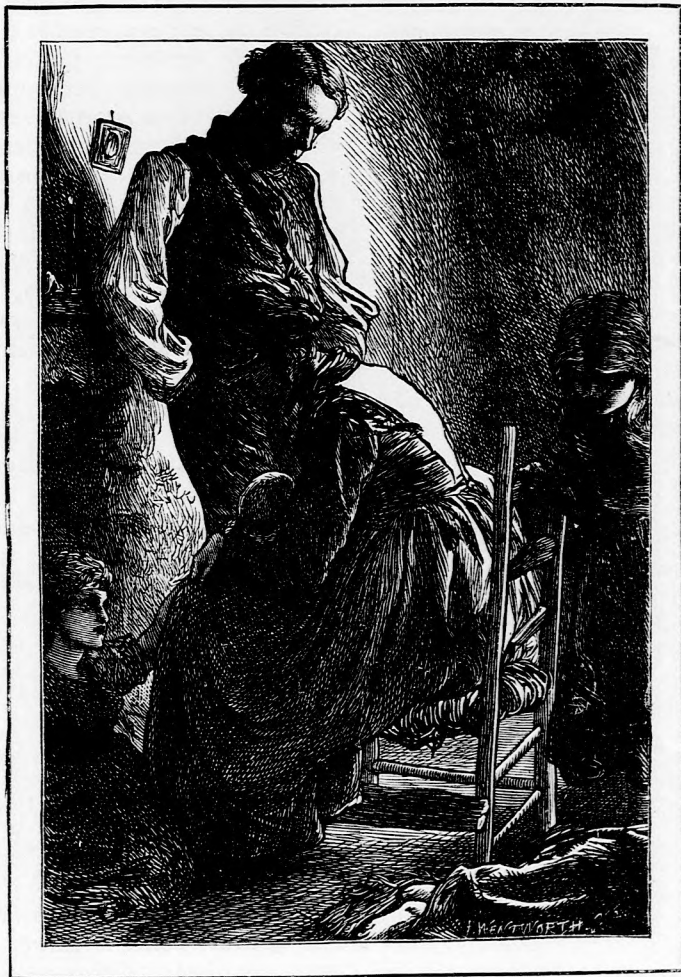
A SZEGÉNY MUNKÁS ÉS CSALÁDJA. II. (Lásd a 390. l.)