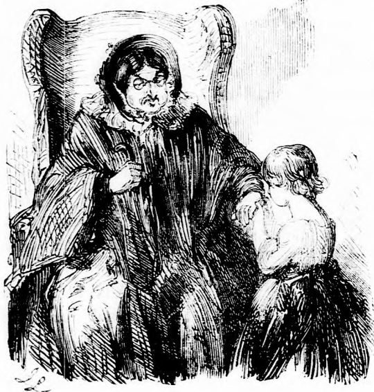
NAGYMAMA LÁTOGATÁSA. (Lásd a 39. lapon.)

»Mindjárt meglátjuk. János, add karodat, hadd támaszkodom rád; fölme gyünk a Jacopo szobájába, bizonyosan ott rejtette el valahova.«