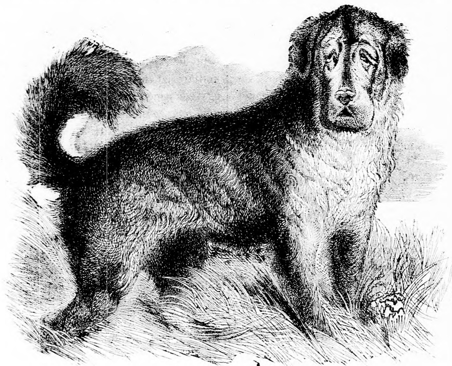
BÁTOR. (Lásd a 38. lapon.)

Imrike, mióta nagynénje elvitte innen, semmit sem hallott szülőhelyéről; de emlékezett hajdani hű ápolójának, a jó Márthának szavaira, hogy a házat szintén eladják, mert máskép nem lehet az adósságot kifizetni. Ki tudja tehát, kic most a ház? Imrike elsápadt, mikor a