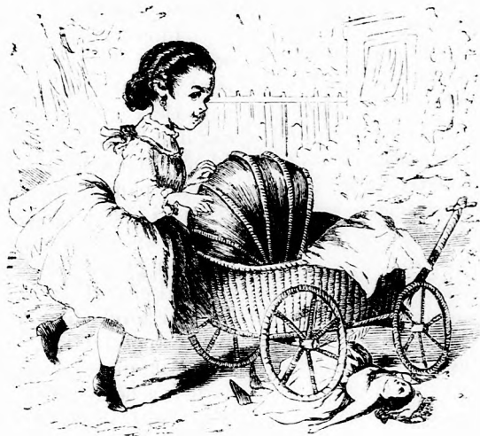
UTAZÁS. (Lásd a 43. lapon.)

ott az ágyra ugorva, a szelenczét a vánkos alá rejté. Mikor észrevette, hogy meglesték, ijedten elszökött s elbújt egy sarokba. — Most már meg volt fejtve az egész. A fényes arany szelencze magára vonta Jaco figyelmét s a majom volt a tolvaj.