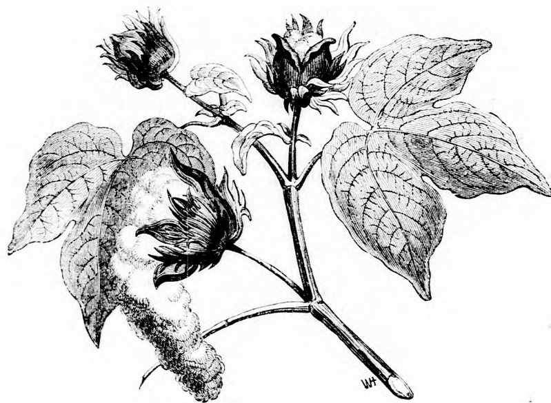
A PAMUTBOKOR. (Lásd a 42. lapon.)

Szemben velök, az utca másik oldalán eléggé szegényes házacskában lakott egy igen öreg asszony, ki mindig fekete ruhát viselt s minden reggel kísétált egy egészen fehér kutya kíséretében; ez a