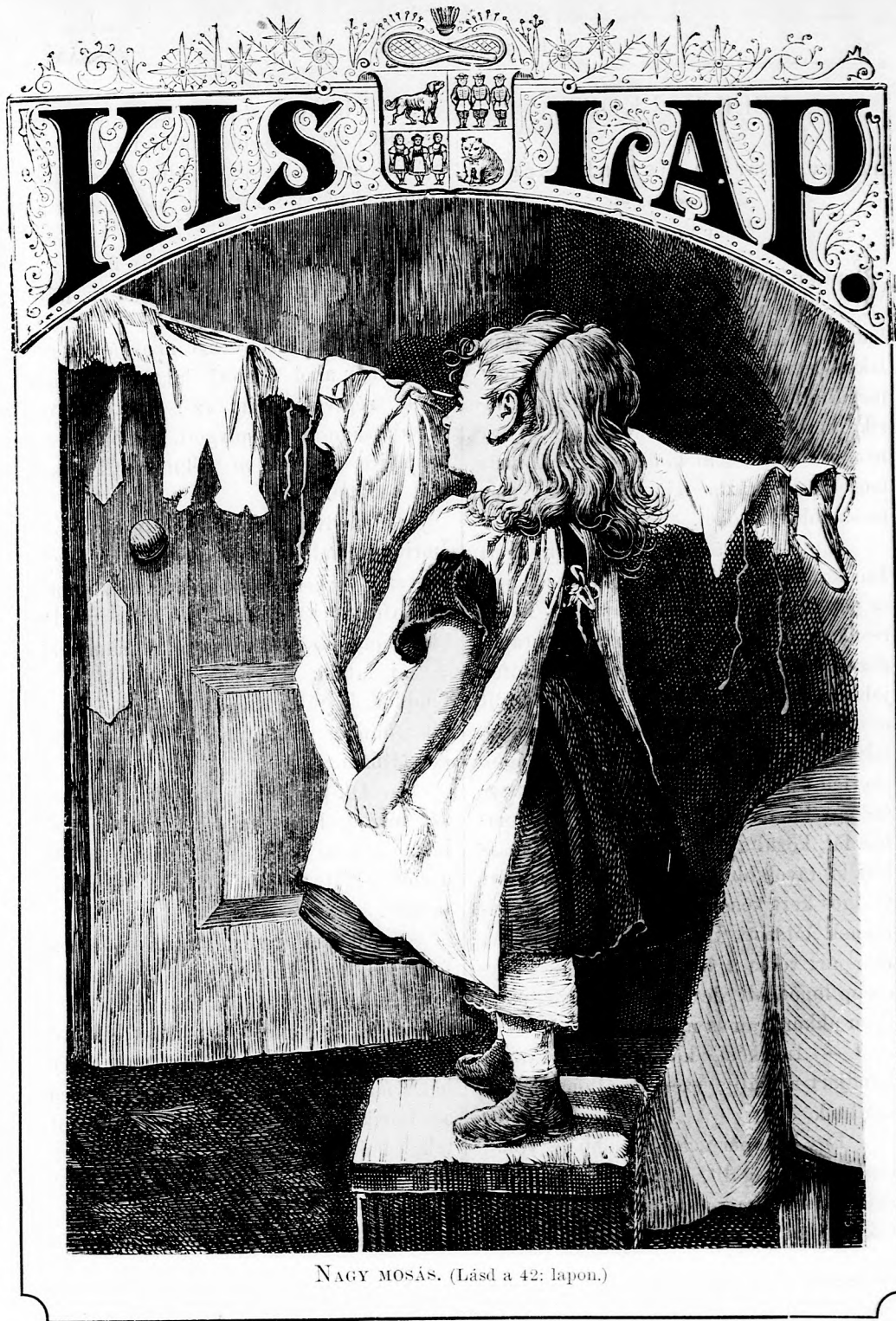
NAGY MOSÁS. (Lásd a 42: lapon.)