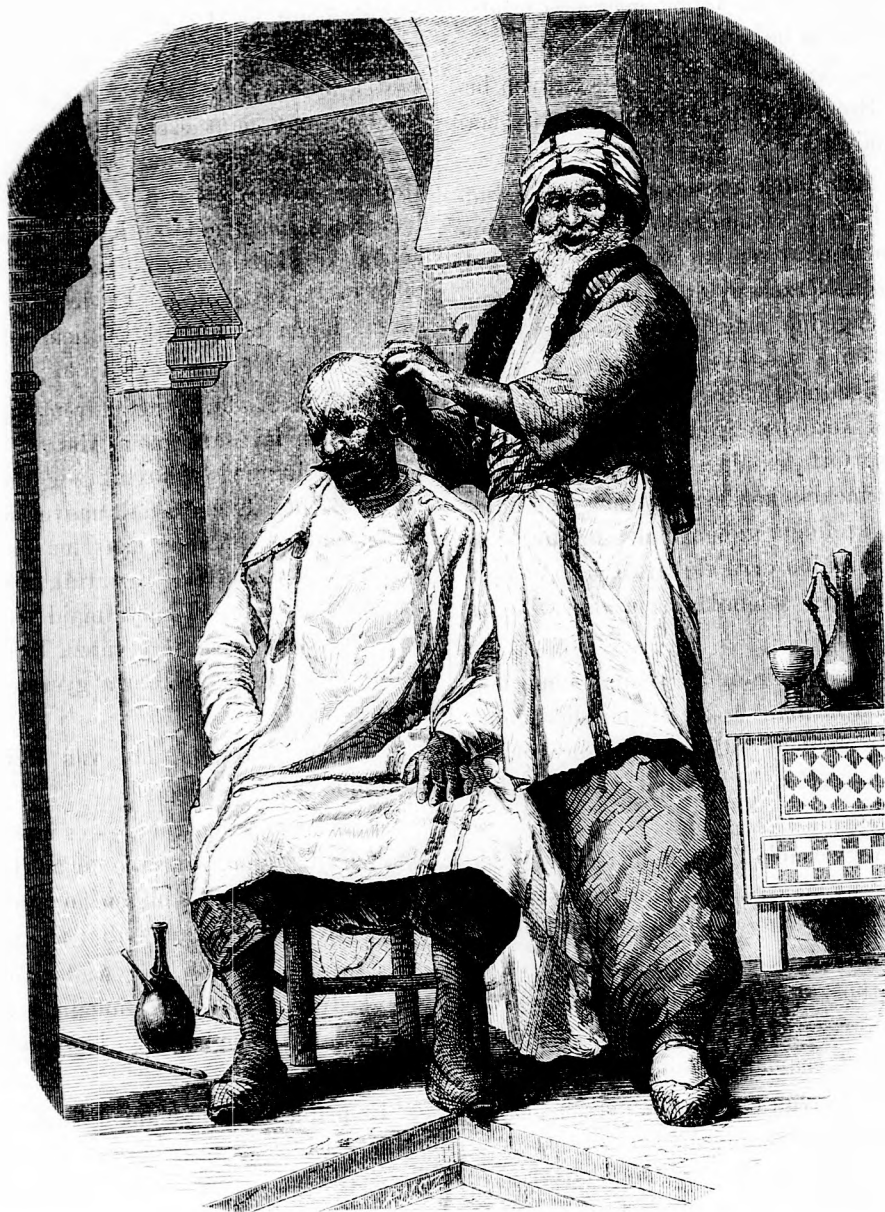
TÖRÖK BERETVÁLKOZÁS. (Lásd a 43. lapon.)

Felelős szerkesztő: Forgó bácsi . Kiadó-hivatal: Budapest, barátoktere, Athenaeum-épület. Kiadja és nyomtatja az Athenaeum irodalmi és nyomdai részv. társulat. Megjelen hetenként egyszer 16 oldalon.