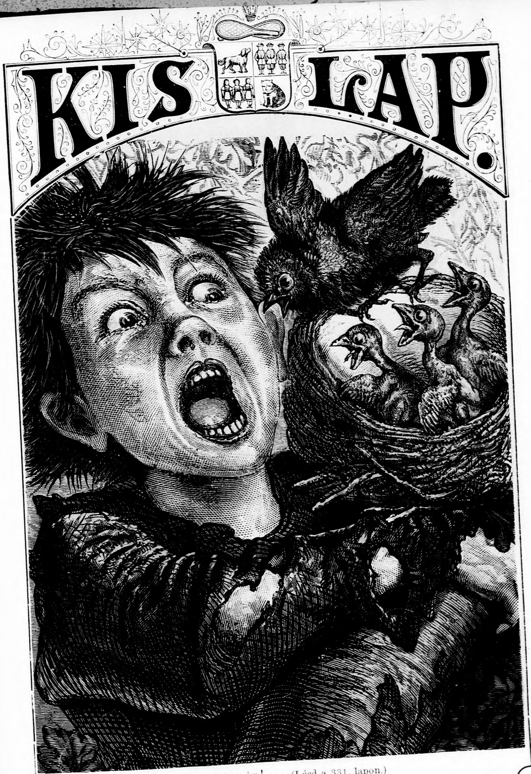
JAJ, SEGITSÉG! . . . (Lásd a 331. lapon.)