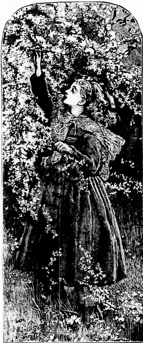
HŰS LIGETBEN. (Lásd a 330. lapon.)

A maga népe közt a néger király igen nagy ur, mindenki föltétlenül engedelmeskedik neki s akármit kíván, mindent odaadnak neki. De viszont ő a legbátrabb és legvitézesebb harczos és ha háboru van, ő védi legelső sorban a népet.