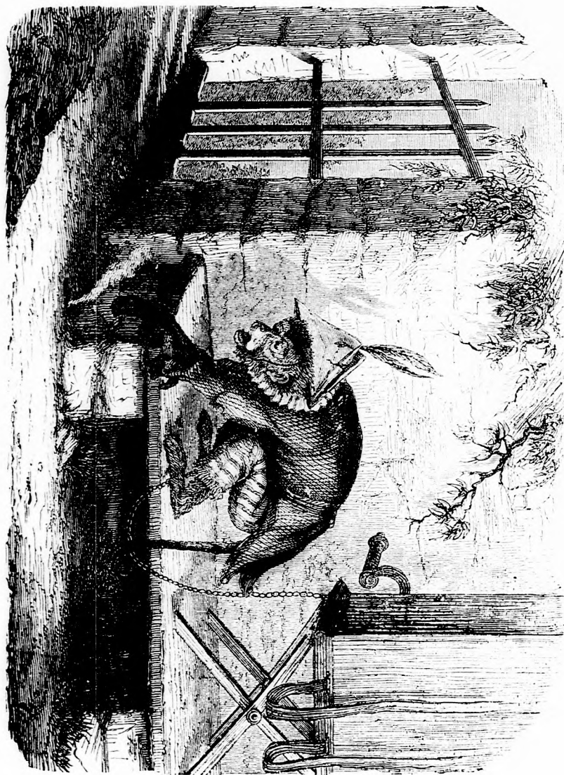
MAYFI KOMA. (Lásd a 336. lapon.)

Felelős szerkesztő: Forgó bácsi . Kiadó-hivatal: Budapest barátok tere, Athenaeum-épület. Kiadja és nyomtatja az Athenaeum irodalmi és nyomdai részv. társulat. Megjelen hetenként egyszer, 16 oldalon.