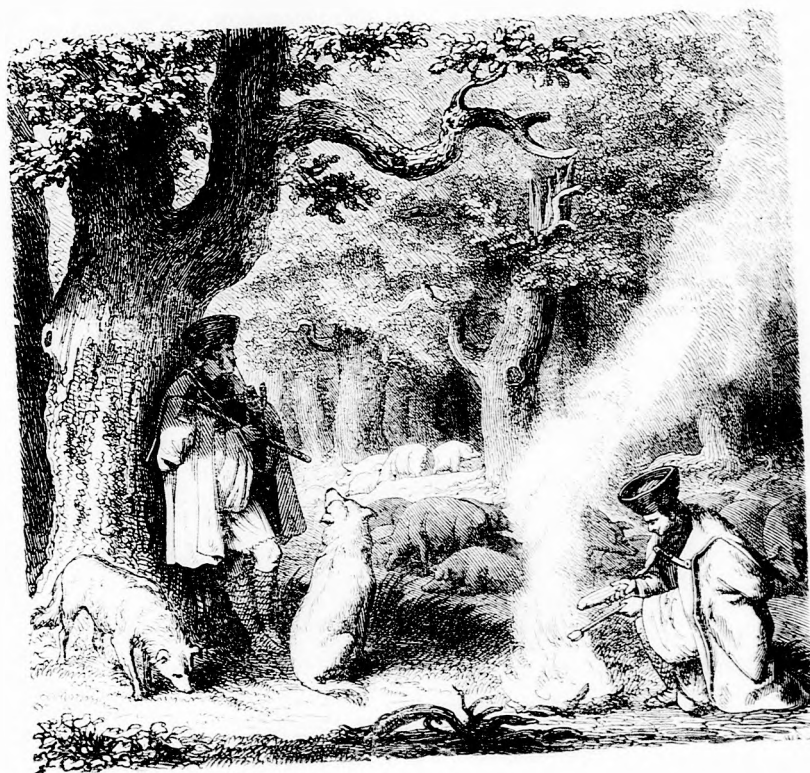
KANÁSZOK AZ ERDŐBEN. (Lásd a 331. lapon.)

Ezalatt egy másik hivatalnok figyelmesen vizsgálgató Imrikét s így szólt: