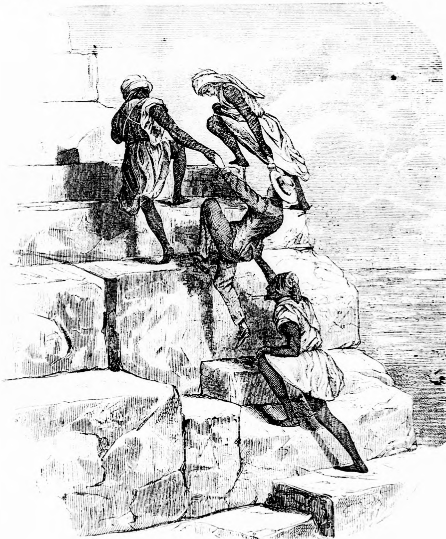
FÖLMELET A GULÁKRA. (Lásd a 347. lapon.)

szegény Jancsi halva rogyott össze. A vén gonosztevő pedig oda vitte a király- hoz a fegyvereket s azt mondta, hogy ő hozta el. A király megdicsérte nagyon és szavatartó ember levén, rögtön kijelen-