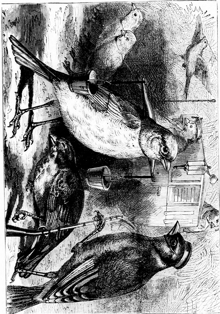
71105 MADARAK. (Lásd a 346. lapon.)

Felelős szerkesztő: Forgó bácsi . Kiadó-hivatal: Budapest barátok tere, Athenaeum-épület. Kiadja és nyomtatja az Athenaeum irodalmi és nyomdai részv. társulat. Megjelen hetenként egyszer, 16 oldalon.