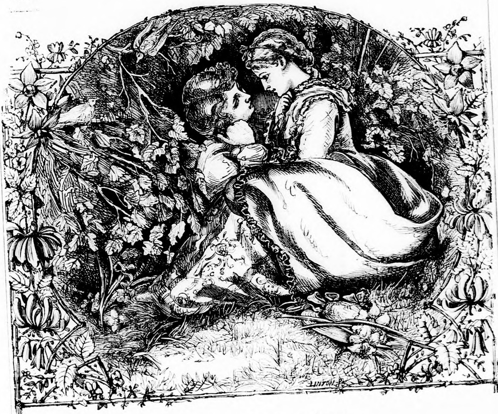
A LUGASBAN. (Lásd a 350. lapon.)

Ily módon végre följutnak a legtetőjére, de ugyancsak kifáradva ám. Ott fönt azonban elfelejti az ember a fáradságot.