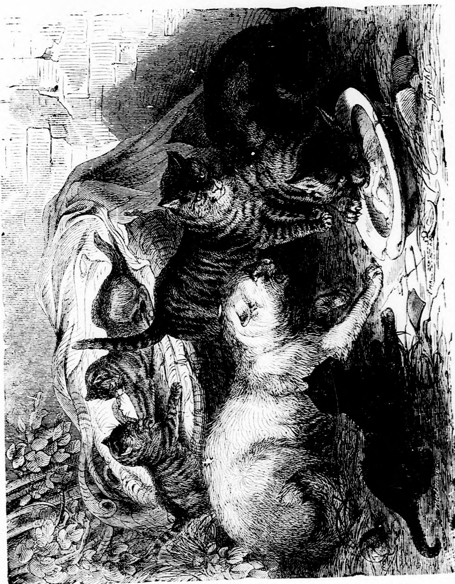
A MACSKÁK. (Lásd a 351. lapon.)