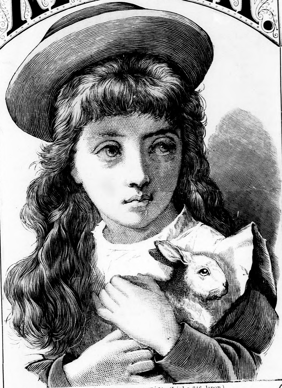
KLOTILD ÉS HÁZI NYULACSKÁJA. (Lásd a 346. lapon.)