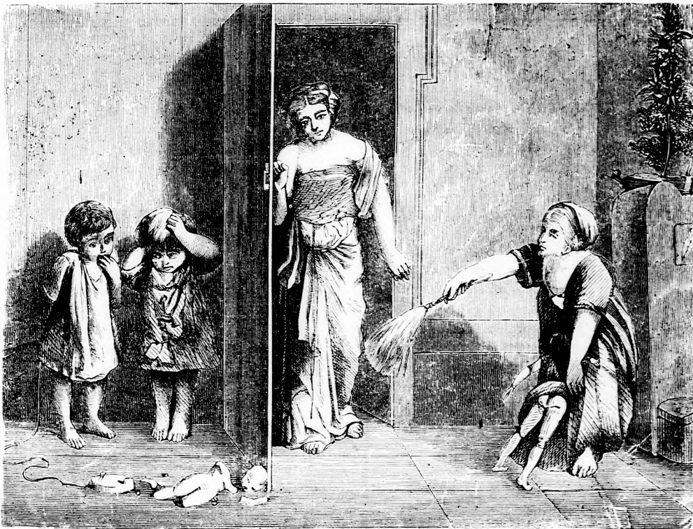
GÖRÖG GYERMEK A HAJDANKORBAN. (Lásd a 374. lapon.)

Néha-néha nagyot sóhajtott és busan így szólt magában, mi'att egy kis képet, melyet kezében tartott, megcsókolt: