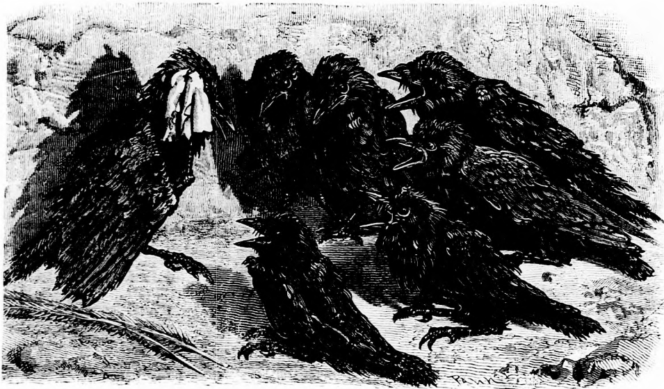
A PÁVATOLLAS HULLÓ. (Lásd a 375. lapon.)

volna, hogy valami vándor köteltánczos társasághoz tartozom. — Azonban, hogy folytassam történetemet, akármit gondolt az én fiatal megmentőm, nem sokat beszélt, hanem kézen fogott és gyorsan vitt magával, míg végre egy utczába értünk, melyben tömérdek ember tolongott és bámult egy lángban álló két emeletes, magas házat. A szikrák magasan pattogtak.