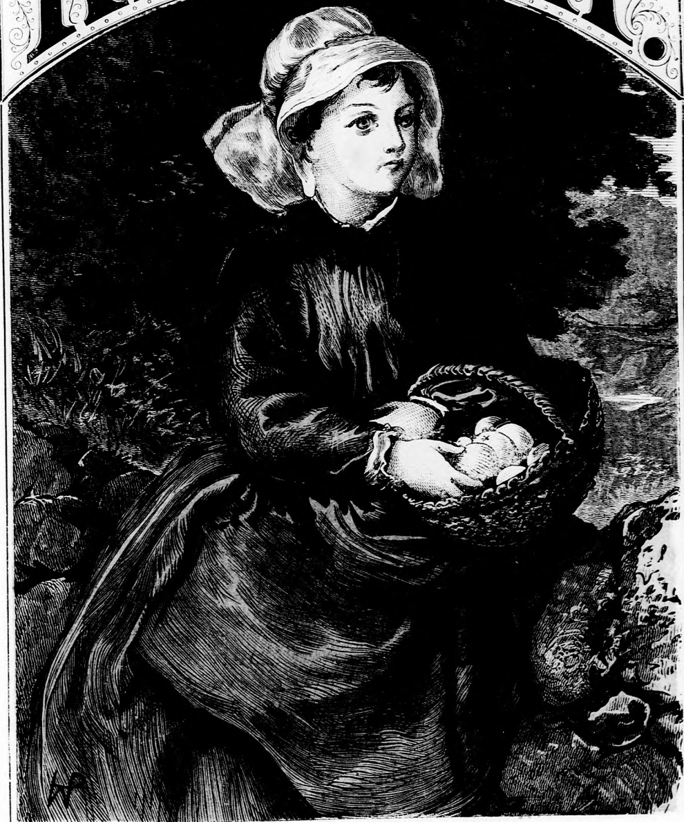
KIS KOFA. (Lásd a 378. lapon.)