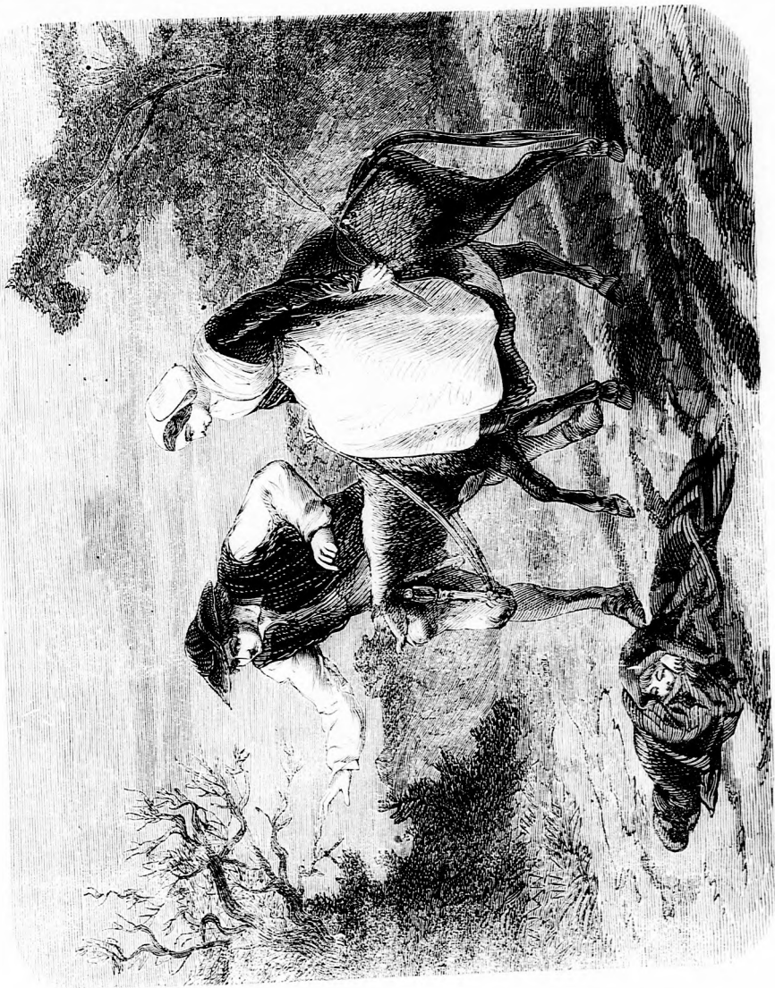
A TALÁLT GYERMEK. (Lásd az 520. lapon.)

nem merik bántani. Csak ha magányosan téved egy fehér ember a vadak közé, ak- kor megrohanják, megölik és megeszik,