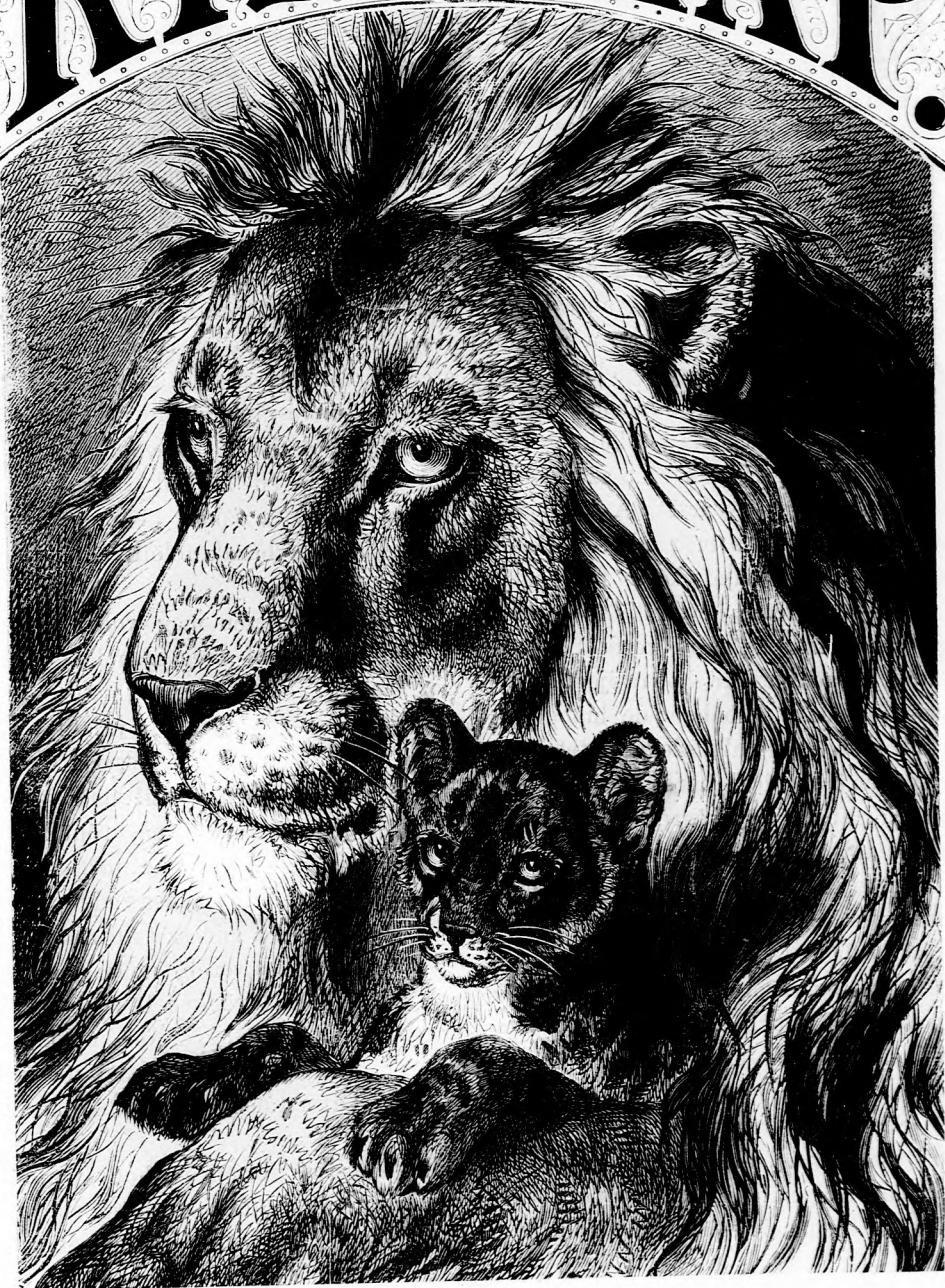
ÓROSLÁN ÉS KÖLKE. (Lásd az 518. lapon.)