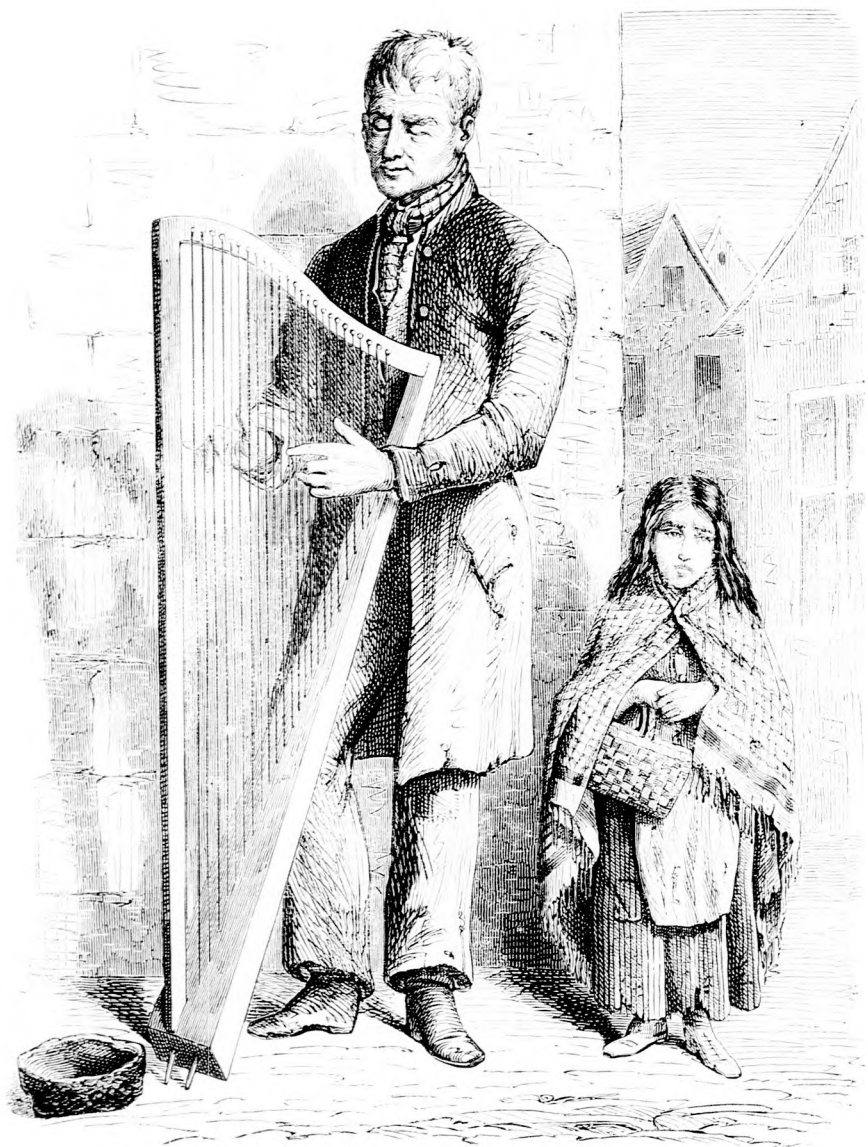
A VAK HÁRFÁS. (Lásd az 518. lapon.)

Felelős szerkesztő: Forgó bácsi. Kiadó-hivatal: Budapest barátok tere, 7-ik sz. Athenaeum-épület. Kiadja és nyomatja az Athenaeum irodalmi és nyomdai részv. társulat. Megjelen hetenként egyszer, 16 oldalon.