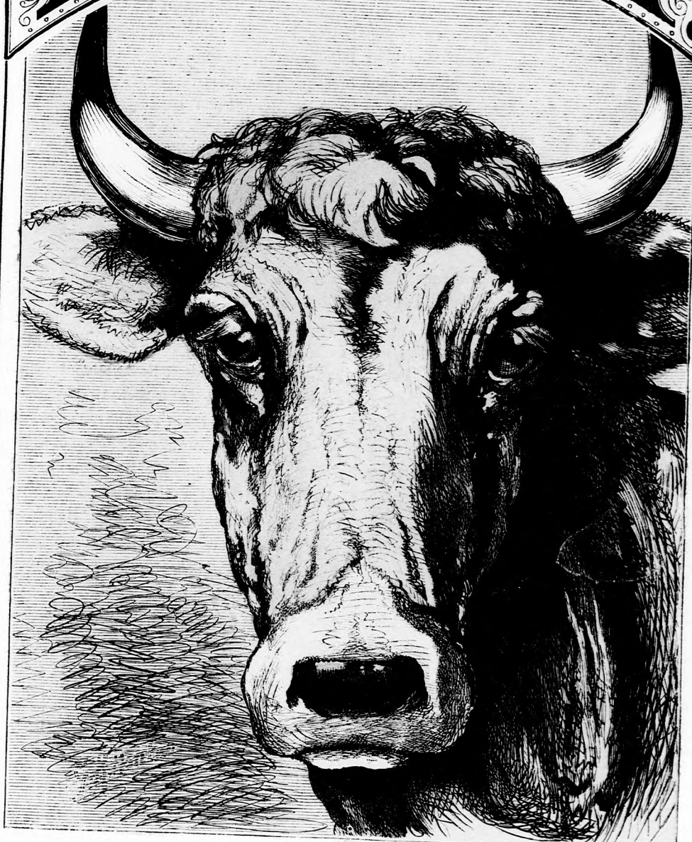
A MI RISKÁNK. (Lásd a 270. lapon.)

17. szám. — 1876. Ára negyedévre 1 frt. 20 kr.