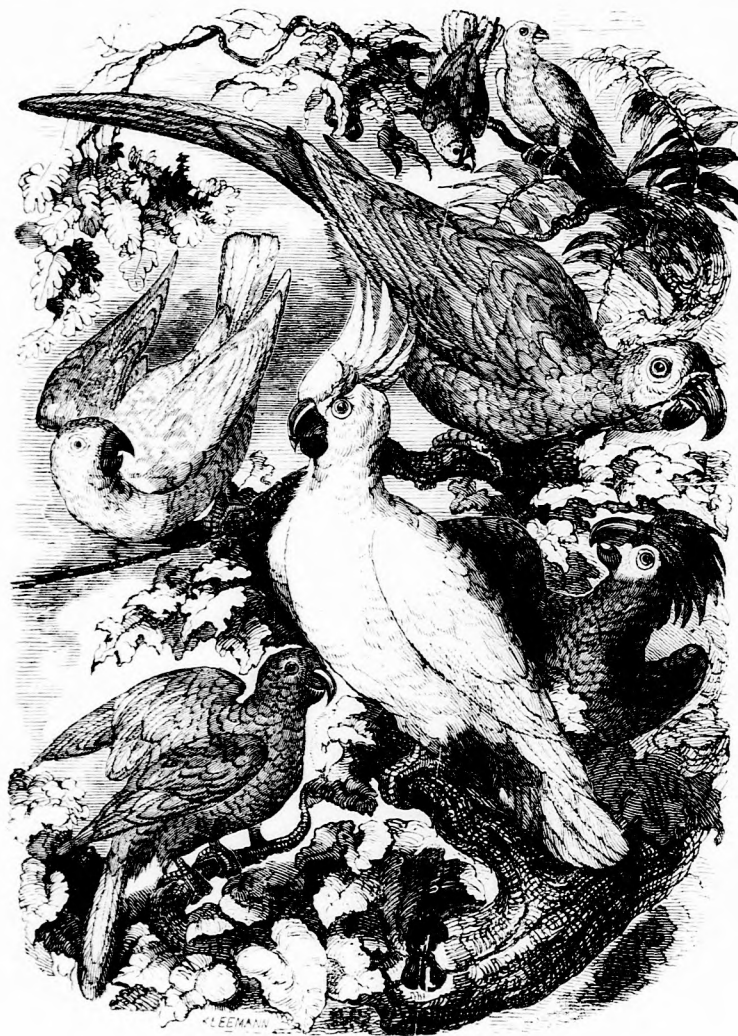
A PAPAGÁJOK OTTHON. (Lásd a 269. lapon.)

Berzi, mikor visszanyerte eszméletét, szegyenkezve látta, hogy életét az a fiu mentette meg, kit ő folyvást csufolt s az a hű állat segítette, melyet ő meg akart ölni. Nehány perczig földre sütötte szeméit, de aztán győzött jobb indulata, oda-