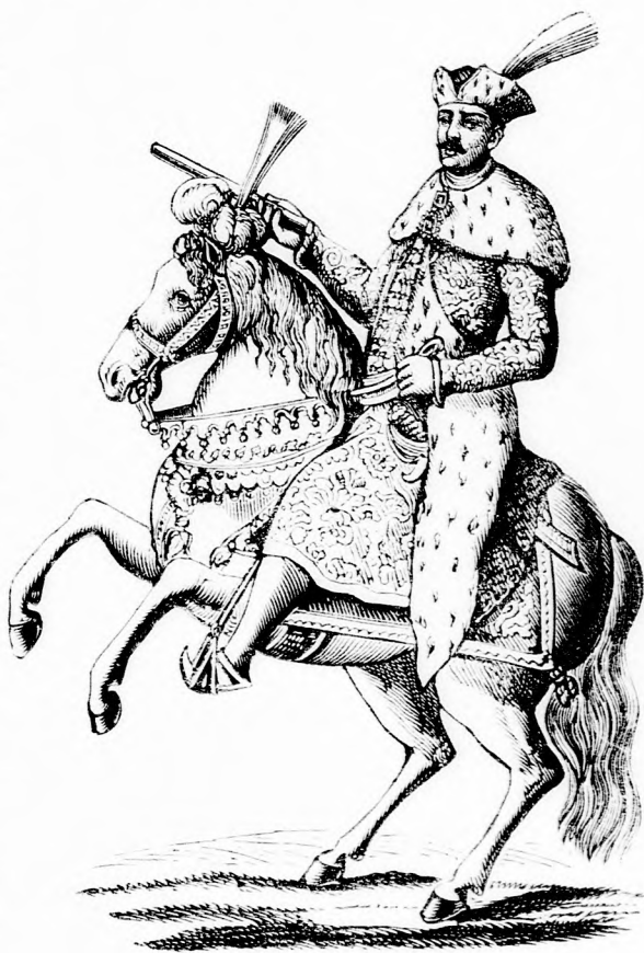
KÖZÉPKORI MAGYAR LOVAG.

nagy hirre jutott s a hol megjelent, ott rémület lepte meg az ellenséget; akár mily nagy számmal jött az ellenség hada a fekete sereg szétverte s Mátyás király, fényes győzelmeket aratott a törökök és németek fölött, meghódított több szom-