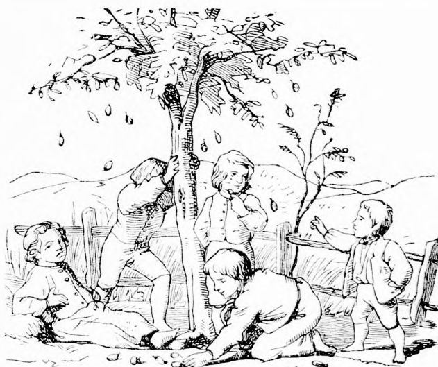
MANDULA-FA. (Lásd a 272. lapon.)

Az ottani vadászok, ha elevenen akarnak elfogni a papagájokat, kimennek az erdőbe s kikémelelik, melyik fán ülnek e madarak csapatosan. Az ilyen fa alatt a vadász tüzet rak s a tűzbe bizonyos növényeket dob, melyekből igen bódító füst száll föl. A fa ágain ülő papagájok elszé-