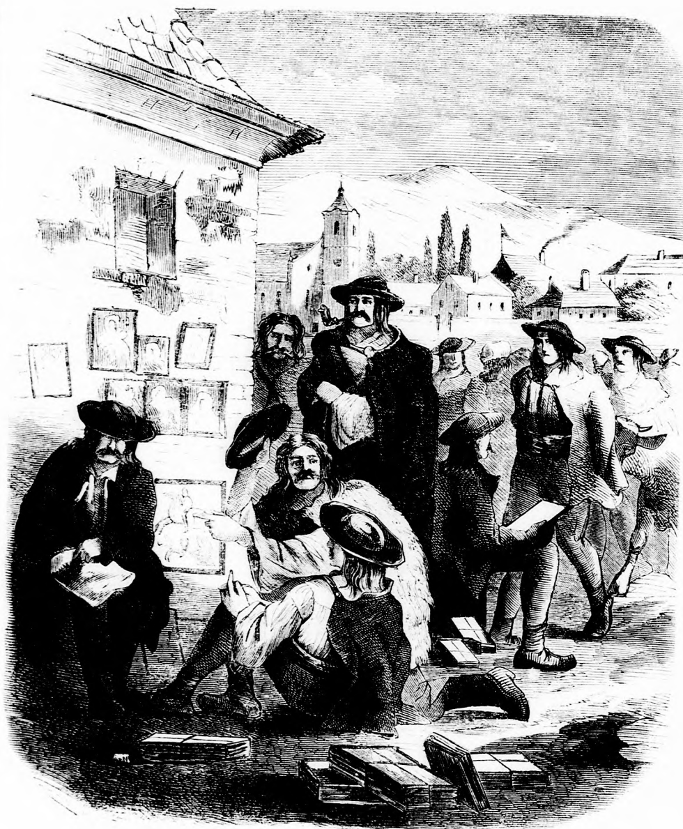
KÉPÁRULÓ TÓT. (Lásd a 271. lapon.)

Felelős szerkesztő: Forgó bácsi . Kiadó-hivatal: Budapest, barátok tere, 7-ik sz., Athenaeum-épület. Kiadja és nyomatja az Athenaeum irodalmi és nyomdai részv. társulat. Megjelen hetenként egyszer, 16 oldalon.