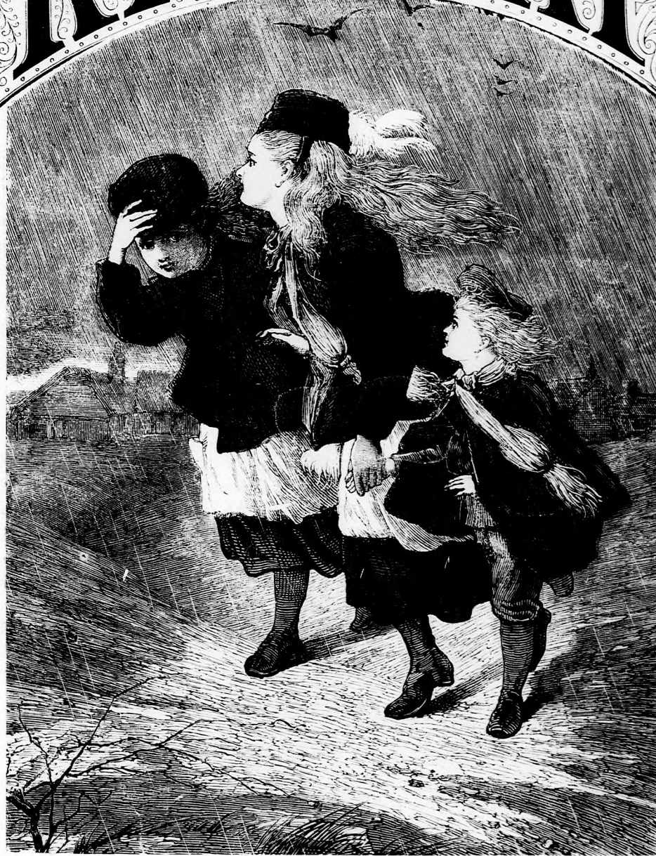
ESŐBEN. (Lásd a 332. lapon.)

21. szám. — 1876. Ára negyedévre 1 frt. 20 kr.