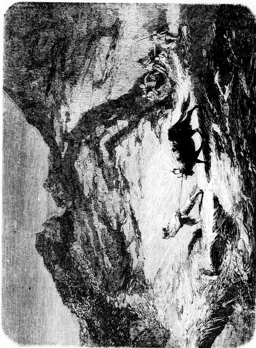
A RABLÓK TEHENE. (Lásd a 331. lapon.)