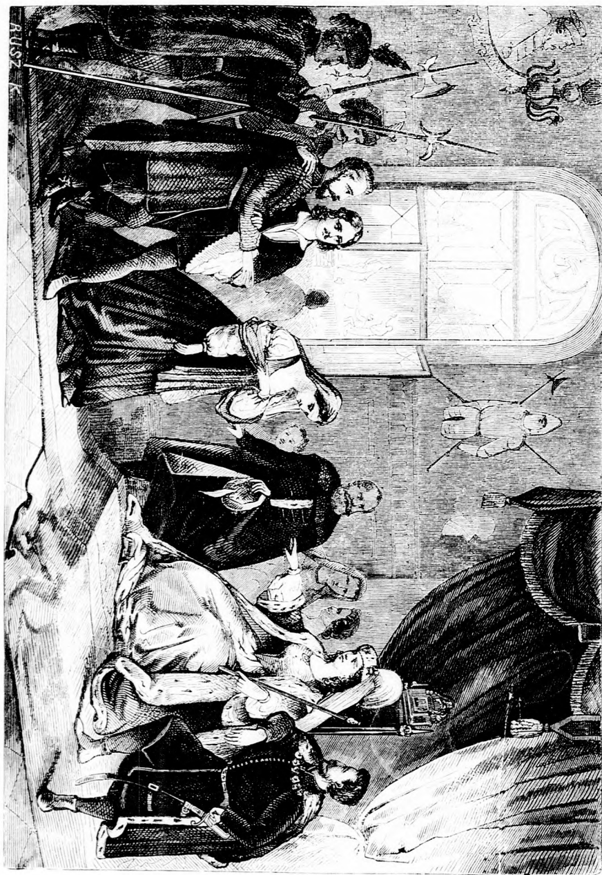
ADAPPEY MUMIYANE A TRONKISON (Lásd a 334. lapon.)

Felelős szerkesztő: Forgó bácsi . Kiadó-hivatal: Budapest, barátok tere, 7-ik sz., Athenaeum-épület. Kiadja és nyomatja az Athenaeum irodalmi és nyomdai részv. társulat. Megjelen hetenként egyszer, 16 oldalon.