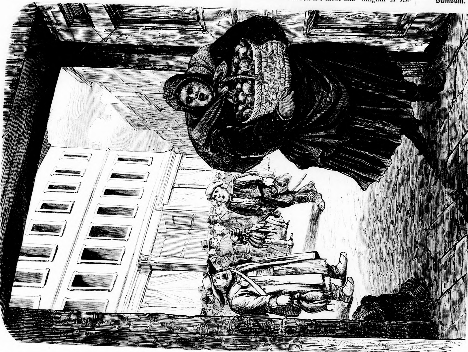
FÜVÁROSI ALAKOK. (Lásd a 334. lapon.)

Bumbum. Nem az a kérdés, jó helyen van-e, hanem hogy rögtön ide vezesse őt.