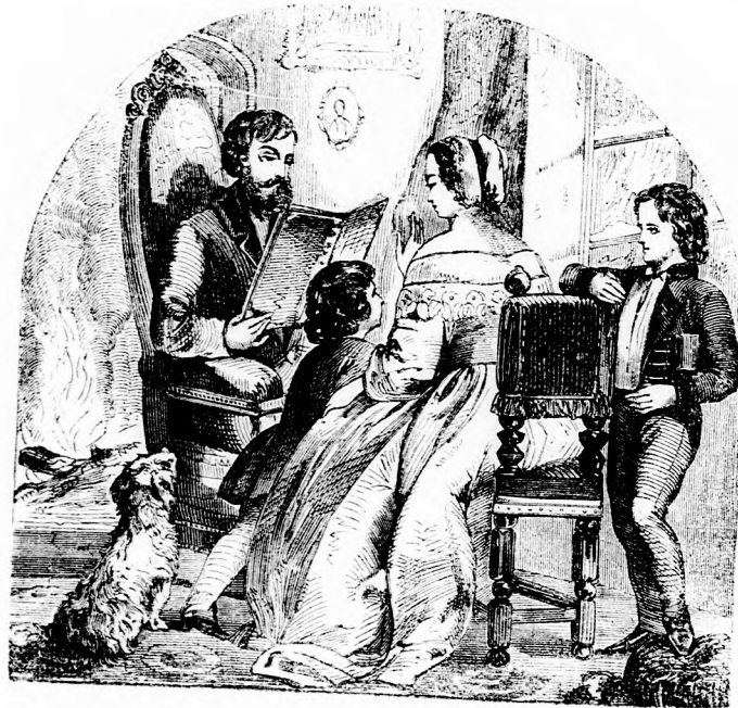
CSALÁDI KÖR. (Lásd a 350. lapon.)

Mezei. Igen. De a magyarázatokat hagyjuk máskorra, most menjünk e zord helyről házamba s ott vidám lakománál örvendezzünk a sok viszontagság szerencsés végének. (Bumbumhoz.) Ön fogoly ugyan, de ne féljen, a magyar ember nem áll boszut fogoly ellenségén; katonáival