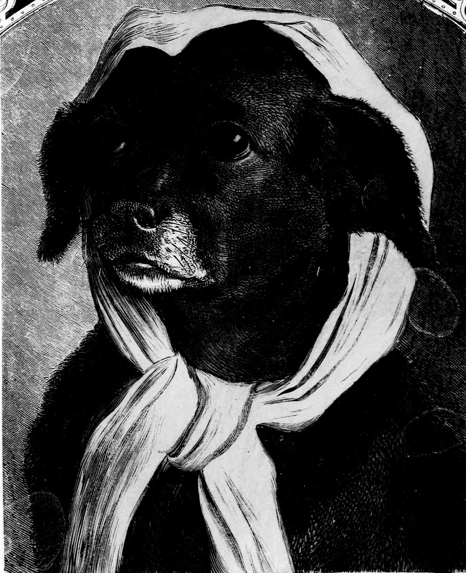
A MI CSÓKA KUTYÁNK. (Lásd a 350. lapon.)