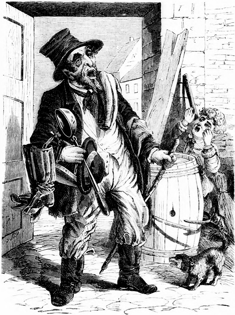
A HÁZALÓ. (Lásd a 350. lapon.)