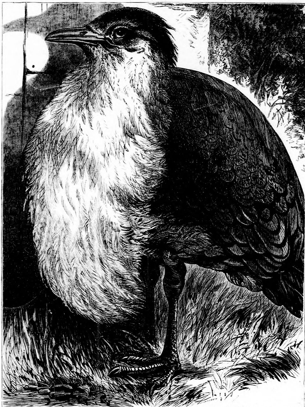
A BUSZTARD. (Lásd a 410. lapon.)

Felelős szerkesztő: Forgó bácsi . Kiadó-hivatal: Budapest, barátok tere, 7-ik sz., Athenaeum-épület.