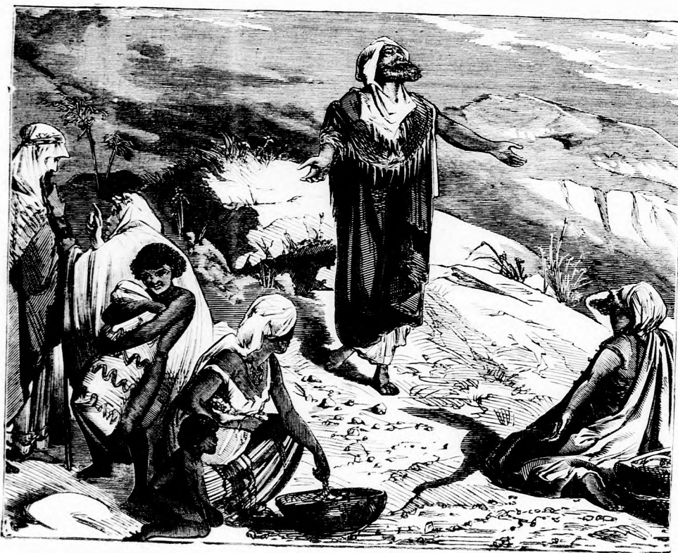
Mit ábrázol e jelenet?