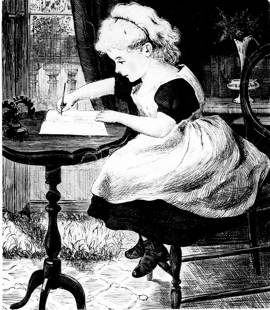
ILONKA LEVELE. (Lásd a 410. lapon.)