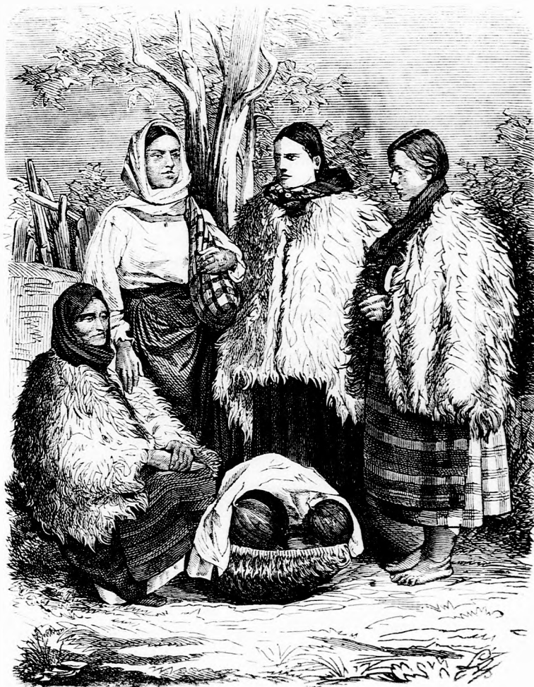
MARMAROSI OLÁH NŐK. (Lásd a 410. lapon.)

Végre azonban felöltötte ismét saját ruhát s megindulhatott hazafelé. Azt nem vette észre, hogy mindenütt nyomában