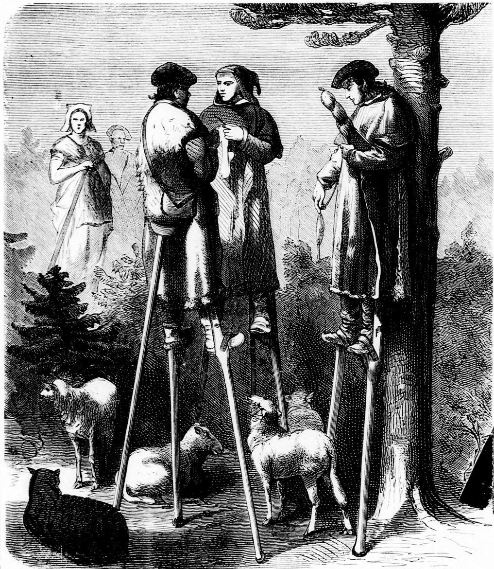
HOSSZULÁBU PÁSZTOROK. (Lásd a 158. lapon.)

Felelős szerkesztő: Forgó bácsi . Kiadó-hivatal: Budapest, barátok tere, 7-ik sz., Athenaeum-épület.