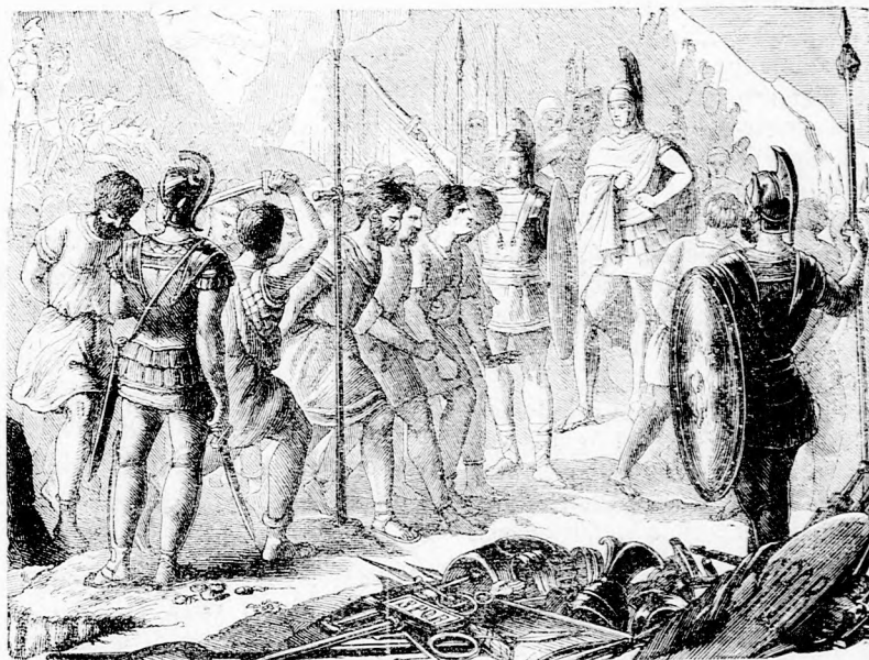
KÉT EZER ÉV ELŐTT. Legyőzött hadsereg hódolása.

gök, aminőktől most iszonyodva elfutnánk, az leginkább abból is eredt, hogy folytonosan háboruban éltek s ez megkeményítette szívöket. Az ifju alig hogy emelni bírta a kardot, már ment a hadsereggel messze földre idegen népeket hódítani; a bátorság, vitézség volt az ifjak legszebb disze, csak ez által juthattak becsüléshez, úgy hogy a jó szülök, bármennyire szerették fiókat, inkább kívánták, hogy meghaljon, mintsem azt hallják róla, hogy a csatából csufosan megfutott. A vitézek tehát harczoltak is nagy hősiességgel, már csak