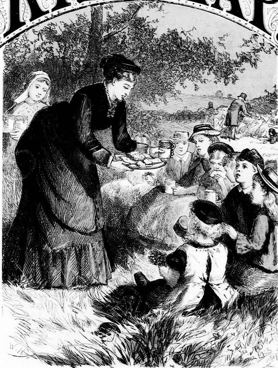
MAJÁLIS. (Lásd a 318. lapon.)