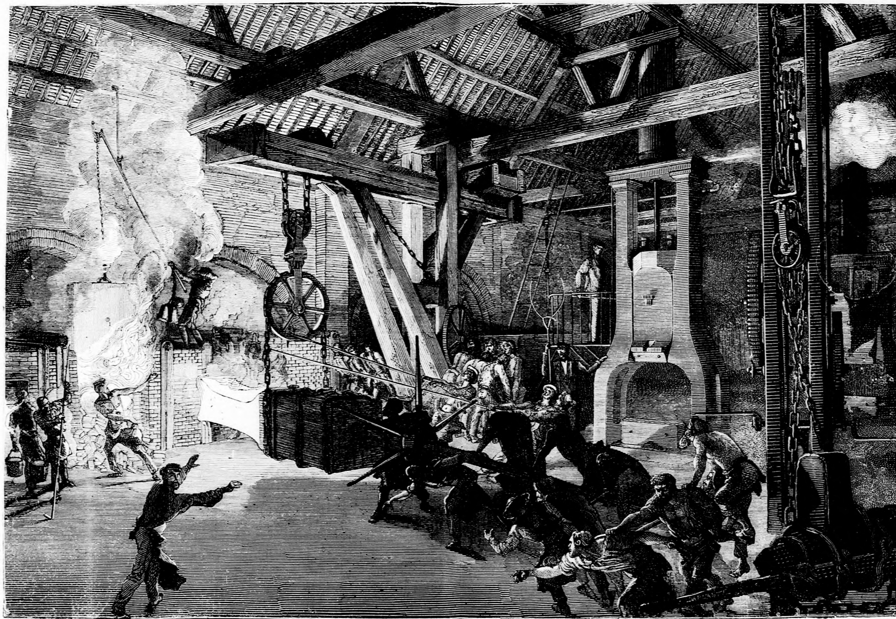
A VASGYÁRBAN. (Lásd a 318. lapon.)