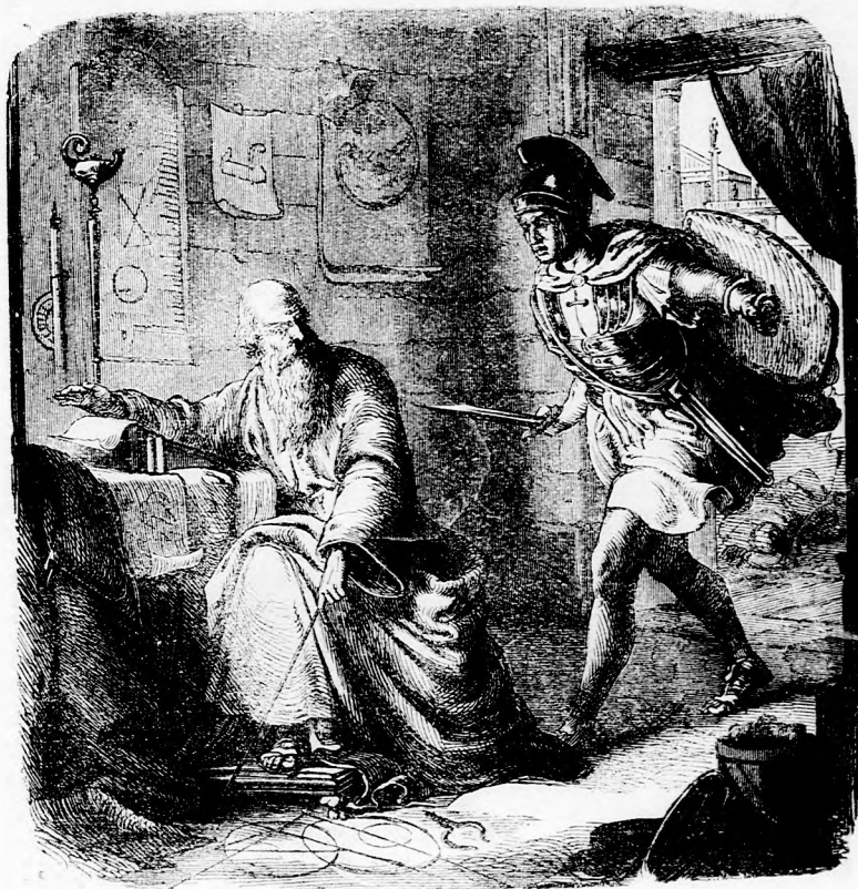
KÉT EZER ÉV ELŐTT. Tudós és katona. (Lásd a 310. lapon.)

Lenke kétségbeesetten zokogott és sok idő telt bele, míg végre kissé megnyugodott. Több heti munkája kárba veszett s az intézetbe vissza kellett mennie pályamű nélkül, mikor pedig tőle, a legjobb rajzolótól várták a legszebb munkát. Pi-