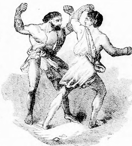
KÉT EZER ÉV ELŐTT. A viadorok.

Hogy akkor az embereknek olyan kegyetlen muatságokban telt gyöngyörüsé-