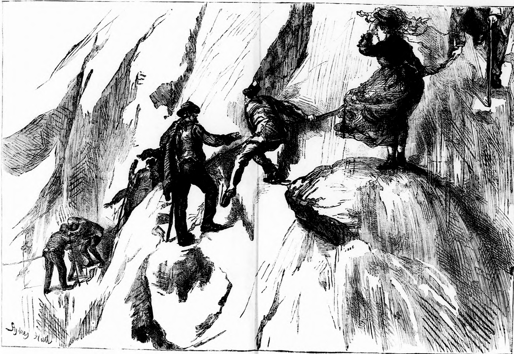
KIRÁNDULÁS AZ ALPESEKBE: Sia a hó-csucson. (Lásd a 28. lapon.)

mert a vén bűvész megragadta a harapófogót, nyakánál fogva beleszipte Mimikét és aztán — rettenetes! — belemártotta a forró üstbe!