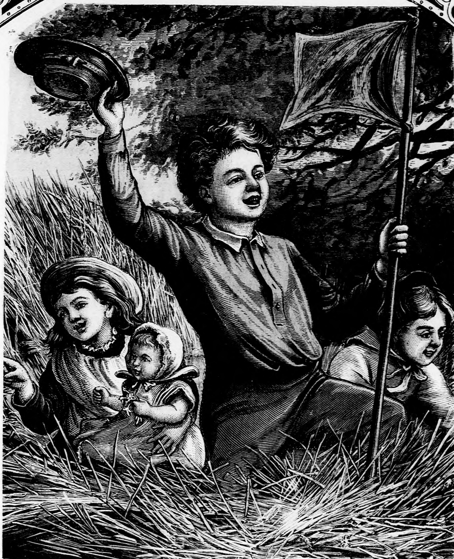
NYÁRI DÉLUTÁN. (Lásd a 30. lapon.)