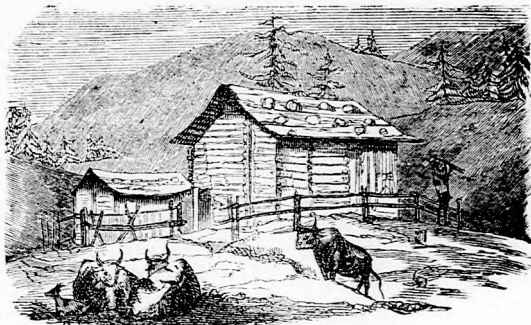
KIRÁNDULÁS AZ ALPESEKBE:

Danika annyira le volt verve, hogy többé nem is tett semmi ellenvetést, nem kért semmit, csak zokogott esőndesen. Samu bácsi kézen fogta a kis fiut s ismét lementek; kérdezősködtek a házban mindenkinél, de hasztalan; senki sem tudott semmit és nem is igen törődött a szegény fiúcskával. Danika