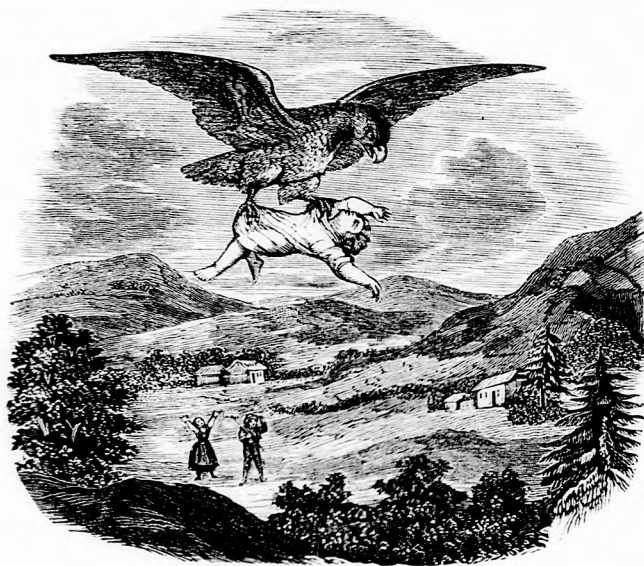
KIRÁNDULÁS AZ ALPESEKBE: Gyerekrabló keselyű. (Lásd a 28. lapon.)

Ilyen hegyes vidék a mi szép hazánkban is van, a Kárpátokban és Erdélyben; de még ezeknél is nagyobb hegységek emelkednek a Svajczban, Tiroiban (keresétek meg a térképen) s ide minden nyáron sok ezer utas gyűl össze. Az óriási heglánczok, melyek ott több országon végig terjednek, Alpeseknek neveztetnek s itt találhatók a legmagasabb hegycsúcsok egész Európában, mint ezt már bizonynyal közületek is sokan tudják a földrajzból.