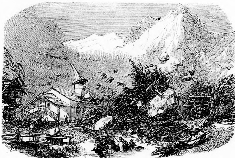
KIRÁNDULÁS AZ ALPESEKBE: Lavina omlás. (Lásd a 28. lapon.)

A jó öreg doktor bácsi maga is nagyon elkomolyodott. Igazán meghatotta a szegény gyermek szerencsétlensége, az-