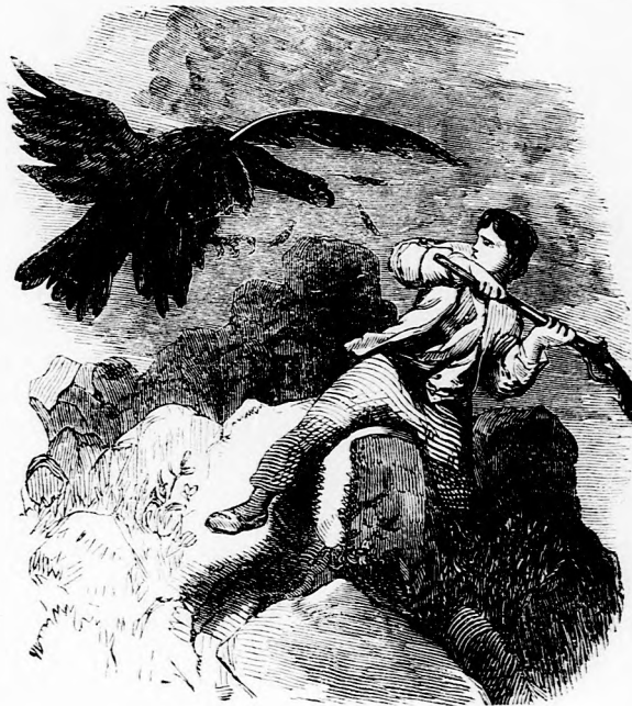
KIRÁNDULÁS AZ ALPESEKBE: Viadal a keselyűvel.

magasabbra érnek, annál veszedelmesebb az út. A sziklát hó és jég borítja közben szédítő mélységű repedések, örvények tártonganak, melyekbe ha valaki beesik, veszve van menthetetlenül. Sok ilyen repedésen pedig keresztül kell ám ugorni s a városi ember, aki effélékhez szokva nincs, bizony keresztül nem jutna ott. De a tapasztalt vezetők tudnak segíteni. Hosszu kötelet visznek magukkal s ha