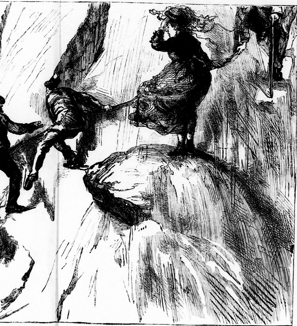
AZ ALPESEKBE: Sza a hó-csucson. (Lásd a 28. lapon.)

— Nos, úgy látom, nem tetszik neked ez az új állapot? Persze, nem olyan kellemes, mint a régi volt: