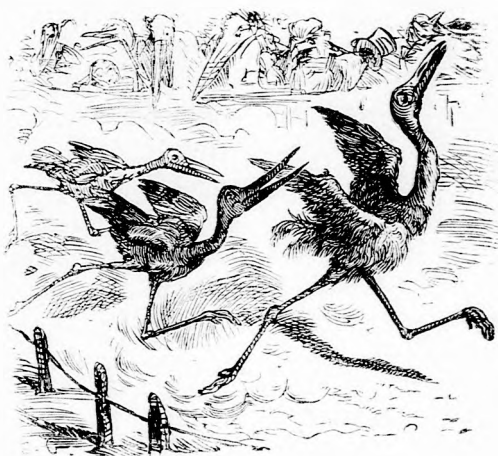
GÓLYAVERSENY. A pálya közepén.