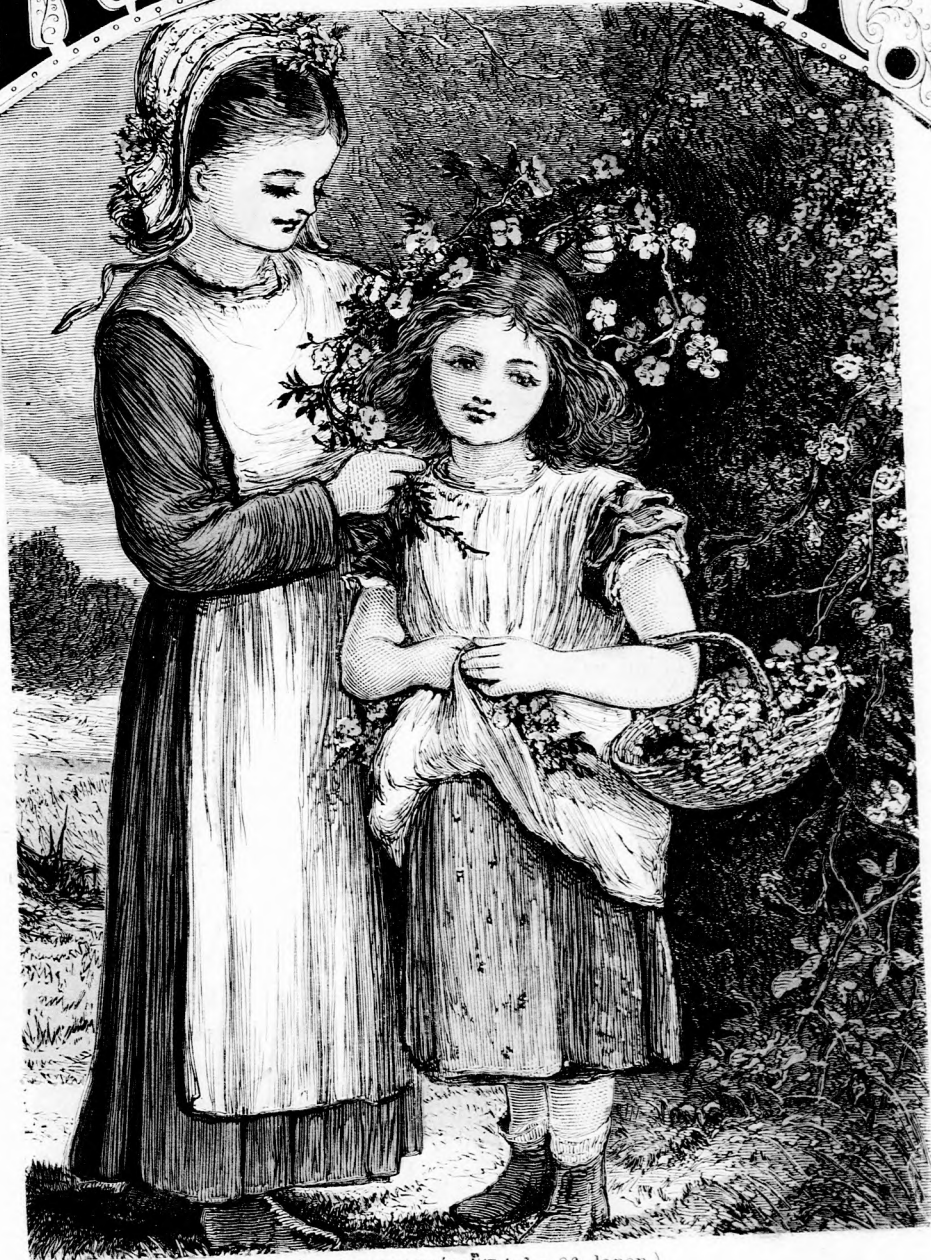
A KÉT TESTVÉR. (Lásd a 86. lapon.)