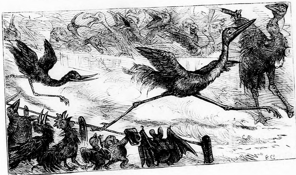
GÓLYAVERSENY. Fülgláb diadala. (Lásd a 94. lapon.)

A mint a nagy kórház - épülethez közeledtek, Dani- ka mindinkább ko- molyabb lett és szorosabban odasimult Samu bácsihoz. Eddig csak örült, hogy ismét látni fogja mamáját de most, midőn megpillantá a