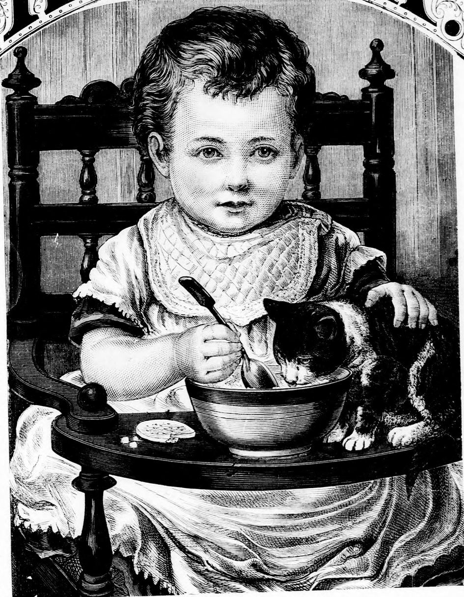
MEGOSZTOTT REGGELI. (Lásd a 218. lapon.)

14. szám. — 1877. Ára negyedévre 1 frt. 40 kr.