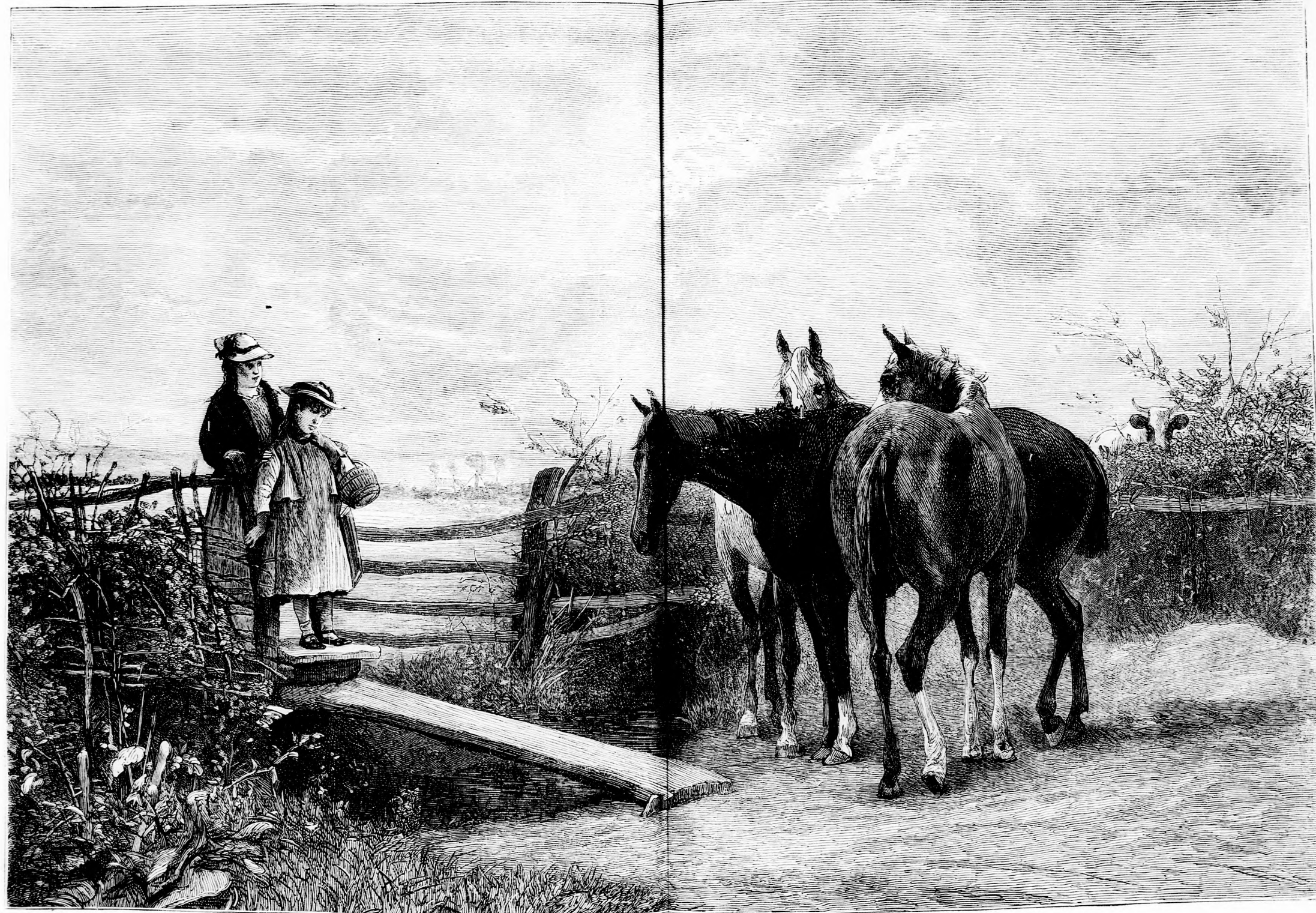
AZ AKOL ELŐTT. (Lásd a 214. lapon.)