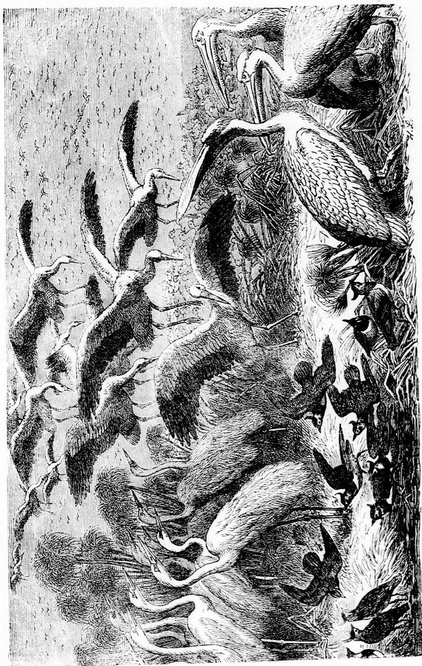
MADARAK KÖLTÖZÉSE. II. Megérkezés a déli vidékre. (Lásd a 214. lapom.)