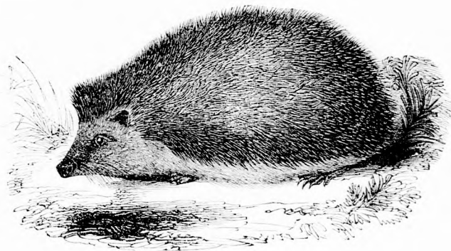
A SÜN (Lásd az 218. lapon.)

Ezt magam is hittem, — mert az egész osztályban senki sem mert még csak gondolni sem arra, hogy Gábor és Károly fölé kerülhessen; ők ketten voltak az osztály jelesei s mivel Károly betegeskedett, Gábor volt igazán az első.