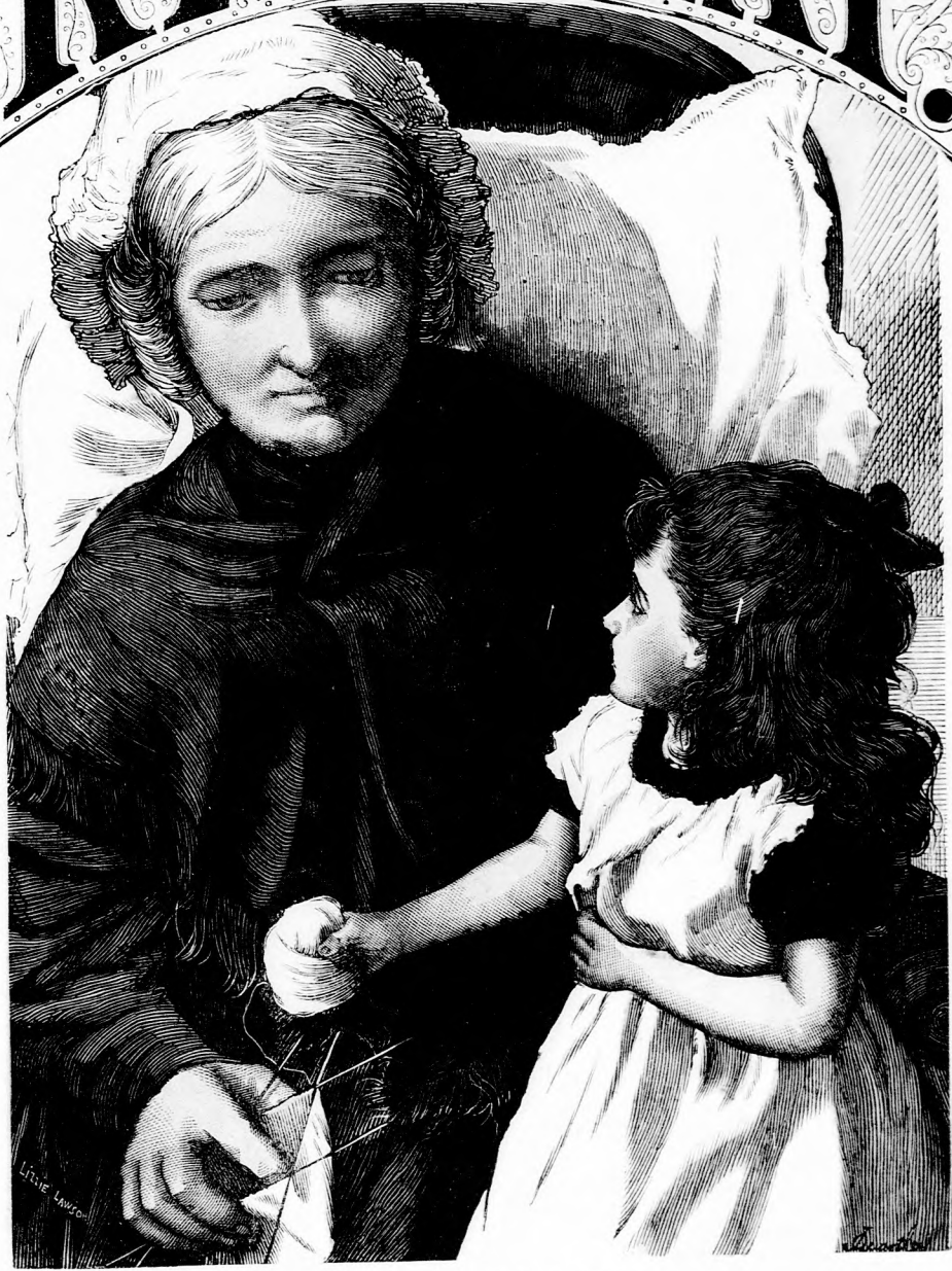
»MAJD ÉN!« (Lásd a 323. lapon.)