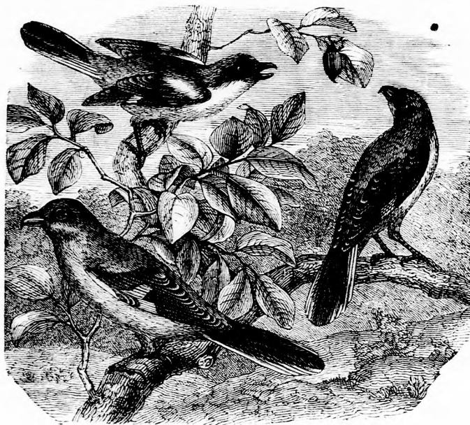
»A HÁROM TESTVÉR TANÁCSKOZNI KEZDETT.« (Lásd a 330. lapon.)

— Ah, egy kis madárka! Milyen gyönyörű! szólt a beteg leánya, szinte ki-