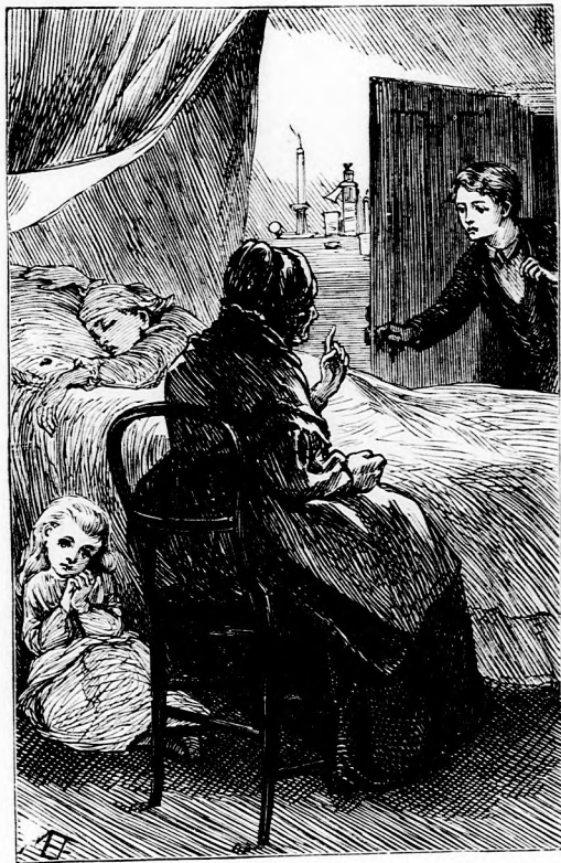
KIS BETEG (Lásd a 334. lapon.).

Ily módon mindkét kis beteg türethetőleg meg volt elégedve sorsával s főleg a madárka már jóformán feledni is kezdé, hogy az ő testvérei, rokonai kiut az erdőben szabadon röpkednek, míg ő fogságban él. Egy este pedig, midőn Mariska mamája és testvére hazaérkeztek és szokásuk szerint legelőször is