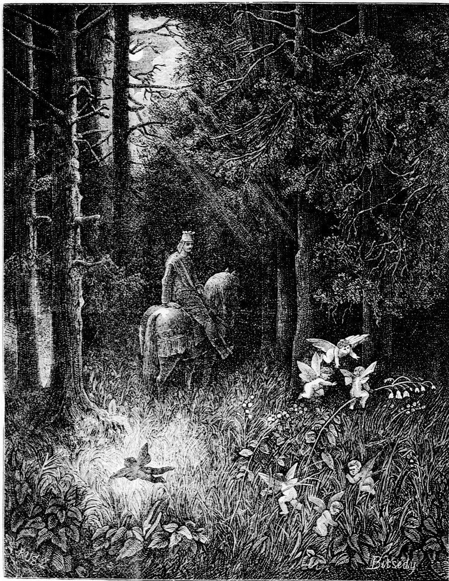
ÁZ ELVESZETT KIRÁLYFI. (Lásd a 326. lapon.)

Felelős szerkesztő: Forgó bácsi . Kiadó-hivatal: Budapest, barátok-tere, 7-ik sz., Athenaeum-épület. Budapest 1877. Nyomtatja a kiadó-tulajdonos: Athenaeum irodalmi és nyomdai részv. társulat. Megjelen hetenként egyszer, 16 oldalon.