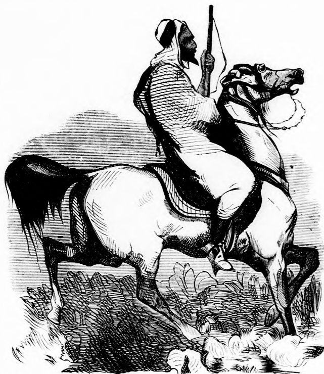
HÍRES LOVASOK. Arab vitéz. (Lásd a 335. lapon.)

kirakata előtt, nem tudta magát elszánni, mit vegyen. Estére járt az idő, Andorka már ismét otthon volt, — zsebében a tizeskével, melylyel igazán nem tudott mit csinálni. Mert azt mégtanulta szüleitől, hogy merőben haszontalanságra egy fél-