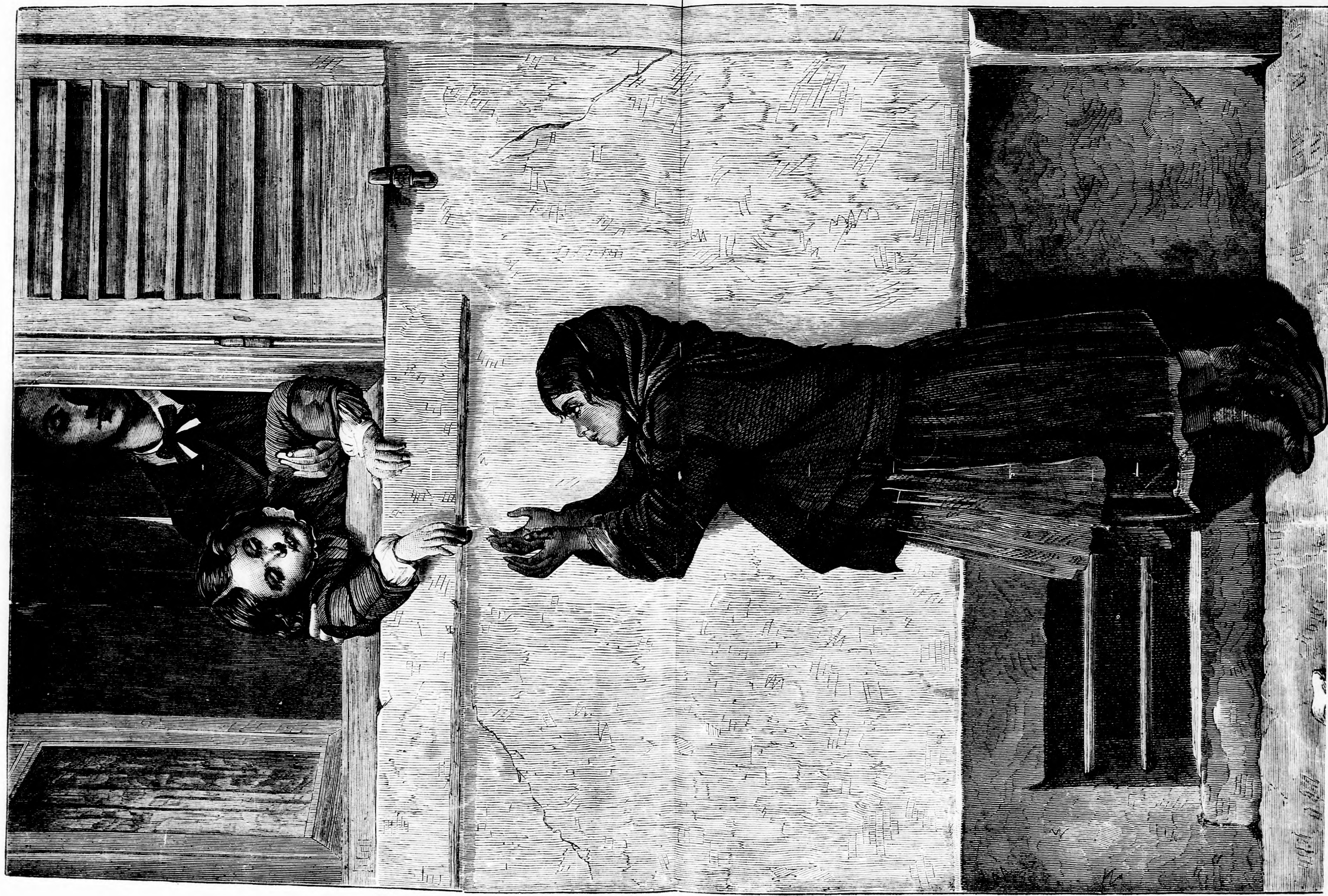
A KIS ANDOR TIZESKÉJE. (Lásd a 324. lapon.)