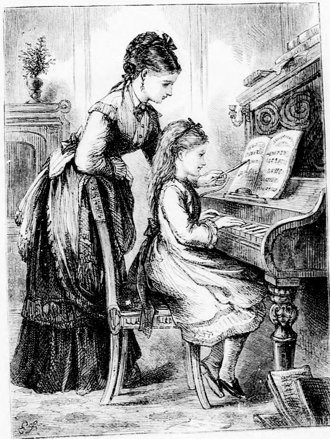
ZONGORA-LECKZE. (Lásd a 15. lapon.)

— Egy holt hernyót odateszek, nem bánom! szólt Katicza nagy elszántsággal.