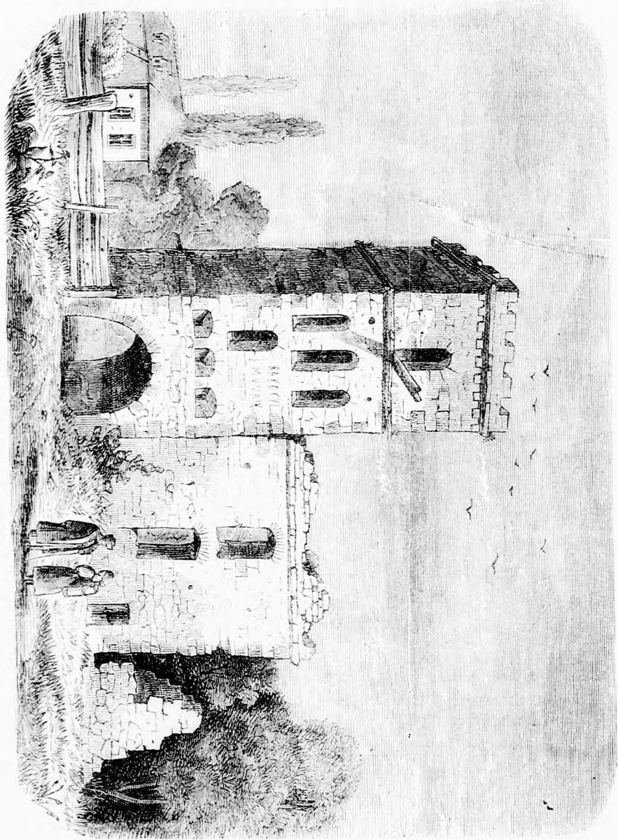
ENLEKER A MAGYAR TÖRTÉNELEBŐL. I. Rótkőzy tornya. (Lásd a 6. lapon.)