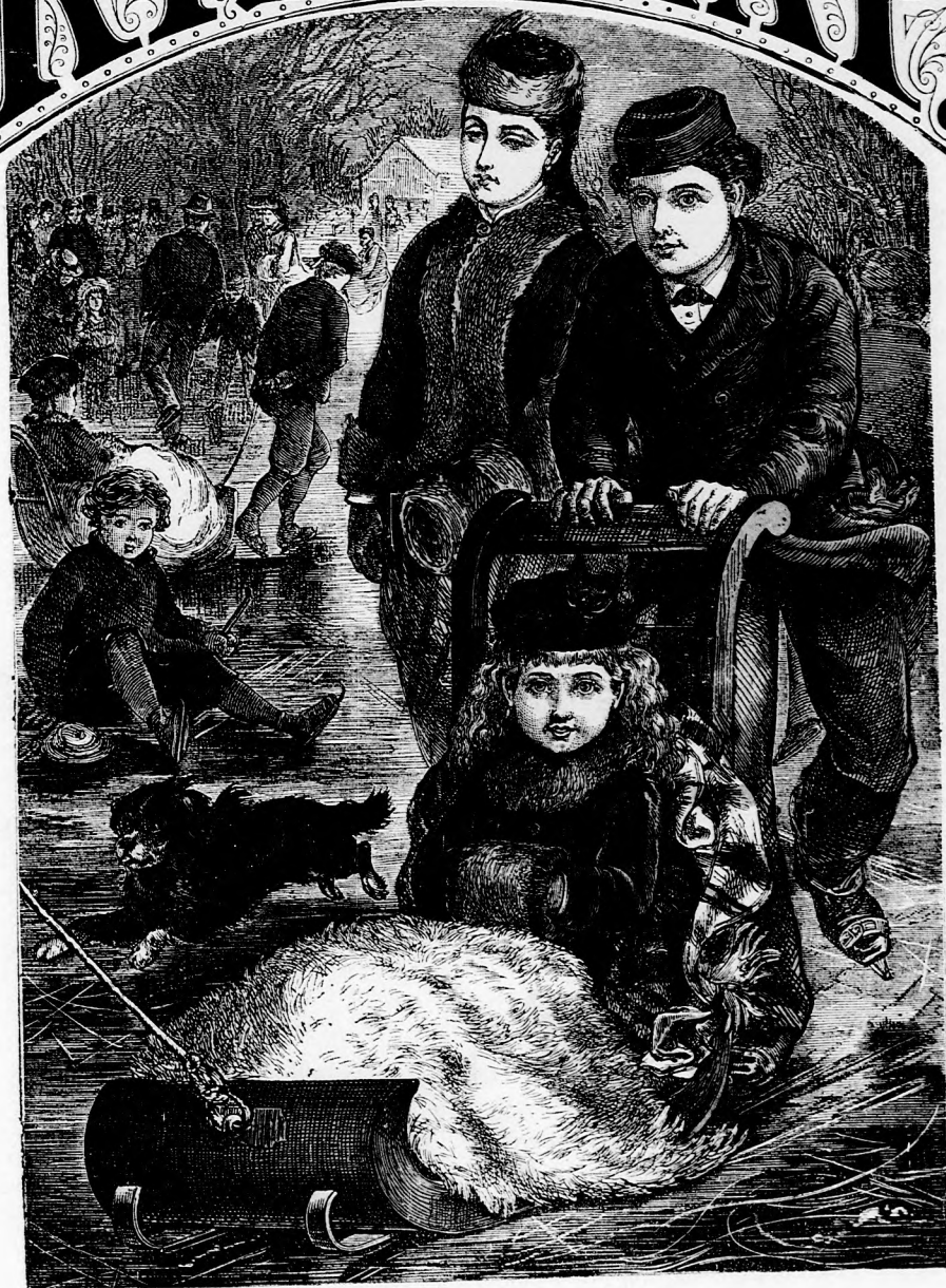
SZÁNKÓZÁS. (Lásd a 14. lapon.)