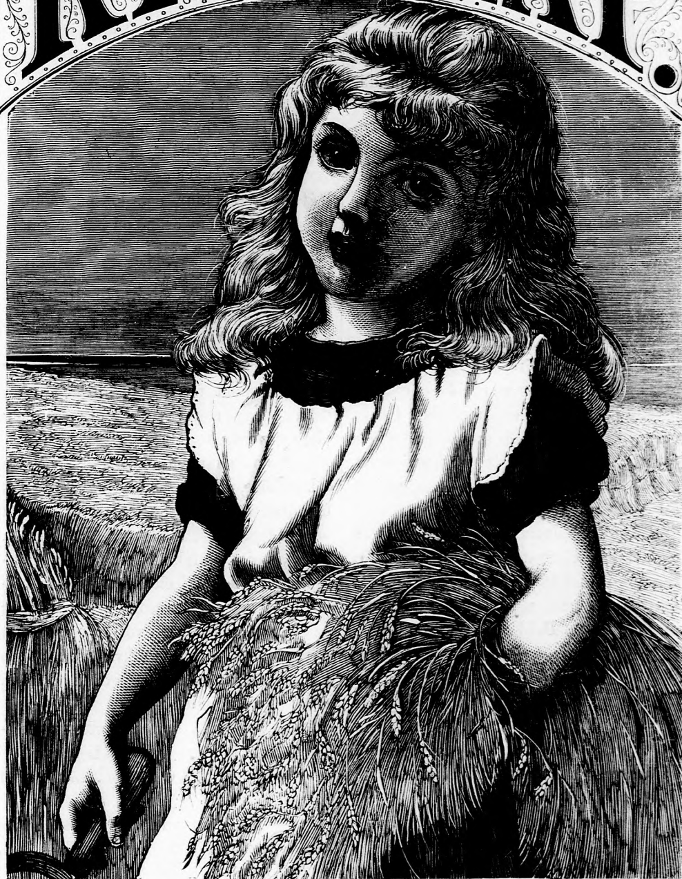
ARATÁS. Emmácska a mezőn. (Lásd a 47. lapon.)