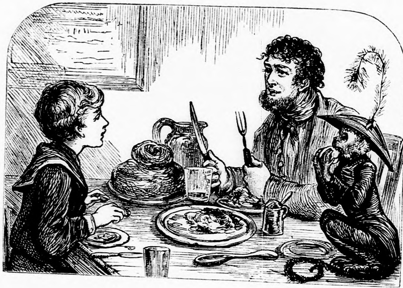
... A MAJOM FENT AZ ASZTALON ... (Lásd a 34. lapon.)