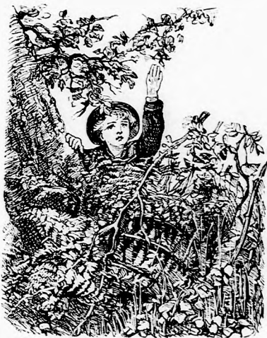
. . . KERESZTÜL KAPASZKODOTT A SÖVÉNYEN . . . (Lásd a 23. lapon.)

Megindult jobbra és jó ideig haladt előre, még pedig egy meglehetősen sűrű erdőcskében. Itt azonban csakhamar azt a kellemetlen fölfedezést tette, hogy már nem jár gyaloguton, hanem csak a száraz faleveleken, melyek bizony nem mutatnak irányt sehová. Visszafordult, hogy megint a gyalogutra térjen, — de hasztalan kereste, nem tudta többé megtalálni. Sokáig