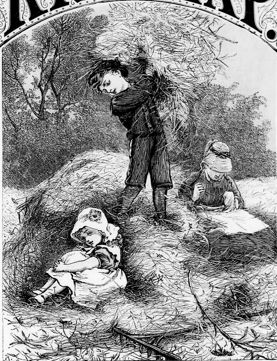
PALKA SZINTE ELTEMETTE A KIS LEÁNYT. (Lásd a 146. lapon.)