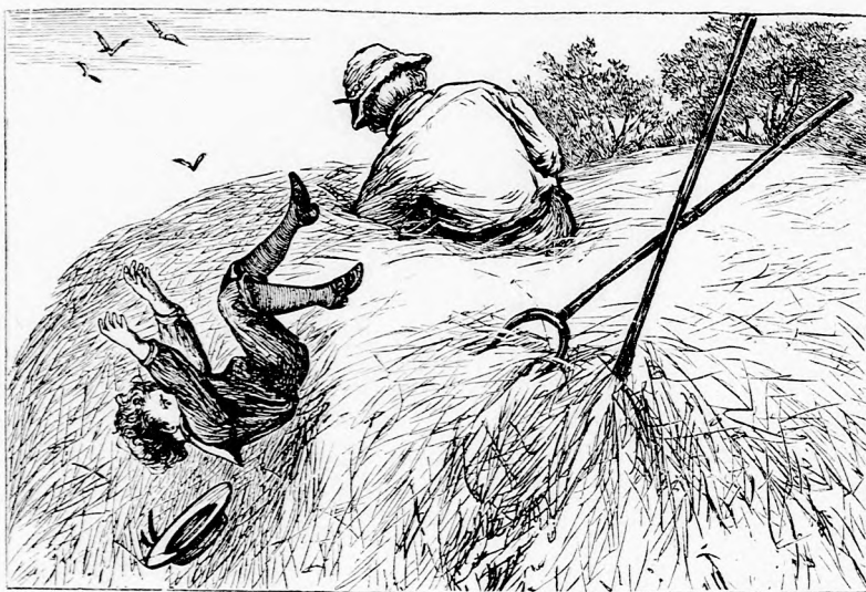
... LEBUKOTT A MAGASBÓL ... (Lásd a 147. lapon.)

Rudakból hamarosan nyugágyat kötözték össze, ráterítették szüreiket, puha szénával megrakták s rátették az eszméletlen fiucskát. Két ember aztán lassu léptekkel, óvatosan bevitte a faluba, épen