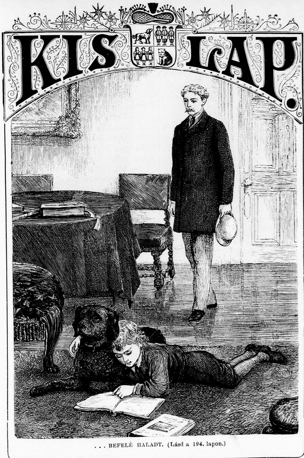
... BEFELÉ HALADT. (Lásd a 194. lapon.)