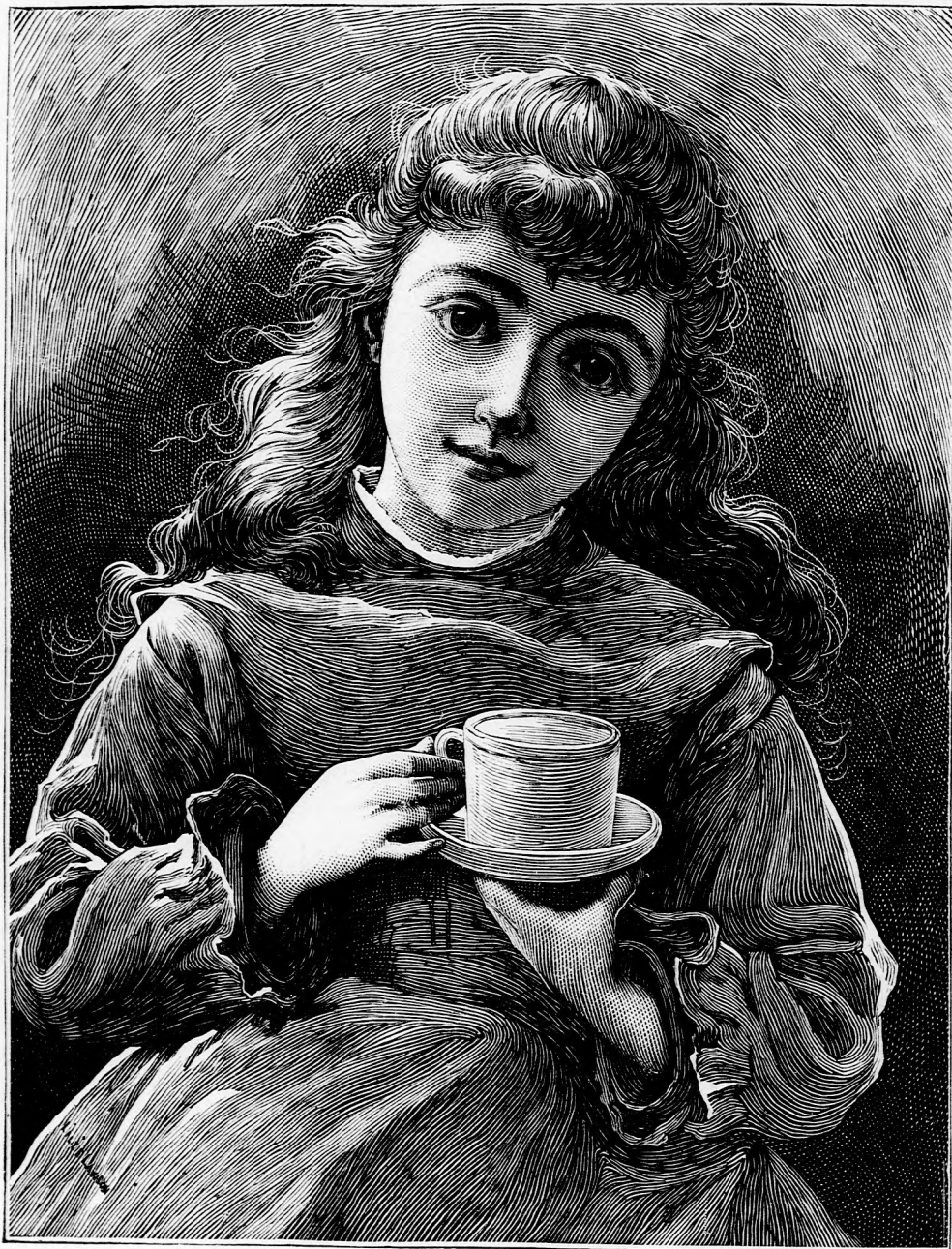
ÁZ A DÁTHA! (Lásd a 206. lapon.)

Felelős szerkesztő: Forgó bácsi . Kiadó-hivatal: Budapest, barátok-tere, 3-ik sz., Athenaeum-épület. Budapest 1878. Nyomtatja a kiadó-tulajdonos: Athenaeum irodalmi és nyomdai részv. társulat. Megjelen hetenként egyszer, 16 oldalon.