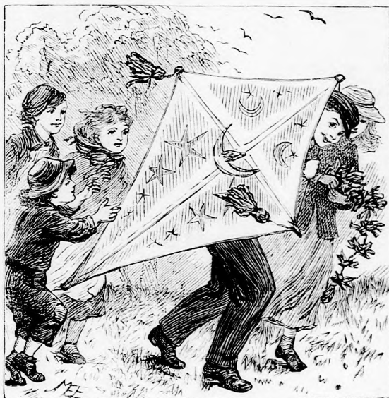
SARKÁNY-EREGETÉS. (Lásd a 198. lapon.)

szeres szeretettel és gyöngédséggel igyekezett jóvátenni elébbi hibáit; derék, kedves ifju volt, kit csakhamar az egész vidék megszeretett; vendégek ismét sűrűn látogatták a kastélyt, vidám élet folyt a fényes termekben s a nemes grófarczán soha sem láttak többé szomorúságot Teljesen