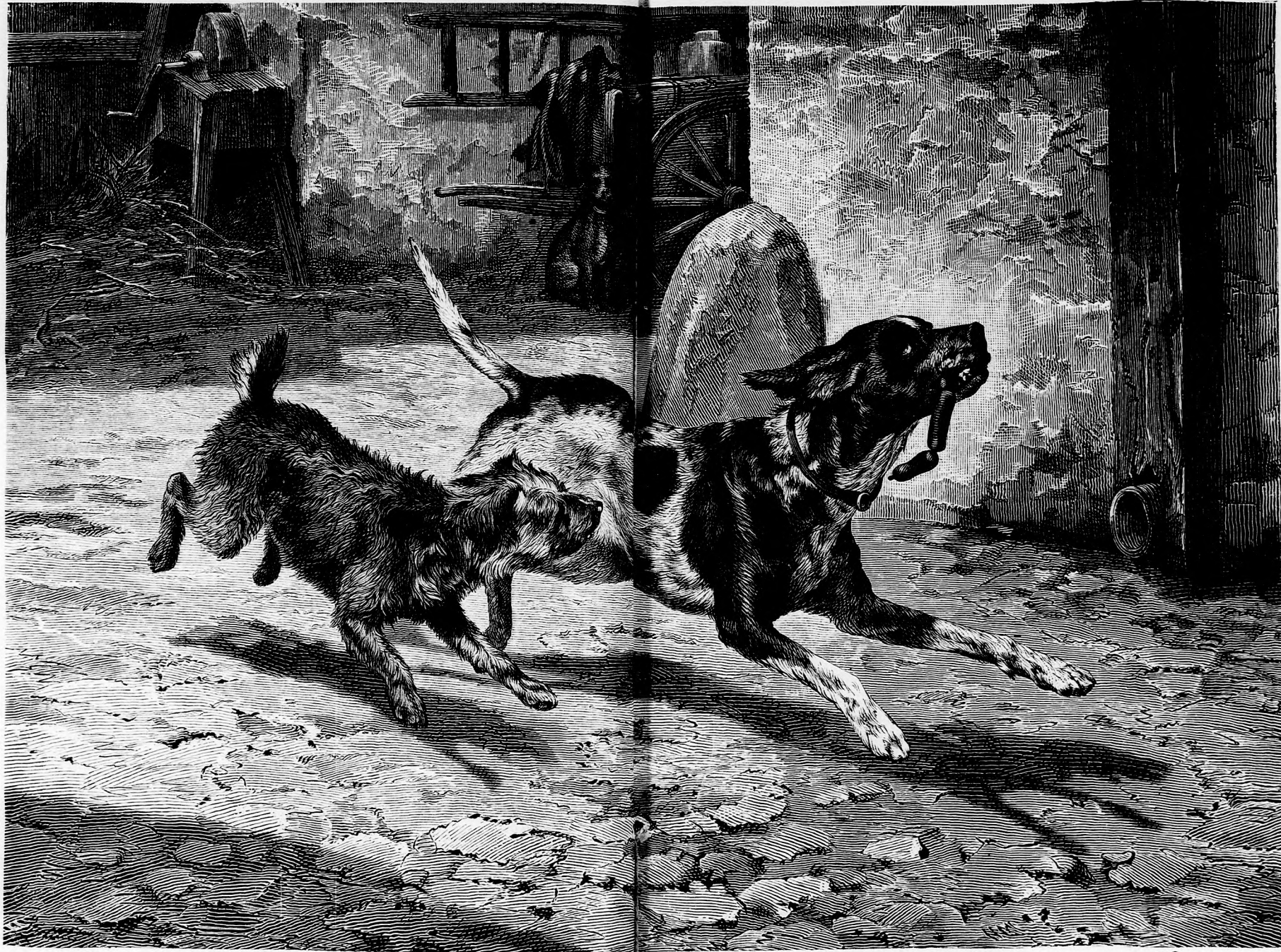
AZ IRIGY PAJTÁS. (Lásd a 202. lapon.)