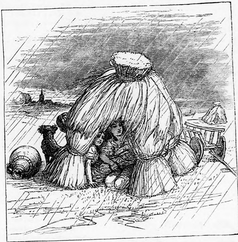
MEZEI ESERNYŐ. (Lásd a 292. lapon.)

De nem csak a fejedelmekről gondoskodott az engesztelhetetlen ördög, népeiket is körükbe gyűjté, hadd gyönyörköd-