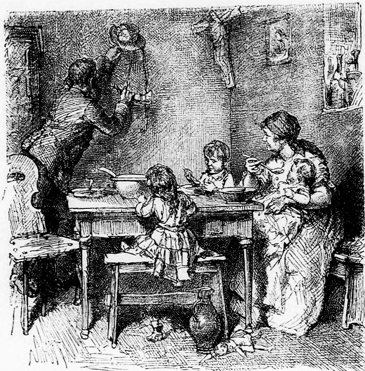
VASUTI-ŐR ÉS CSALÁDJÁ. (Lásd a 102. lapon.)