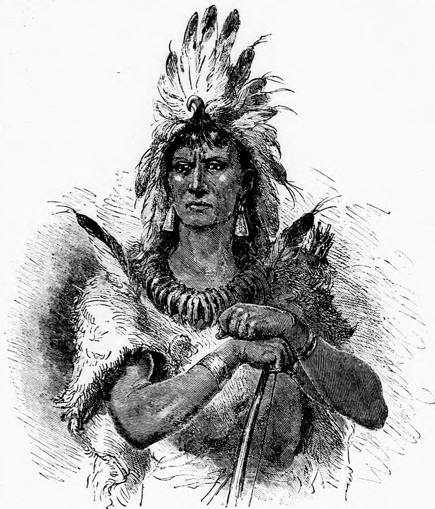
INDIÁN TÖRZSFŐNÖK. (Lásd a 111. lapon.)

— Apácska egész nap távol volt s én egymagam voltam otthon. Én végeztem el minden dolgot kis lakásunkban főztem is és örültem, ha apácska meg volt