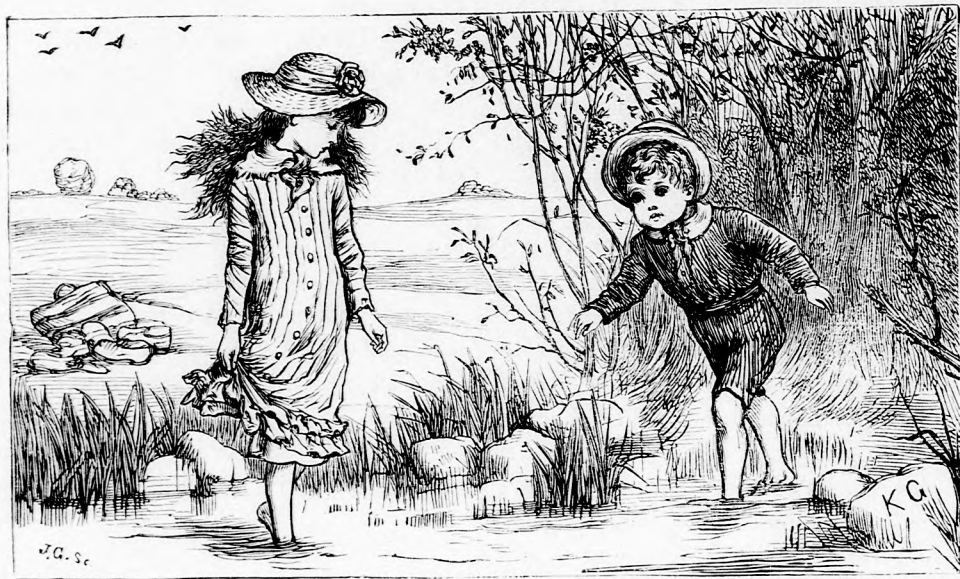
. . . A VIZBEN PACSKOLTAK.

Piroska jól látta, csakugyan nagy zivatar közeledett s mint tikkasztó nyári napokban szokott, a néhány órával előbb