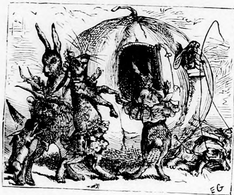
... AZ ÖREGEK IS GYALOG MENTEK.

radtak a sétába, végre hozzáláttak a lakomához. Nyulmama volt a gazdasszony s szép tisztás helyen terített föl, gondol-