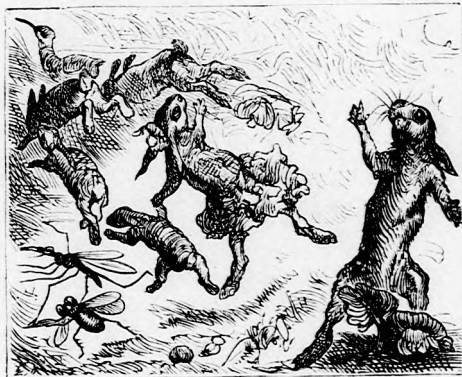
. . . HALÁLOSAN TALÁLTA A GOLYÓ.

— Oh, hogy nem hallgattam az okos tanácsra s nem gondoltam egyébre, mint multságomra! Most életemmel lakolok!