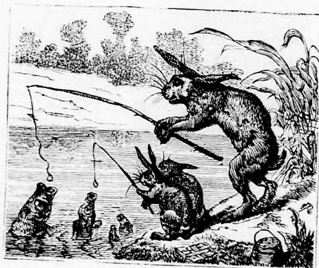
... TAPSIFÜLES ... FIAIVAL HALÁSZGATOTT.