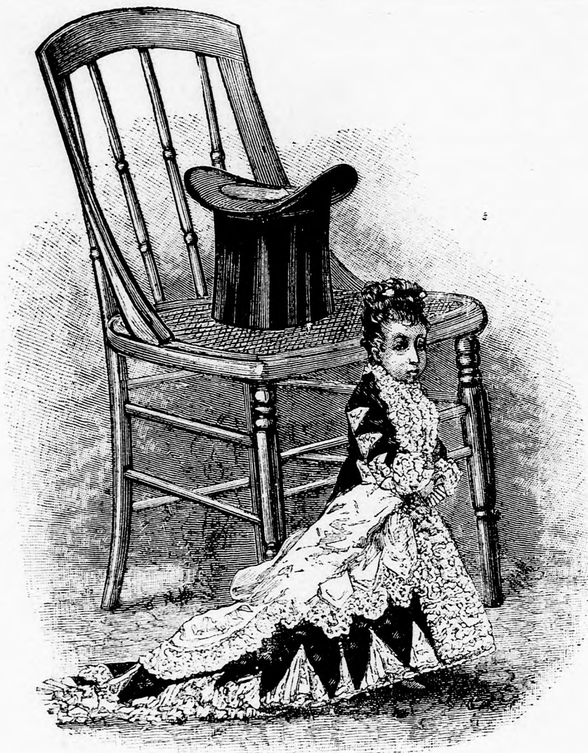
EGY PICZURKA KISASSZONYRÓL. (Lá d a 326. lapon.)

Felelős szerkesztő: Forgo bacsí . Kiadó-hivatal: Budapest, barátok-tere, 3-ik sz., Athenaeum-épület Budapest 1879. Nyomtatja a kiadó-tulajdonos: Athenaeum irodalmi és nyomdai részv. társulat.