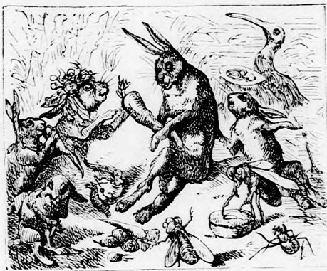
. . . AZ EGÉSZ TÁRSASÁG VIGAN FALATOZOTT.

— Oh persze, vitézkedék Tapsifüles. Előbb már csak körülnézek . . .