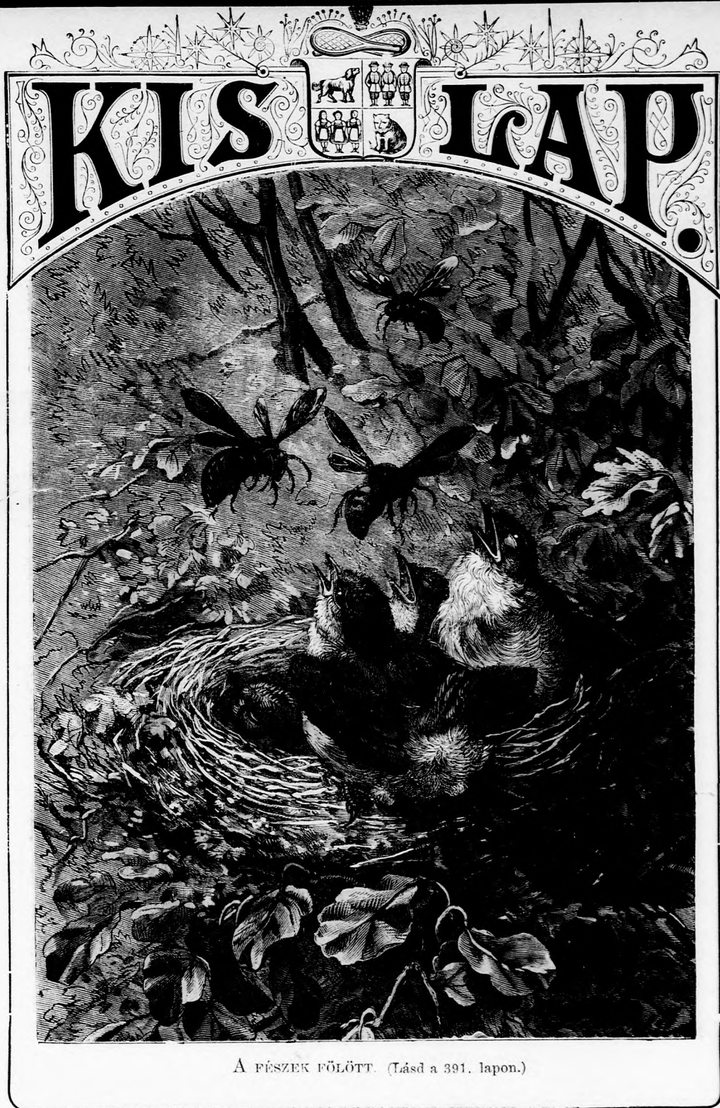
A FÉSZEK FÖLÖTT. (Lásd a 391. lapon.)