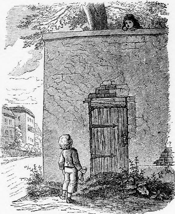
MAGAS KŐFAL, ZÁRT AJTÓ. (Lásd a 390. lapon.)

oda, hanem játszott vagy csinált valamit; Gyuricza pedig rendesen abba hagyta az olvasást s a könyvében levő képecskéket bámulta; mikor aztán Elemér megint odagondolt, a leczke ideje már elmúlt, beérte tehát azzal, hogy szigoruan megpirongatta Gyuriczát és kiküldte, hozzátevéen, hogy most már nincs többé ideje,