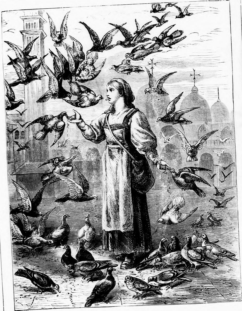
A VELENCZEI GALAMBOK. (Lásd a 398. lapon.)

Felelős szerkesztő: Forgó bácsi . Kiadó-hivatal: Budapest, barátok-tere, 3-ik sz., Athenaeum-éj Budapest 1879. Nyomtatja a kiadó-tulajdonos: Athenaeum irodalmi és nyomdai részv. társulat. Megjelen hetenként egyszer, 16 oldalon.