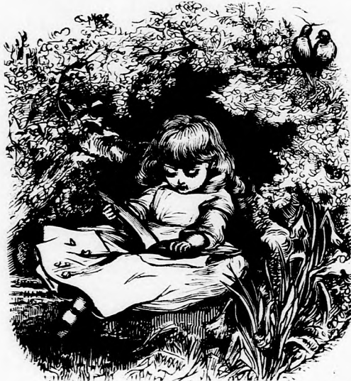
ÉN VAGYOK A . . . (Lásd a 398. lapon.)

Más nap nem kevesebb tüzzel fogott hozzá a tanításhoz, remélve, hogy most még tovább fog haladni növendékével. Csakhogy szörnyü meglepetés várt reá. Gyuricza egyetlen egyet sem ismert meg a betűk közül, melyeket tegnap látott, s hogy melyik az A. , ép oly kevésé tudta, mint mikor Elemér először mutatta. Ebben persze semmi csodálatos, mert a kis fiu nem volt hozzá szoktatva, hogy megtartson az eszében valamit, a minek a hasznát nem látta; de Elemérnek ez nem jutott eszébe, s majd megpukkadt mérgében, mikor másnap söt harmadnap is legelől kellett kezdnie: A. B! Gyuricza egyik napról a másokra mindig szépen elfelejtette,