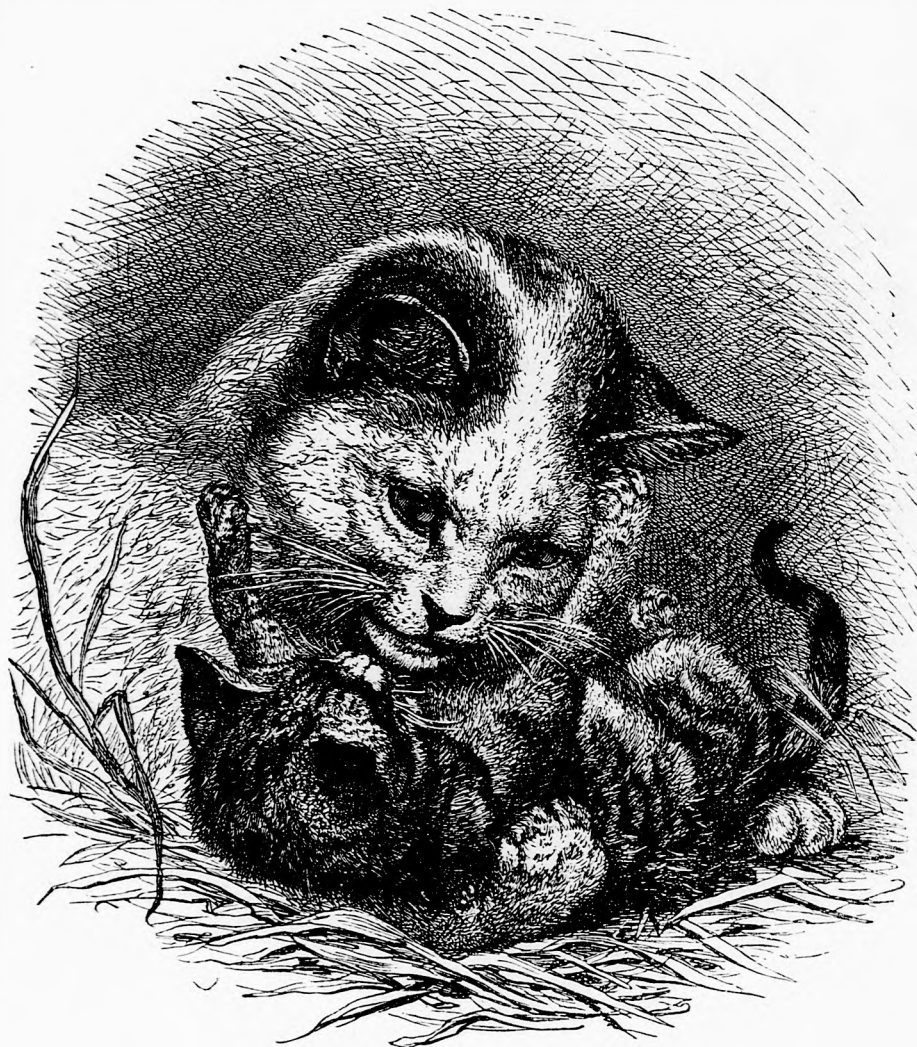
ANYAI ÖRÖM. (Lásd a 31. lapon.)