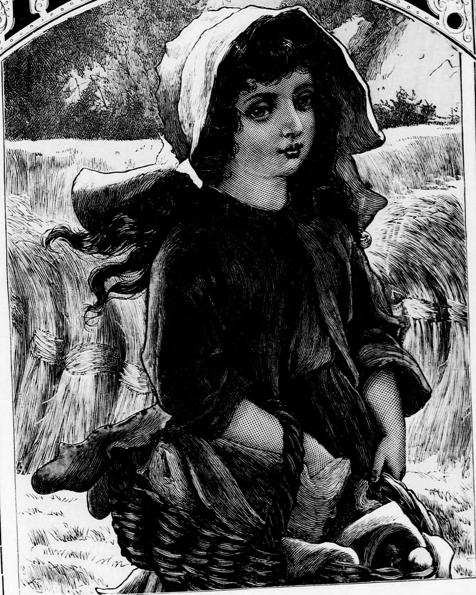
HAZA FELÉ. (Lásd a 22. lapon.)