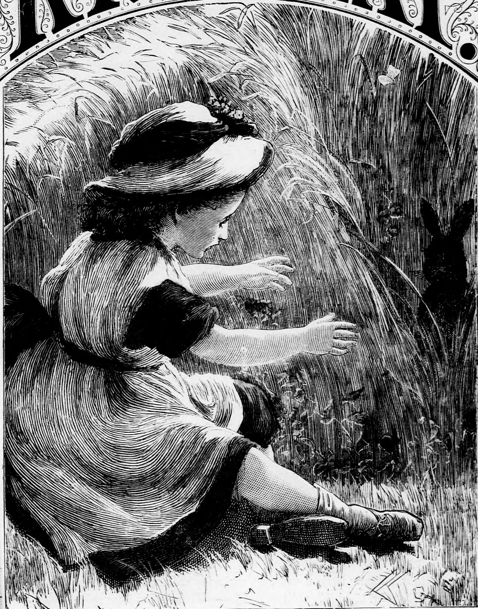
KEDVES TALÁLKOZÁS. (Lásd a 38. lapon.)