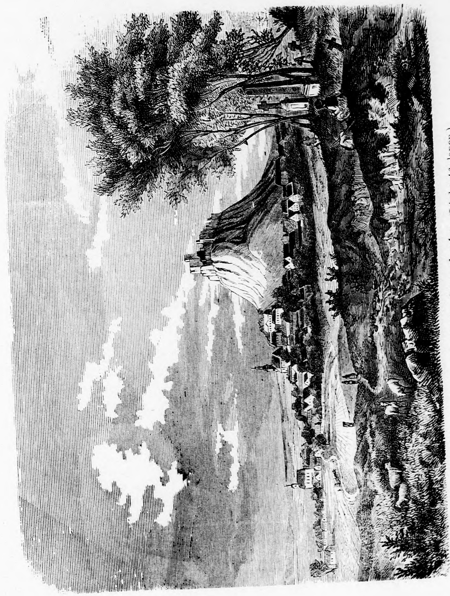
A BALATON VIDÉKÉRŐL. Sümegh vára. (Lásd a 46. lapon.)

ivatta nem advari merete Vég- el, az gy az elha- ed jó kedve nem tür- ilyen ni az telve szá- mint álli- gre- fel- egy rály, nék, még gen- föl- majd Bal- ette,