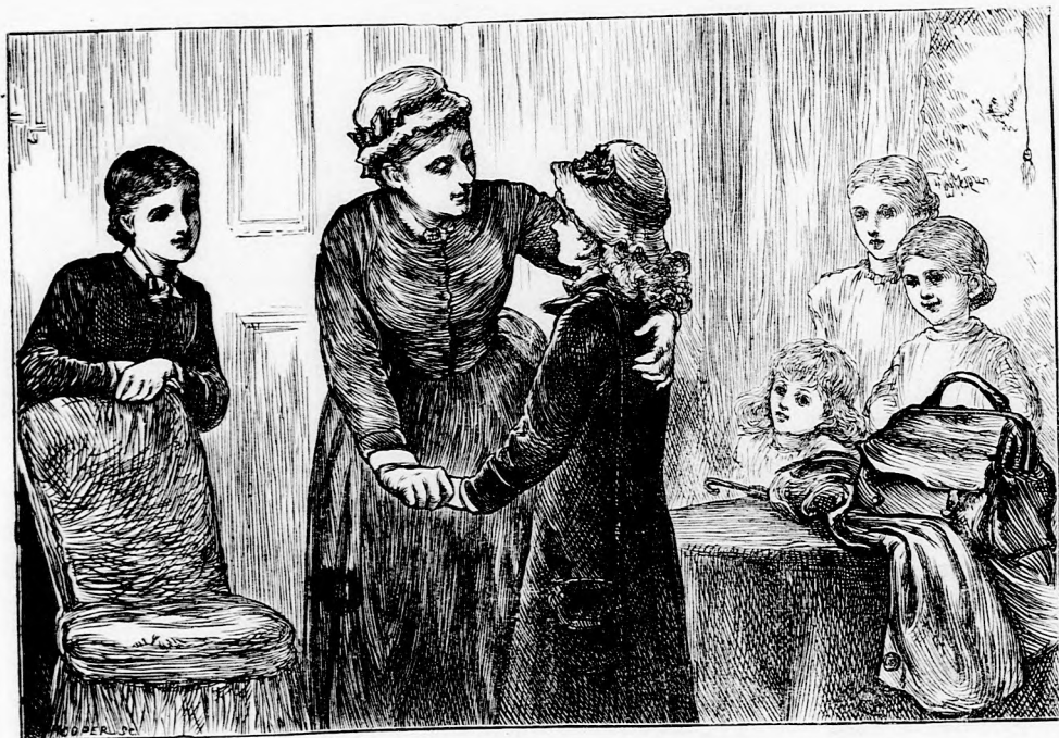
MEGÉRKEZETT. (Lásd a 47. lapon.)

Ekkor végre halk zörejt hallatszott az órából, a kis ajtó megnyílt és a kakuk