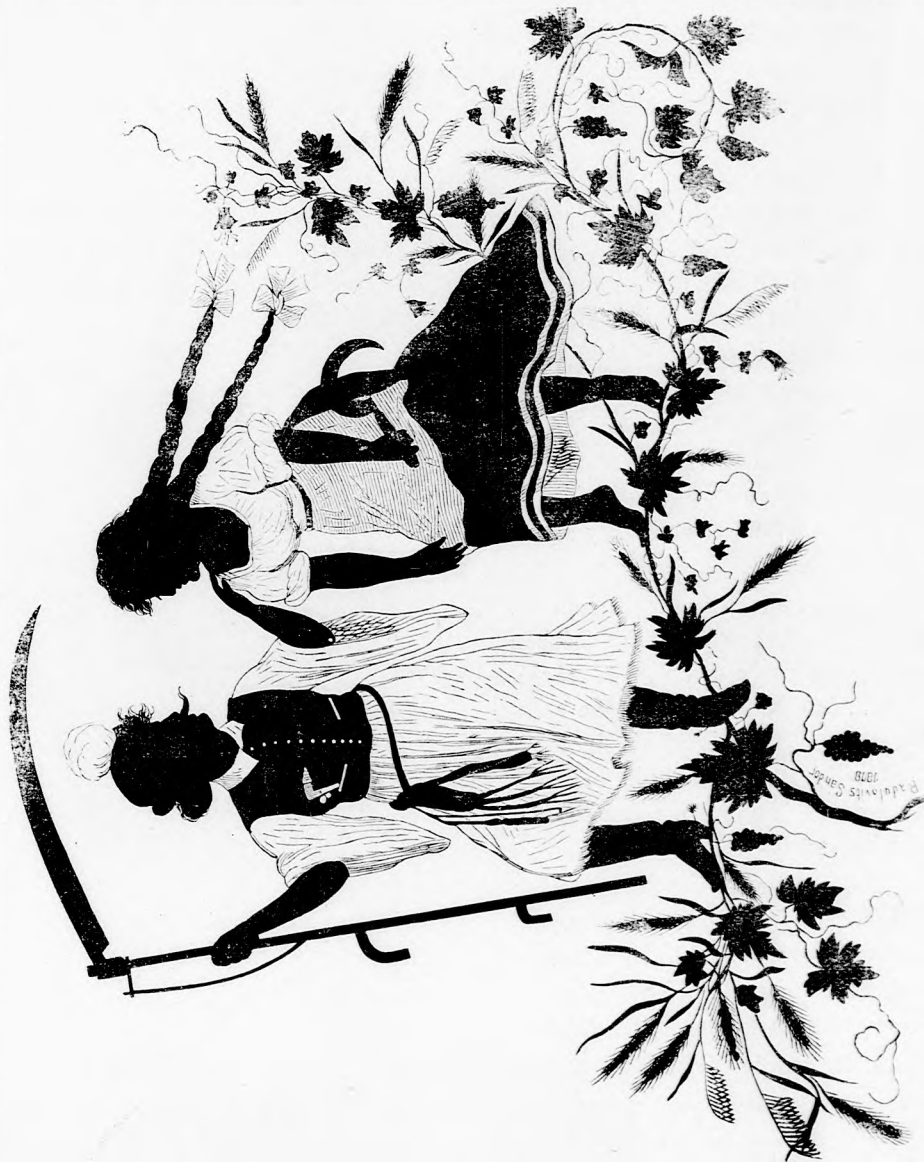
ARATÁS UTÁN. (Lásd a 30. lapon.)

kodnak e miatt jó öreg szüleim. Ha elő nem jöttél volna most, holnap reggel