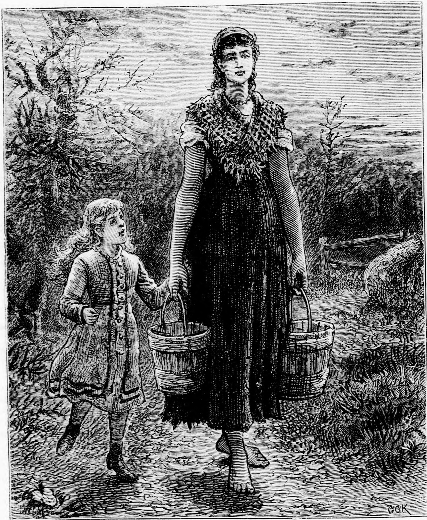
FEJÉS UTÁN. (Lásd a 126. lapon.)