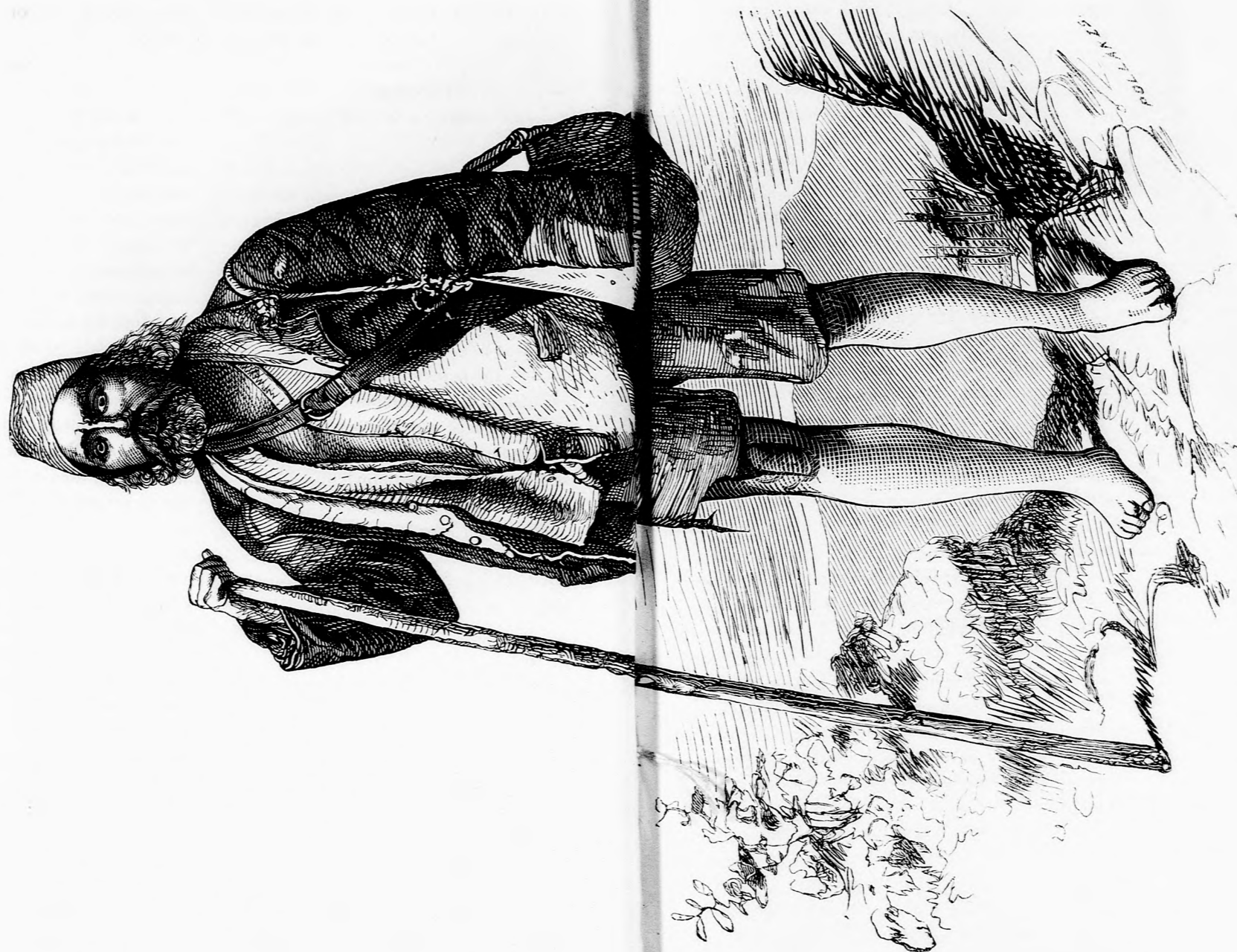
A HADSI. (Lásd a 126. lapon.)