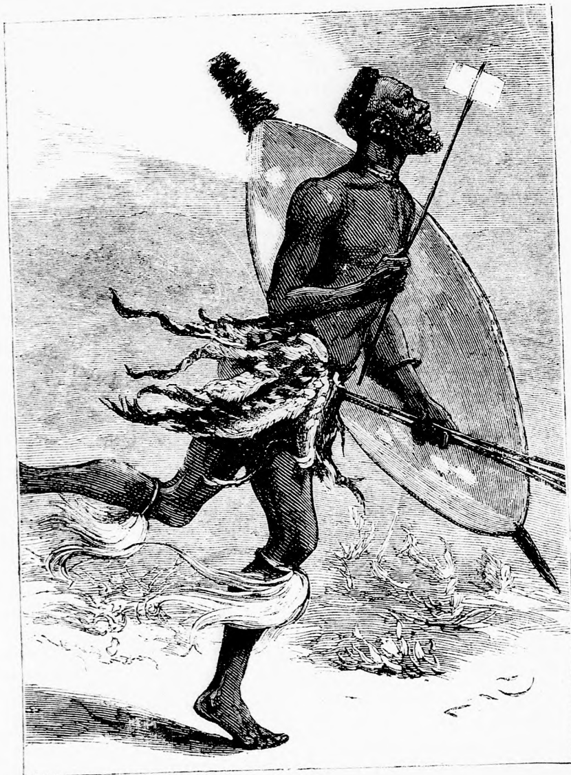
A ZULUK ORSZÁGÁBÓL. A postás. (Lásd a 267. lapon)