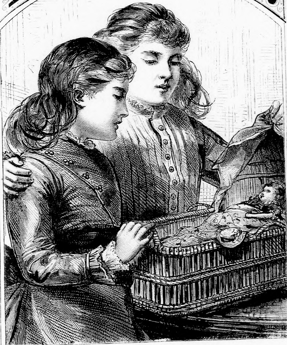
BETEG BÁBU. (Lásd a 262. lapon.)

17. szám. — 1879. Ara negyedévre 1 frt 10 kr.