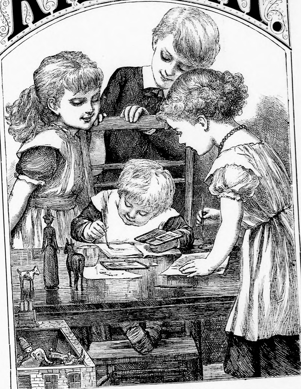
MIMI PINGÁL. (Lásd a 304. lapon.)

19. szám. — 1879. Ára negyedévre 1 frt 40 kr.