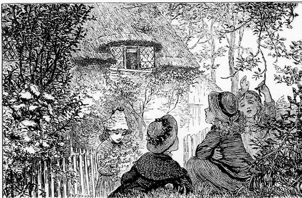
. . . A KERTBEN ÜLDÖGÉLTEK. (Lásd a 291. lapon.)

vigan beszélgetve és azt tervezgetve, minek nevezzék el majd a kis madarat, ha meglesz. Malvina kisasszony kevésbé volt jókedvű, mint a gyermekek. Őt komolyan aggasztotta a szegény Klárika állapota; látta, hogy a kis leány valóban súlyosan beteg, s elhatározta, hogy megkéri az igaz-