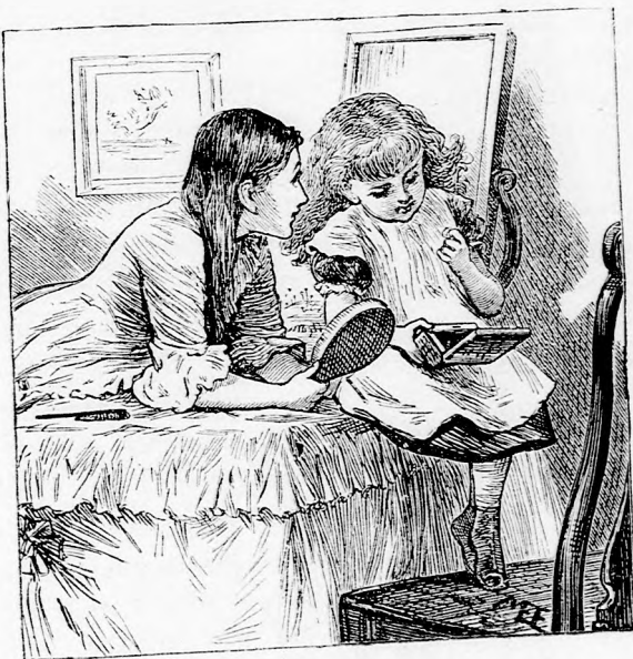
... GYÖNYÖRKÖDVE NÉZEGETTE.

semmit csinálni, míg a madárka meg nem érkezik. A délutáni lezke után kísértáltak a kertbe s játszottak. Flóra egy nagy fa árnyékában olvasgatott s nem vette észre, hogy Lujza félre hívta a kis Emmikét és nagyon élénken beszélget vele. Ha látta volna, bizonyosan föl-