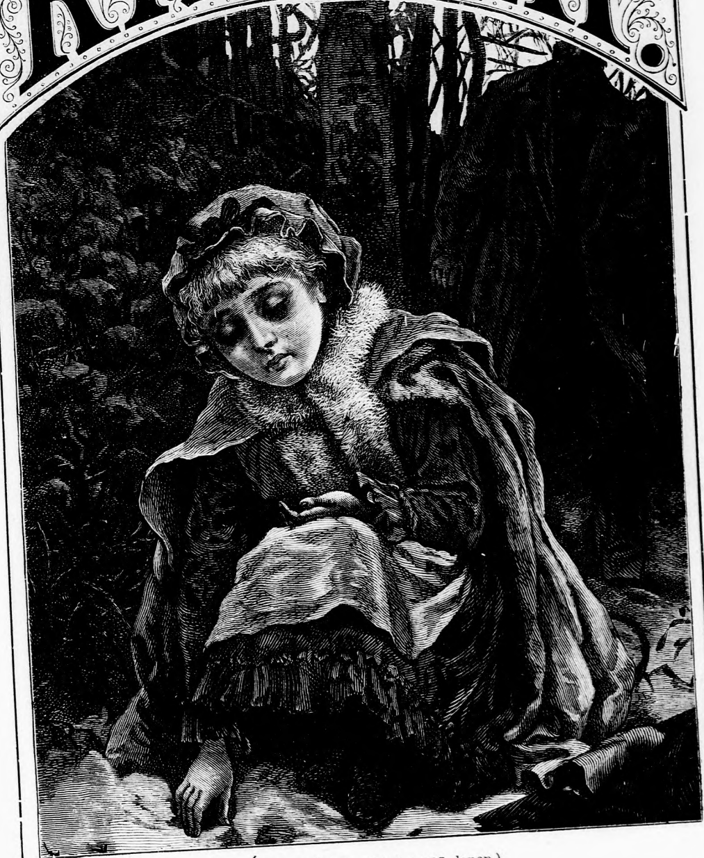
ÁRVA MÓKUS. (Lásd a 387. lapon.)

25. szám. — 1879. Ara negyedévre 1 frt 40 kr. XVII. kötet.