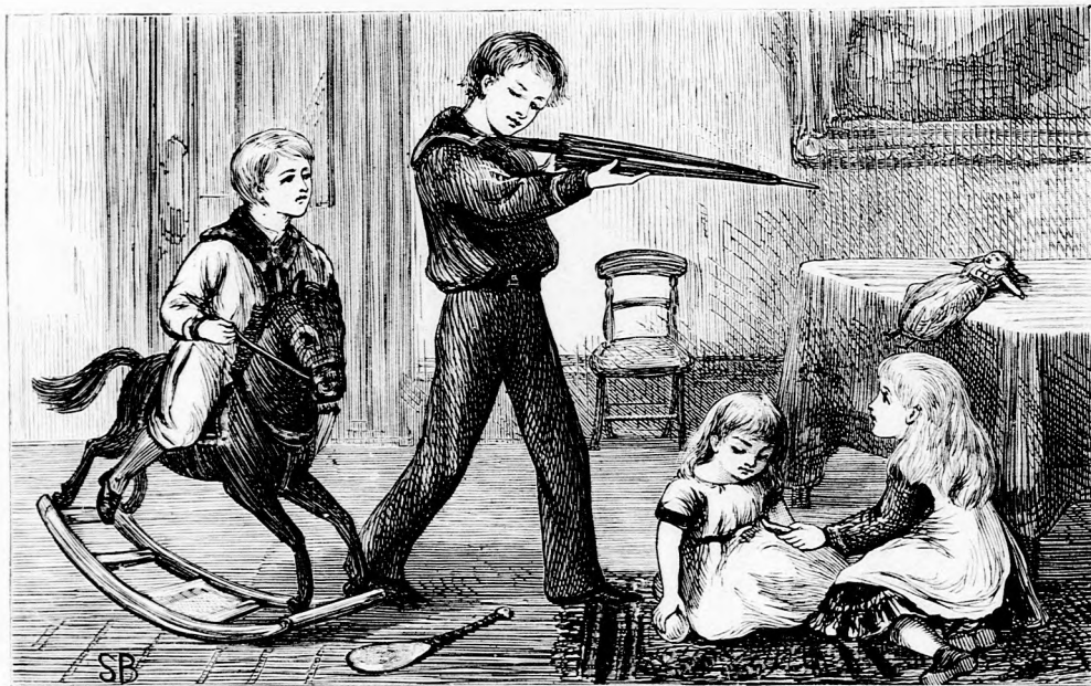
BÉLA VITÉZÜL AGYONLÖTTE. (Lásd a 391. lapon.)

Ezt mindnyájan roppant okos gondolatnak találták s iziben nyitva volt valamennyi ablak. Jéghideg szél csapott be, de ezzel nem gondoltak, hanem gyorsan kaparták össze a havat s hordták össze egy nagy csomóba a szőnyegre. Mikor