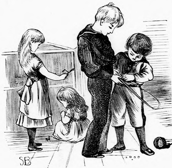
... EGY KIS OSTORT BÁMULGATTAK . . . (Lásd a 391. lapon.)

— Igen de ha véletlen erre jön valaki, szemébe tűnik a kalap, aztán mindjárt kutatni fogják, hogy jutott ide!