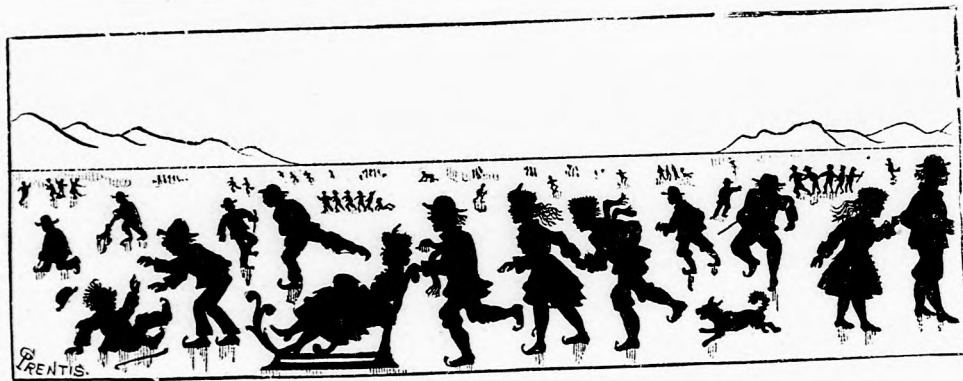
A JÉG HÁTÁN. (Lásd a 390. lapon.)

Egyszer, amint egy erdőcske szélén megpihenni készültek, az egyik tündérke fölkiáltott: