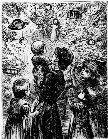
UJJONGVA FOGTÁK KÖRÜL A KARÁCSONYFÁT.

— Hamar, Mariska... terítsd meg ezt a kisebbik asztalt, ezen állítjuk föl a karácsonyfát s alája rakjuk az ajándékokat. A nagy asztalon pedig teríts va-