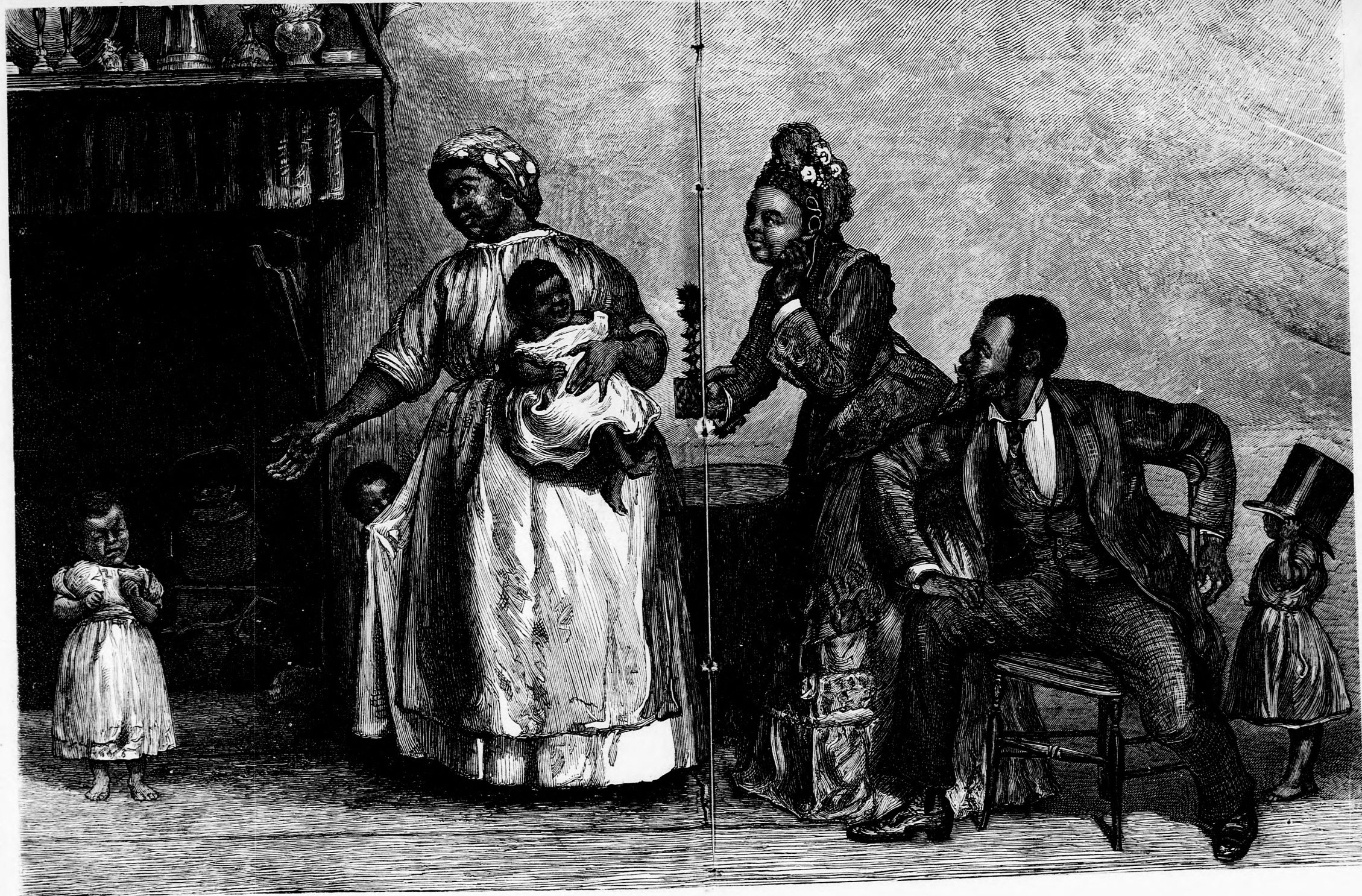
NÉGEREK KARÁCSONYA. (Lásd a 414. lapon.)