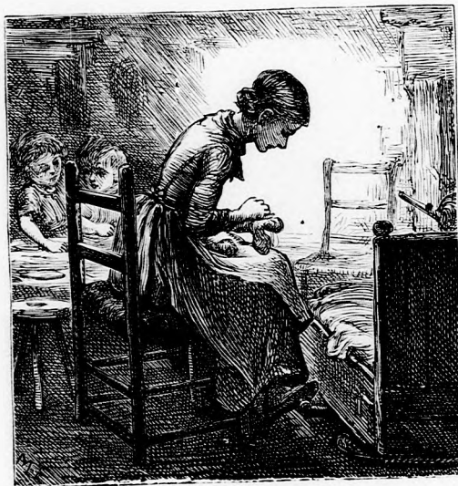
MARISKA . . . VARROGATOTT. (Lásd a 403. lapon.)

— No lám, pedig sokan vannak ám, akik éheznek. Hiszen nem mondom, hogy valami nagyon kopik a fogunk zsiros pecsenyékben . . . bizony nem is emlékszem, mikor volt sült az asztalunkon; de hát a nélkül is meglehet élni. És ami kevés fölösleges pénzünk