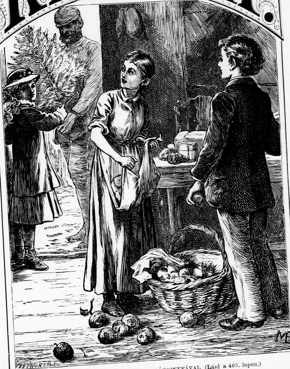
.. BELEPETT GIZIKE .. SZÉP KARÁCSONYFÁVAL (Lásd a 405. lapon.)

26. szám. — 1879. Ara negyedévre 1 frt 40 kr.