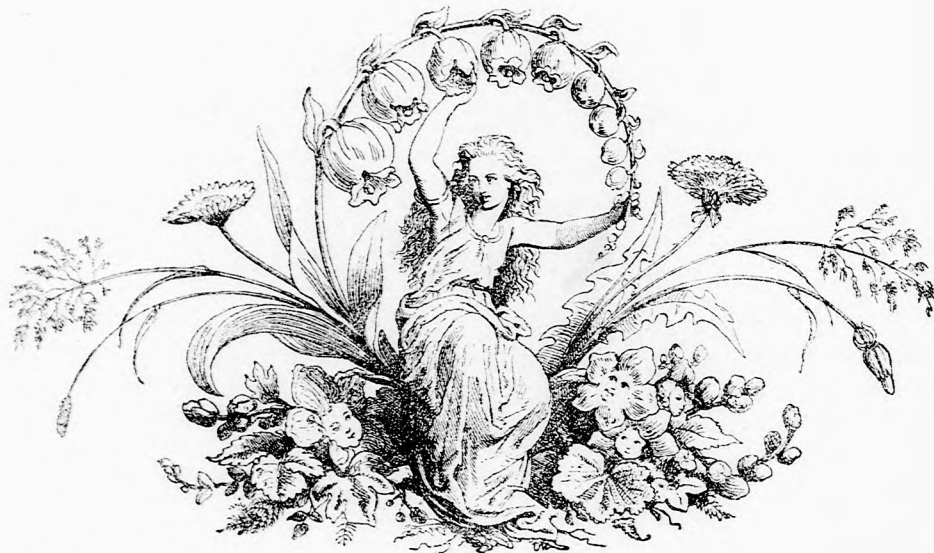
... FEJE FÖLÉ HAJLITÁ A VIRÁGOT. (Lásd a 205. lapon.)

— Nagyon jó lesz! felelt Mariska kegyesen.