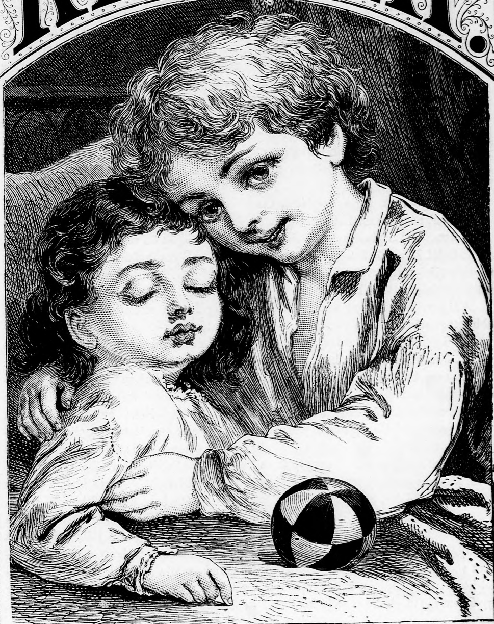
»ÉBREDJ ANTI!« (Lásd a 197. lapon.)