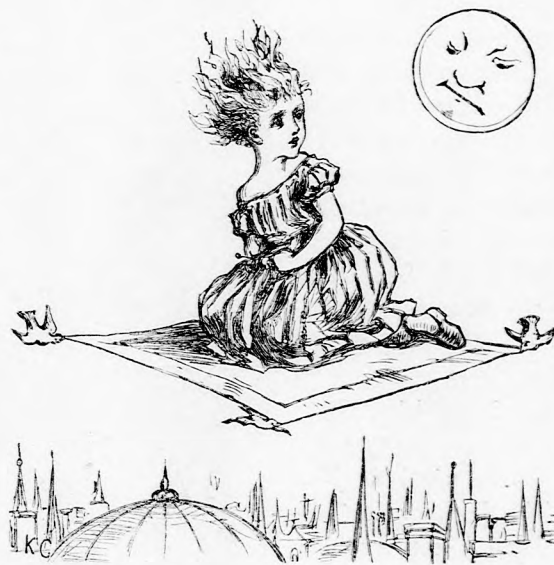
... EGY NAGY VÁROS HÁZAI FÖLÖTT.

Sokáig semmi sem jutott eszébe s már boszankodni kezdett saját magára, midőn hirtelen eszébe jutott valami. Egy aranytollu madárkát látott a fák közt