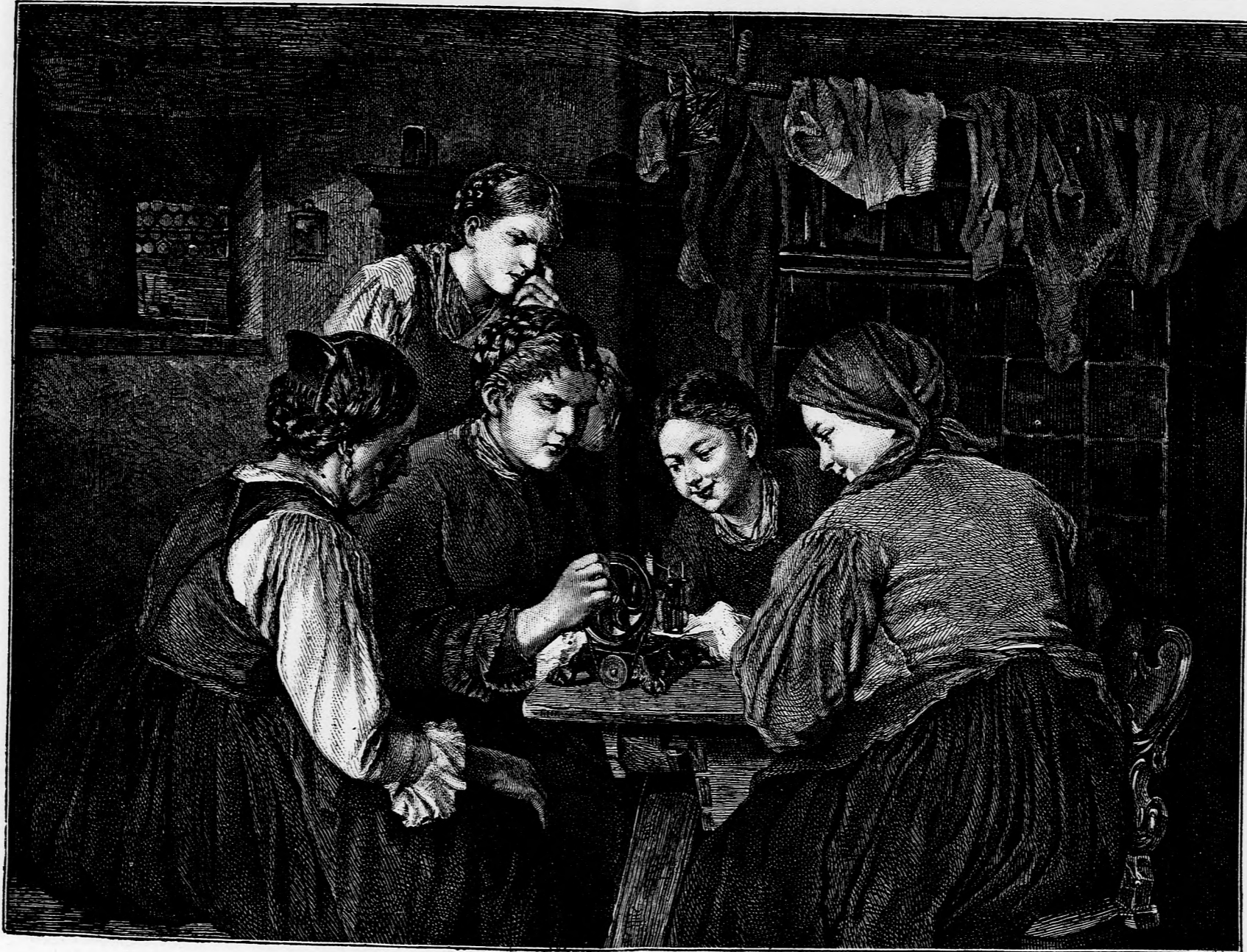
A VARRÓGÉP. (Lásd a 223. lapon.)