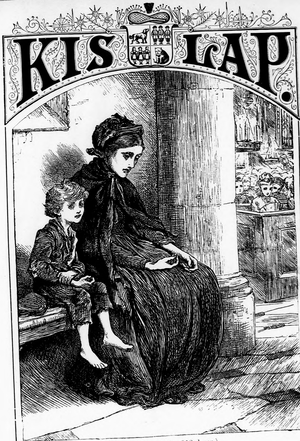
TEPLOMBAN. (Lásd a 212. lapon.)