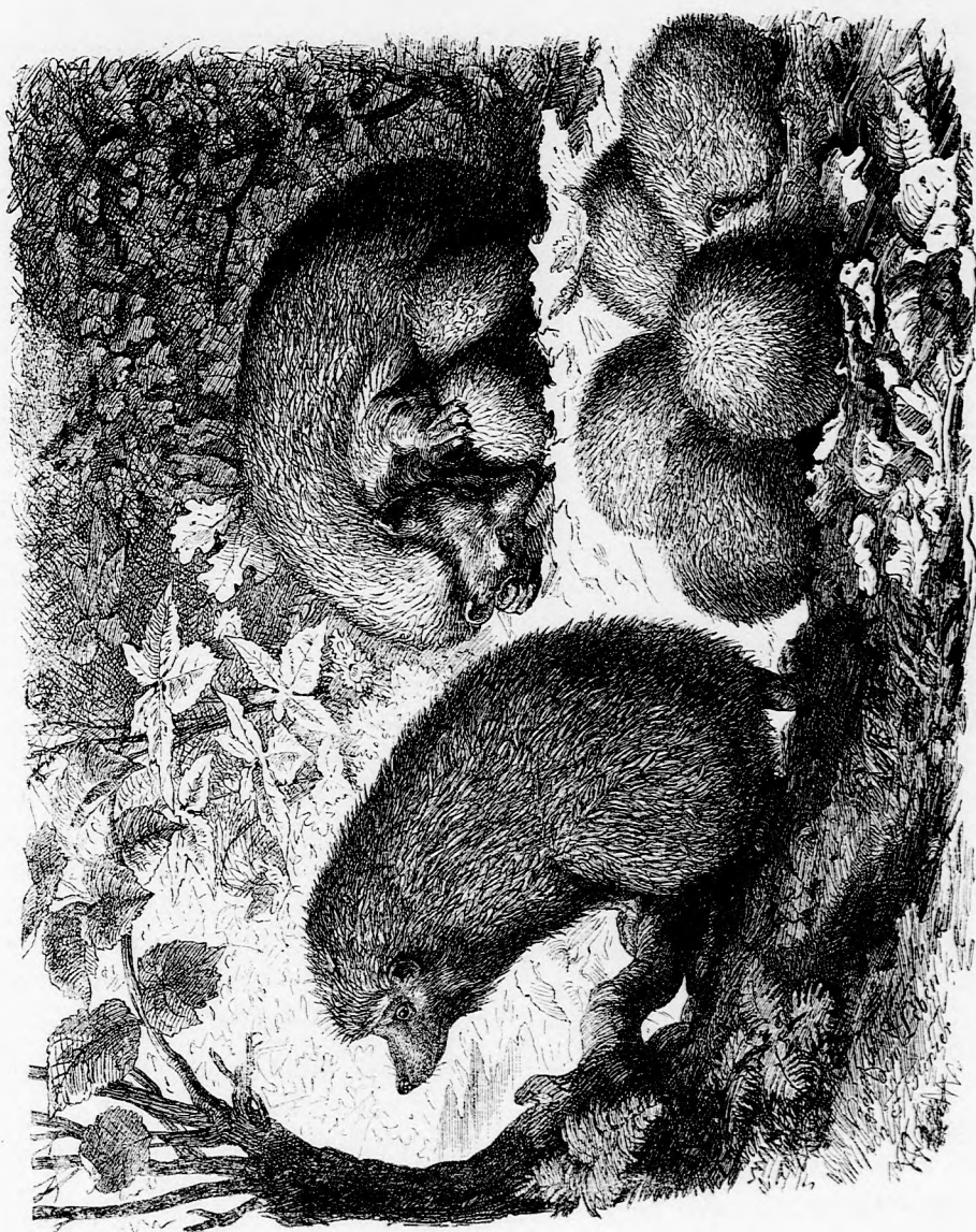
A SÜNCSALÁD. (Lásd a 212. lapon.)

nap igen lma, nem igen ott a tt is mar- lani, omb neg, ztán s kis mle- neg- szen