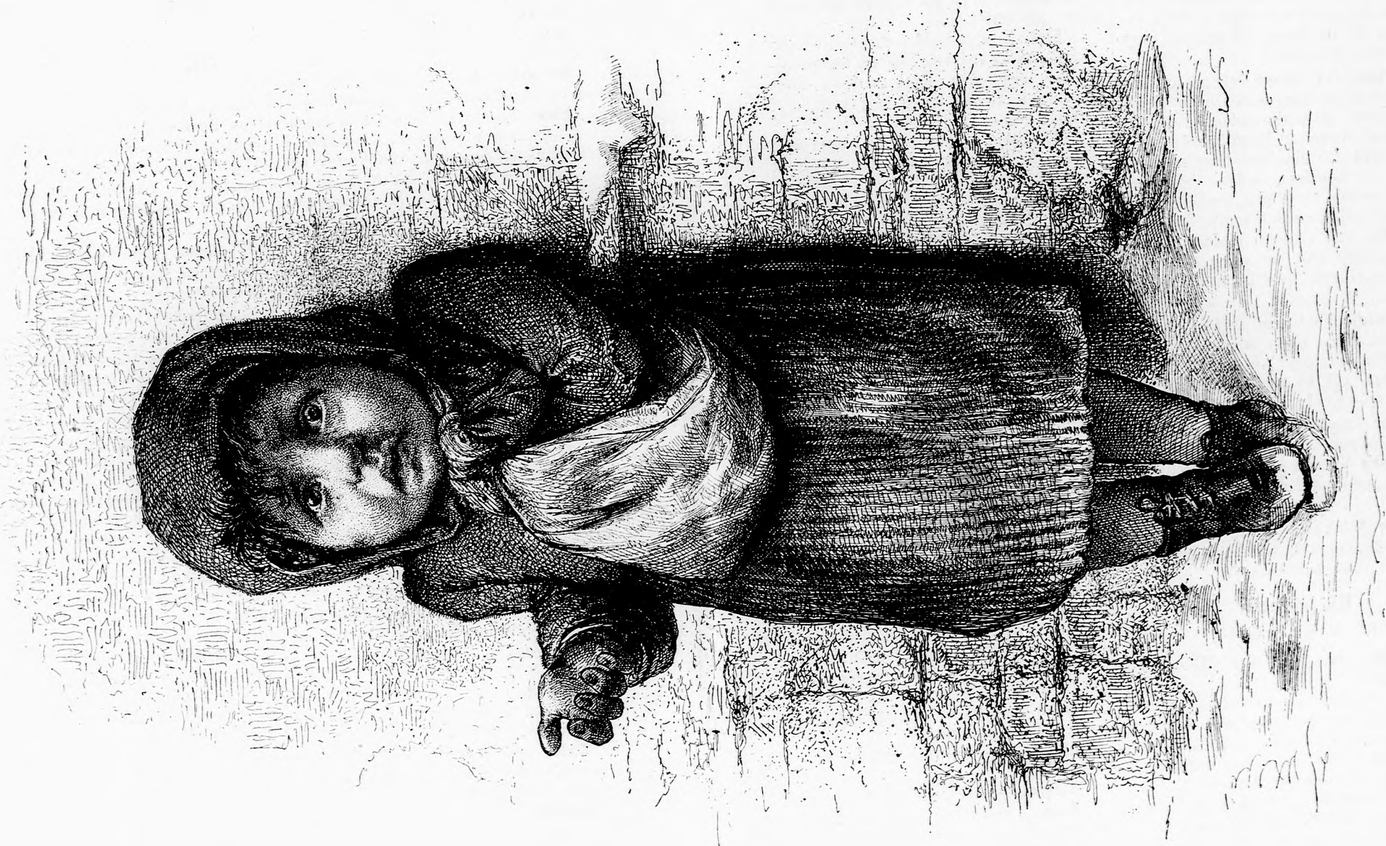
Egy KRAJČÁRKÁT! (Lásd a 351. lapon.)