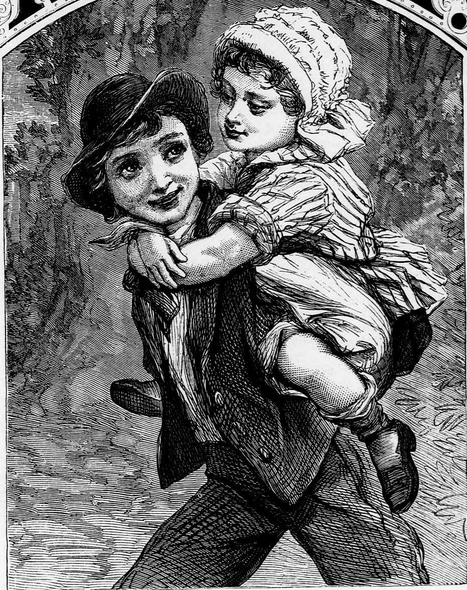
AZ ERDŐN ÁT. (Lásd a 351. lapon.)