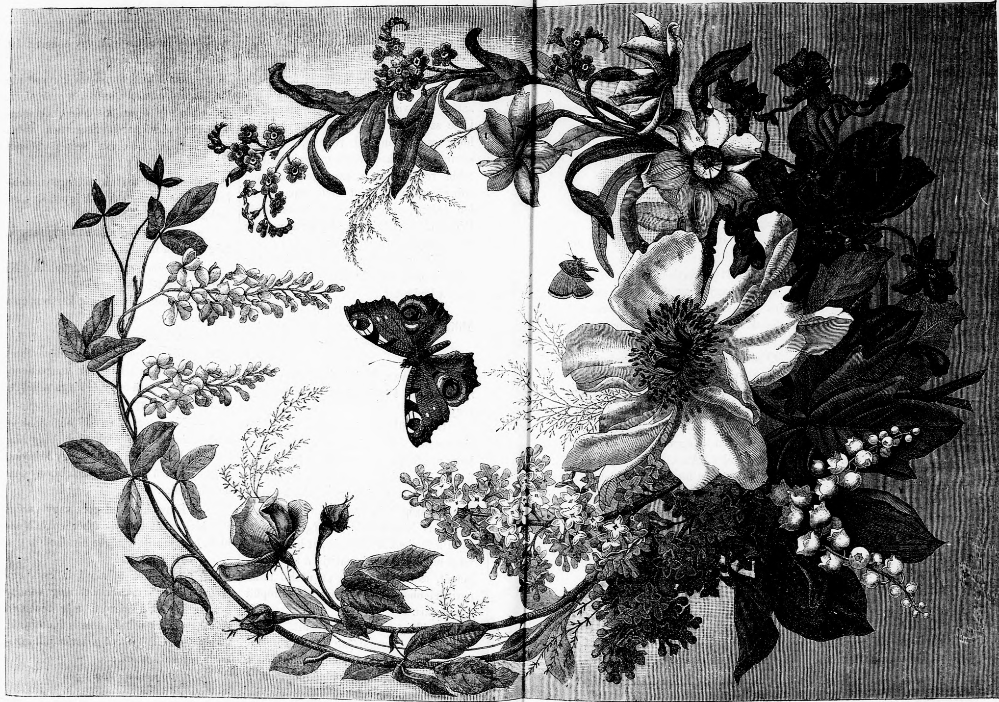
... A VIRÁGOK HIVOGATÓLAG INTETEK FELEJE. (Lásd a 390. lapon.)