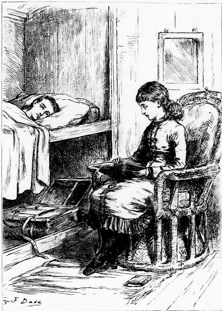
... MELLETTE OLVASOTT. (Lásd a 395. lapon.)