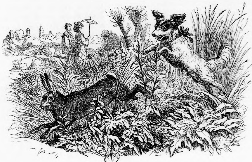
HASZTALAH ERÖLKÖDÉS. (Lásd a 63. lapon.)

— Kedves fiam, szólt az igazgató, annak csak örvendhetek, ha hibádat megbántad és jóvá akarod tenni. De az még