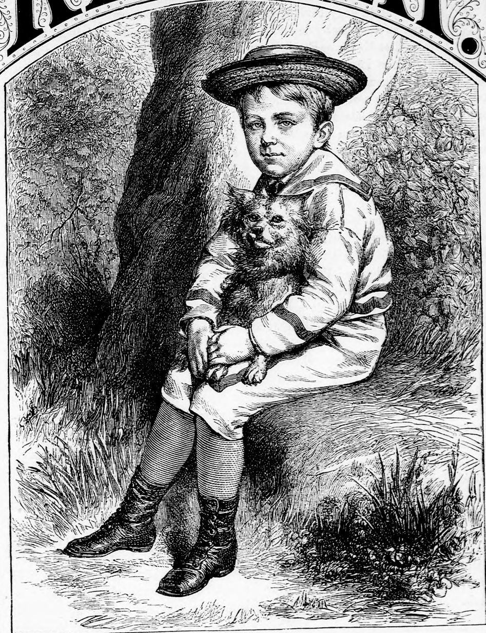
VÁRAKOZÁS. (Lásd a 63. lapon.)