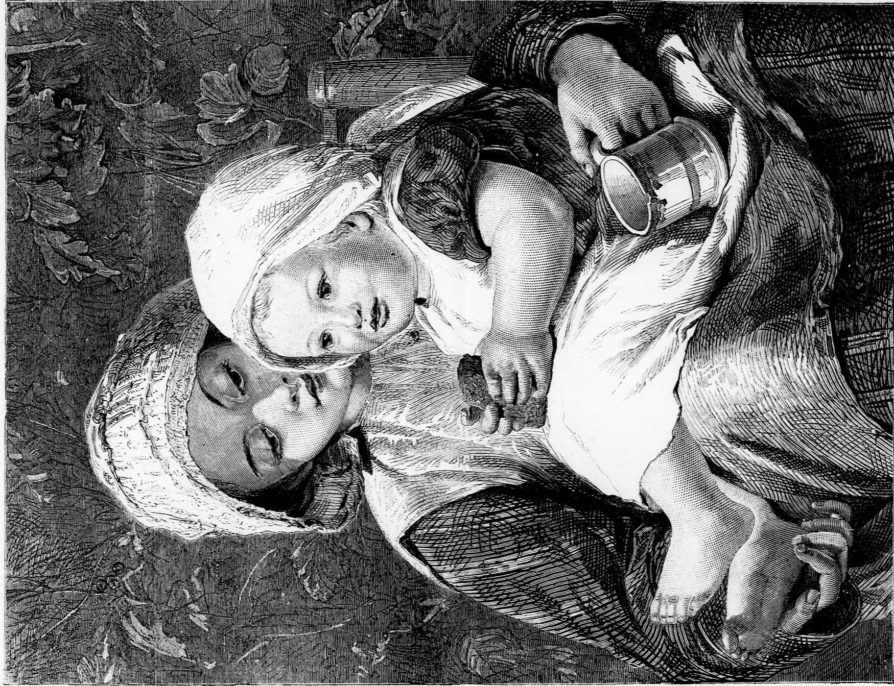
OZSONNA. (Lásd a 148. laon.)