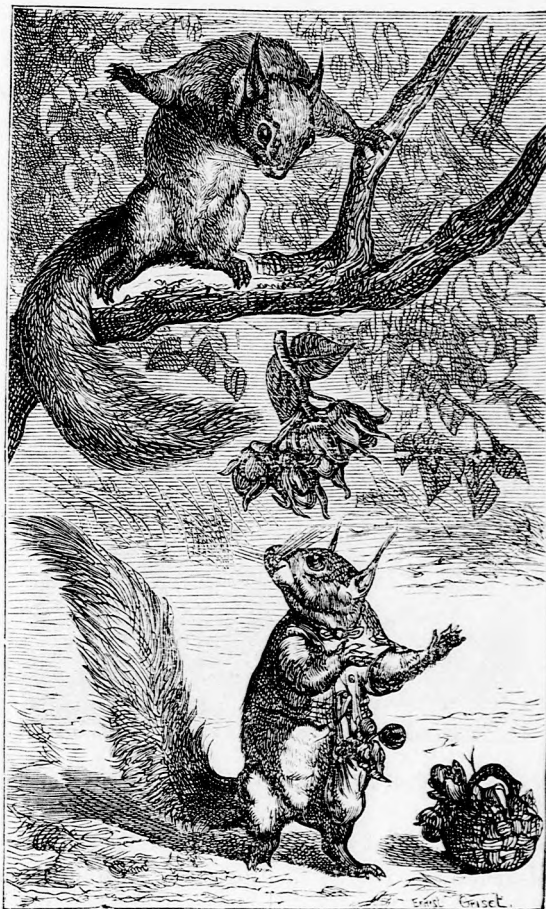
... TEKINTS FÖL! (Lásd a 151. lapon.)

— Nézd, most már közel vagyunk a parthoz, most már nem fogsz félni, ha egyedül maradsz? Én szeretnék mielőbb ott lenni, majd a vízbe ugrom és kiuszom a partra.