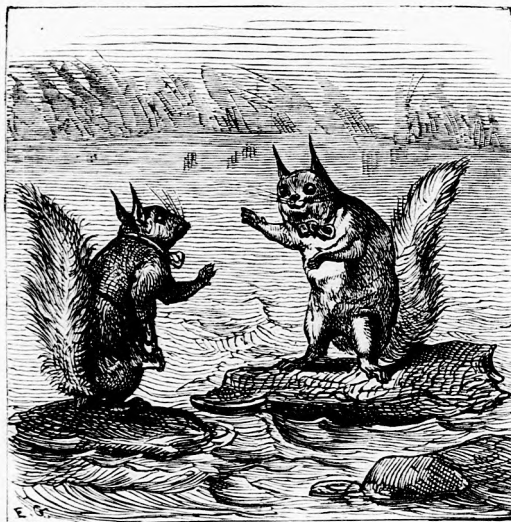
... ELFÉRÜNK MINDAKETTEN. (Lásd a 154. lapon.)

Virgoncz lesütötte a fejét és nem tudott hamarjában mit felelni. Megigérte hugocskájának, hogy el nem árulja; most hát mit mondjon? Szerencséjére mókus apó, be sem várva a feleletet, ismét ezt kérde: