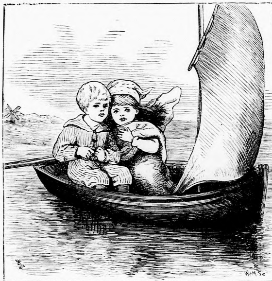
CSOLNAKBAN. (Lásd a 206. lapon.)

— A kis Dinikét otthon hagytuk, szolt a néni. Az ilyen kicsi fiucska sokszor garabonczáskodik, nem való olyan helyre, ahol sokan vannak. Különben nem lesz semmi baja, ott van a házban Gergely vitéz, majd vigyáz reá.