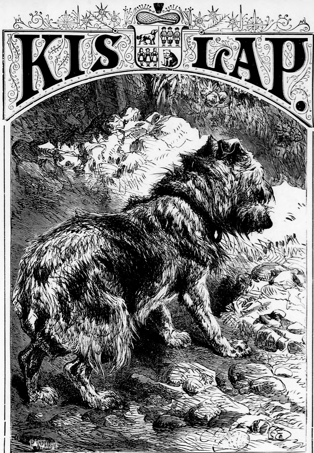
NAGYAPA KUTYÁJA. (Lásd a 206. lapon.)