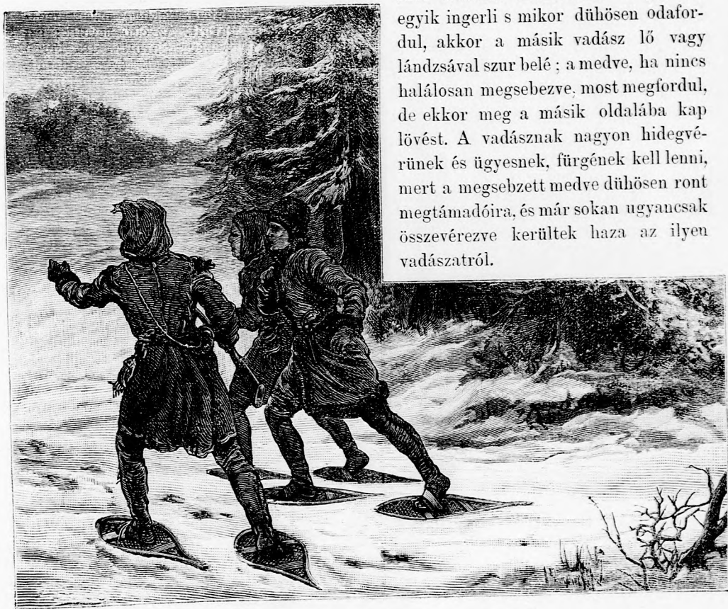
AZ ÉSZAKI SARKVIDÉKEN. Medve-vadászok. (Lásd a 382. lapon.)

Két oldalról közelítenek feléje; az egyik ingerli s mikor dühösen odafordul, akkor a másik vadász lő vagy lándzsával szur belé; a medve, ha nincs halálosan megsebezve, most megfordul, de ekkor meg a másik oldalába kap lövést. A vadásznak nagyon hidegvérűnek és ügyesnek, fürgének kell lenni, mert a megsebzett medve dühösen ront megtámadóra, és már sokan ugyancsak összevyezve kerültek haza az ilyen vadászatról.