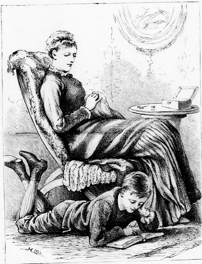
A MAMA TÜNÖDÉSE. (Lásd a 384. lapon.)

— Oh uram, szólt Károly majdnem könnyezve, hiszen én egyebet sem kívánok,