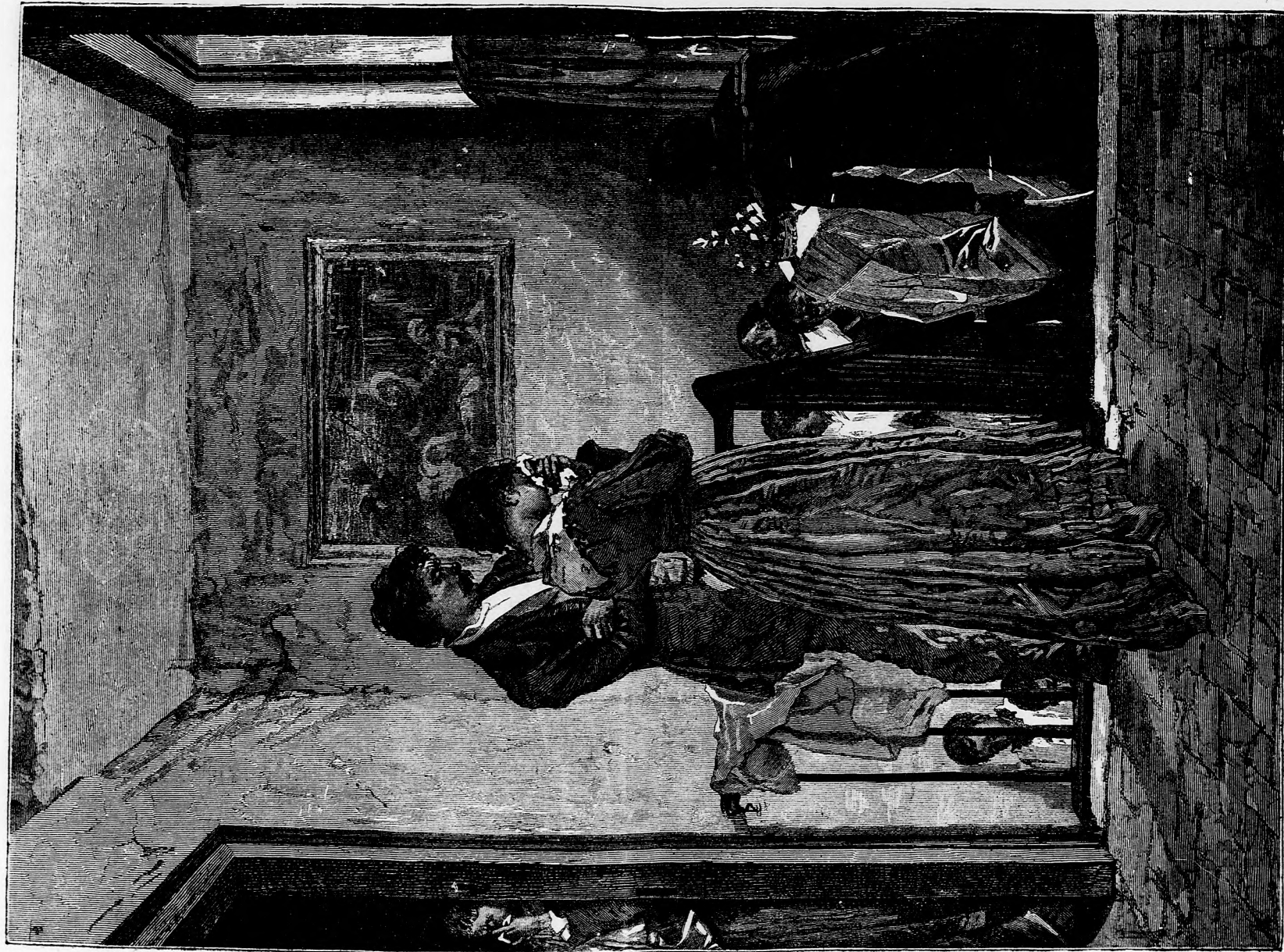
Az utolsó búcsú. (Lásd a 381. lapon.)