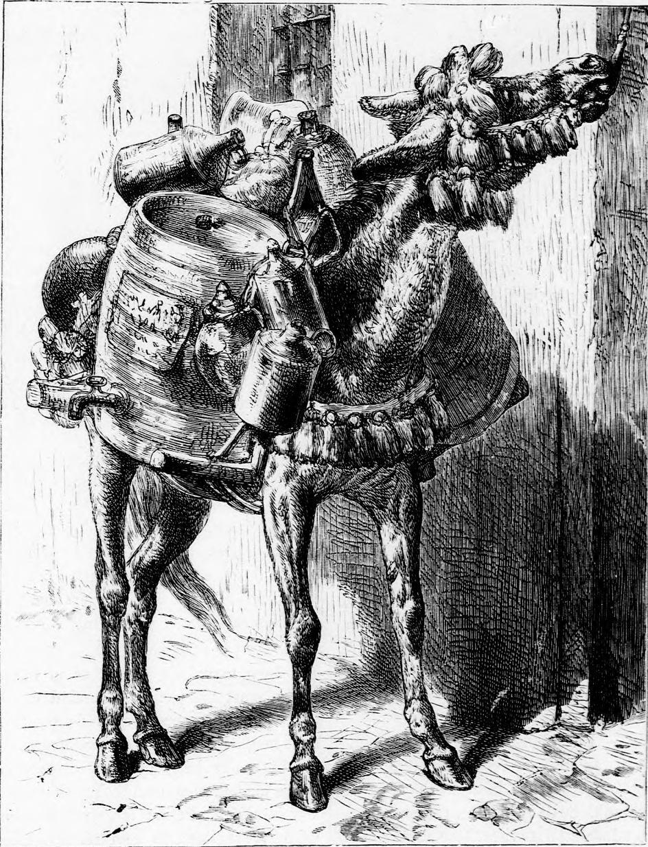
Az ügyes CSACSI. (Lásd a 395. lapon.)