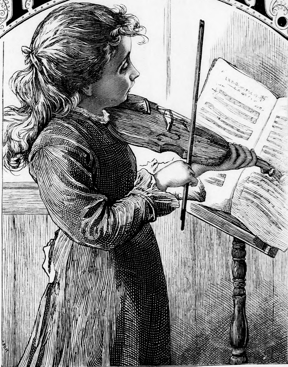
A KIS MŰVÉSZNŐ. (Lásd a 386. lapon.)