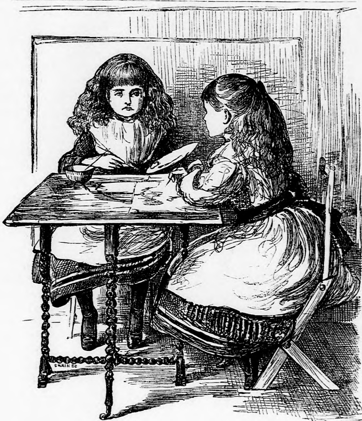
MEGOSZTOTT MUNKA. (Lásd a 110. lapon.)

tóban várta őket. (Lásd a képet a 104—105. lapokon.) Ő is épen most érkezett haza s aggódni kezdett a gyermekek eltűnésén; mikor pedig meglátta őket, meglepetve kiáltá: