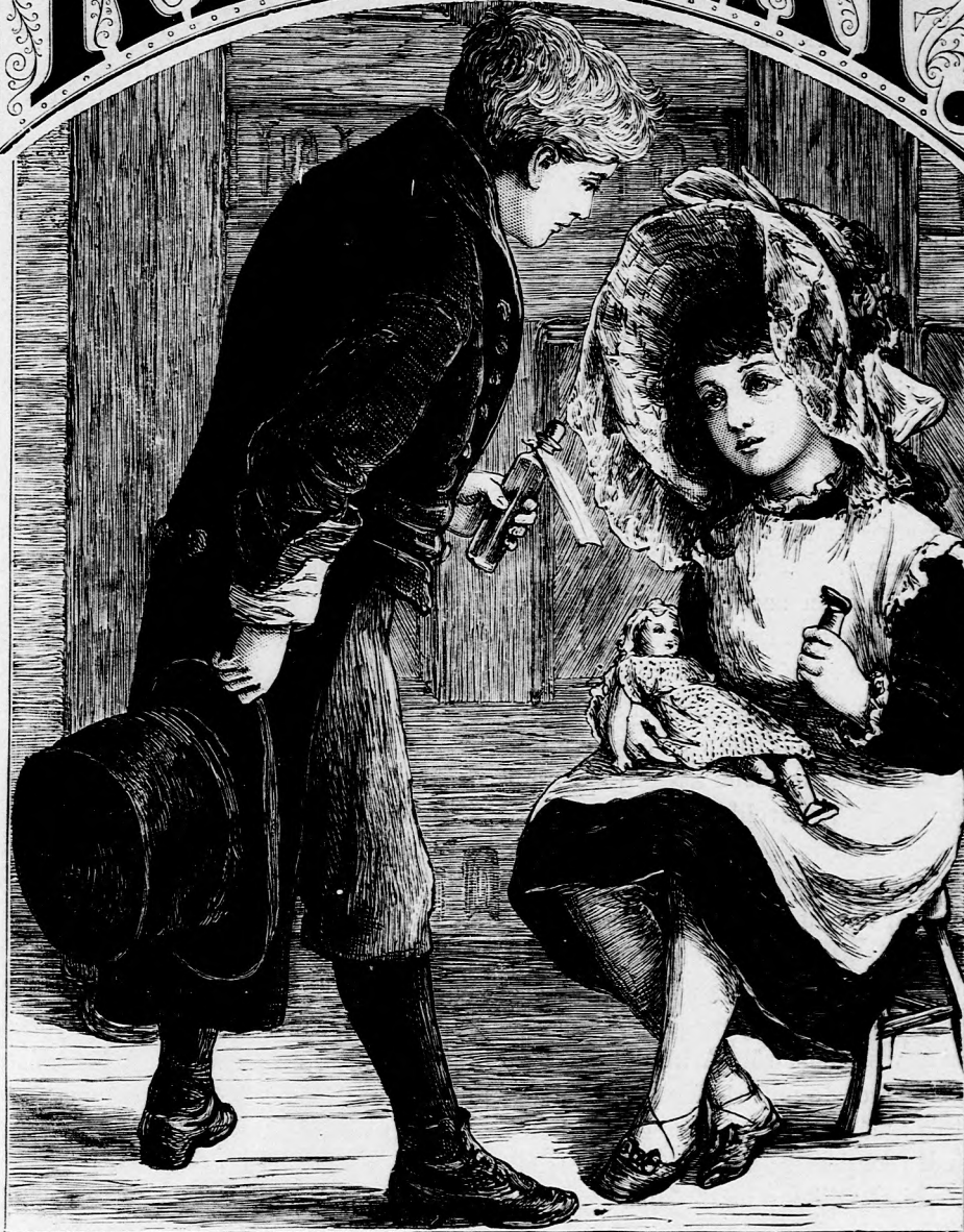
NAGY BETEG. (Lásd a 103. lapon.)