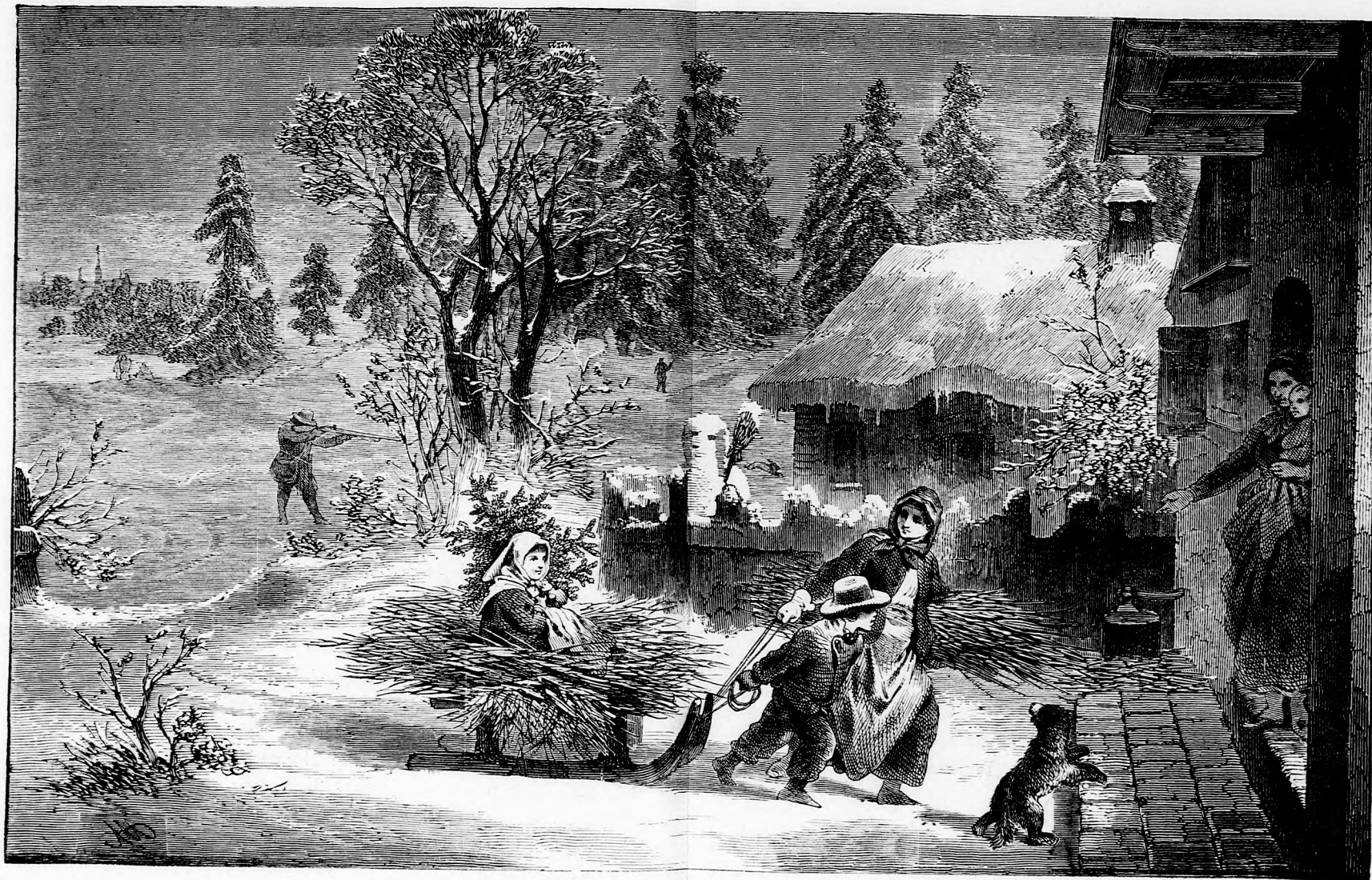
... ANYJUK AZ AJTÓBAN VÁRTA. (Lásd a 109. lapon.)