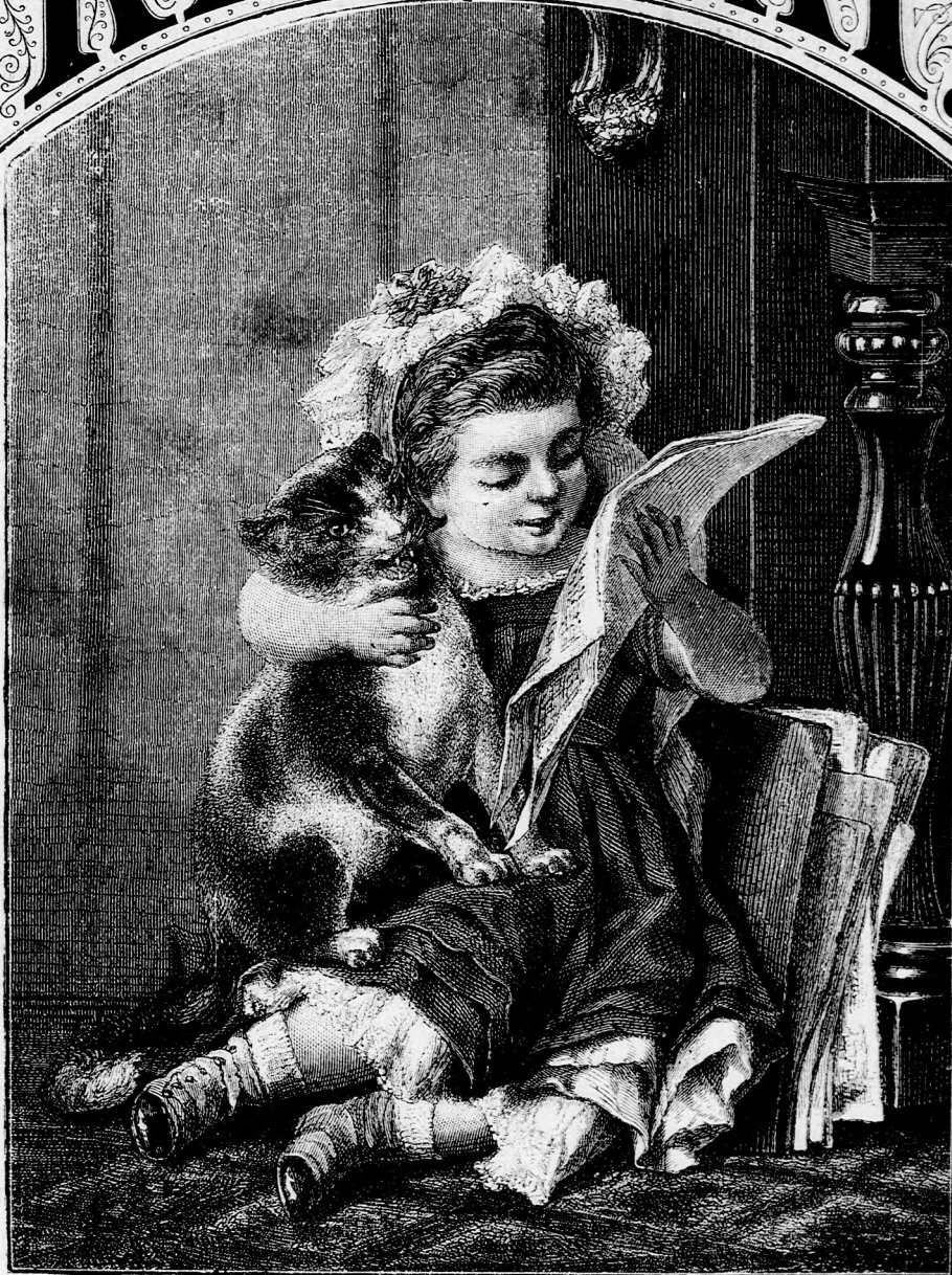
MACSKA-ÚJSÁG. (Lásd a 157. lapon.)