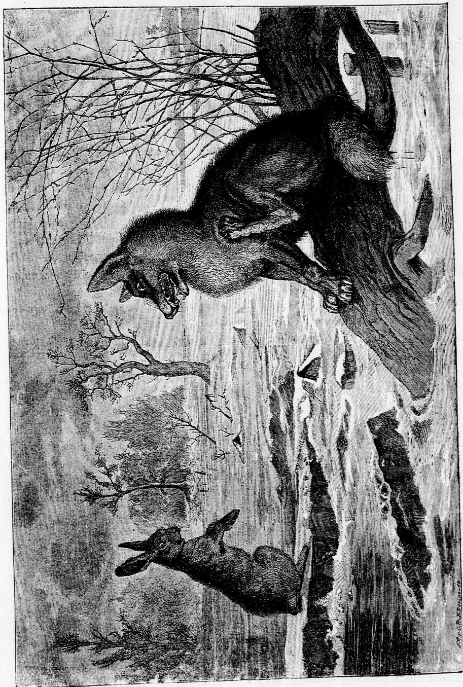
BAJOS ÁLLAPOT. (Lásd a 159. lapon.)