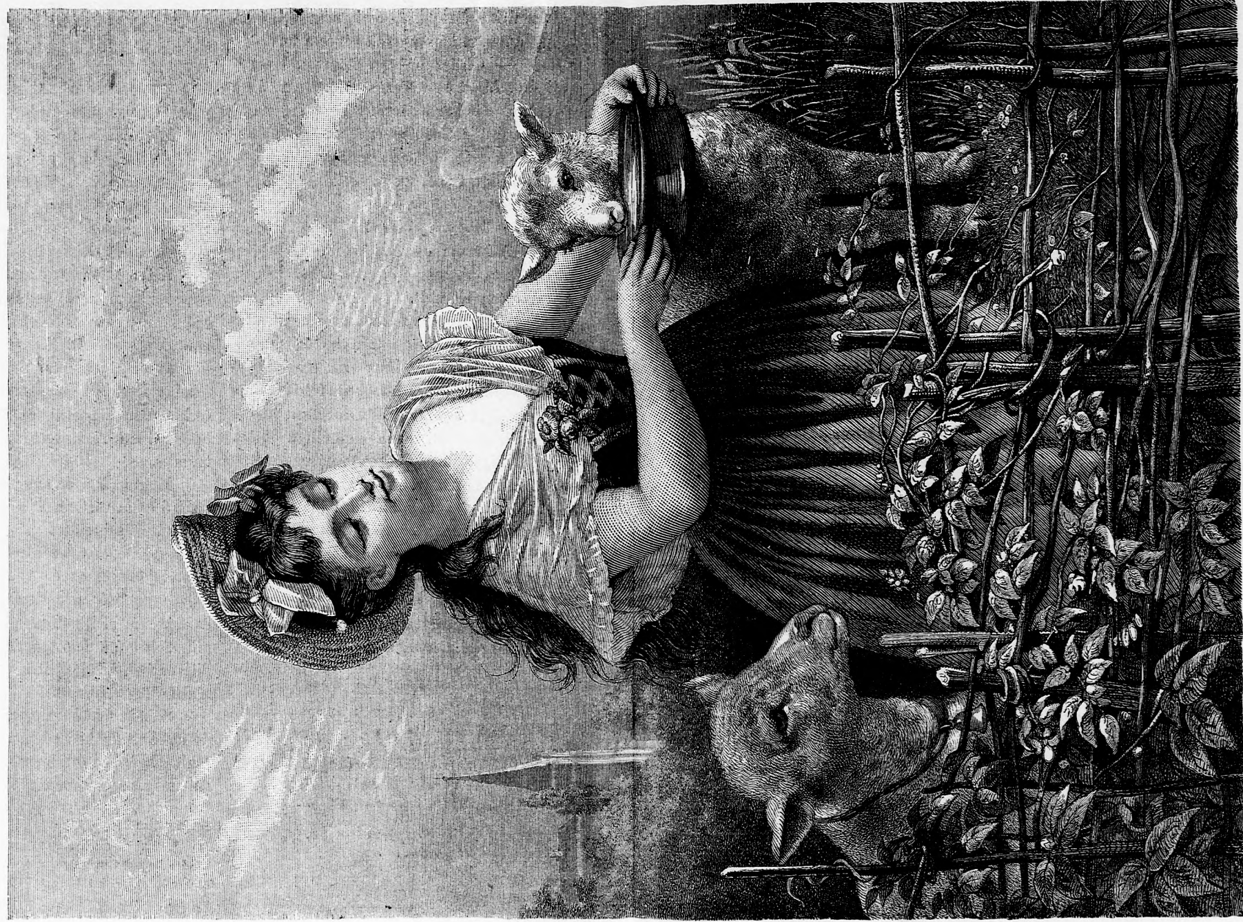
ITATÁS. (Lásd a 295. lapon.)