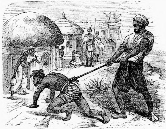
TOLVAJ-SZAGOLÓ. (Lásd a 292. lapon.)

— — Eddig volt a jó szivü házigazda elbeszélése. Unokabátyám meglepetve hallgatta s aztán így szólt: