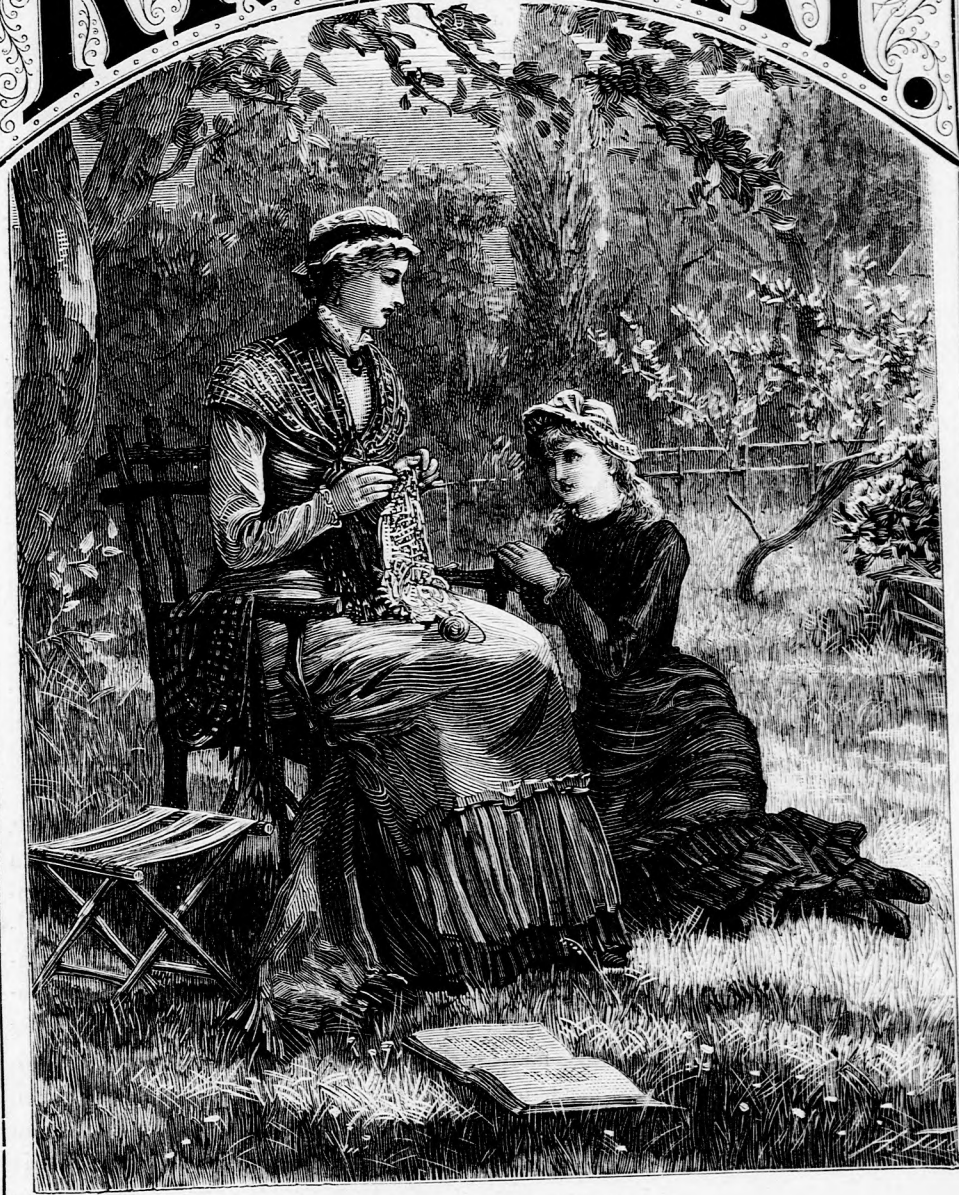
A KERTBEN. (Lásd a 302. lapon.)