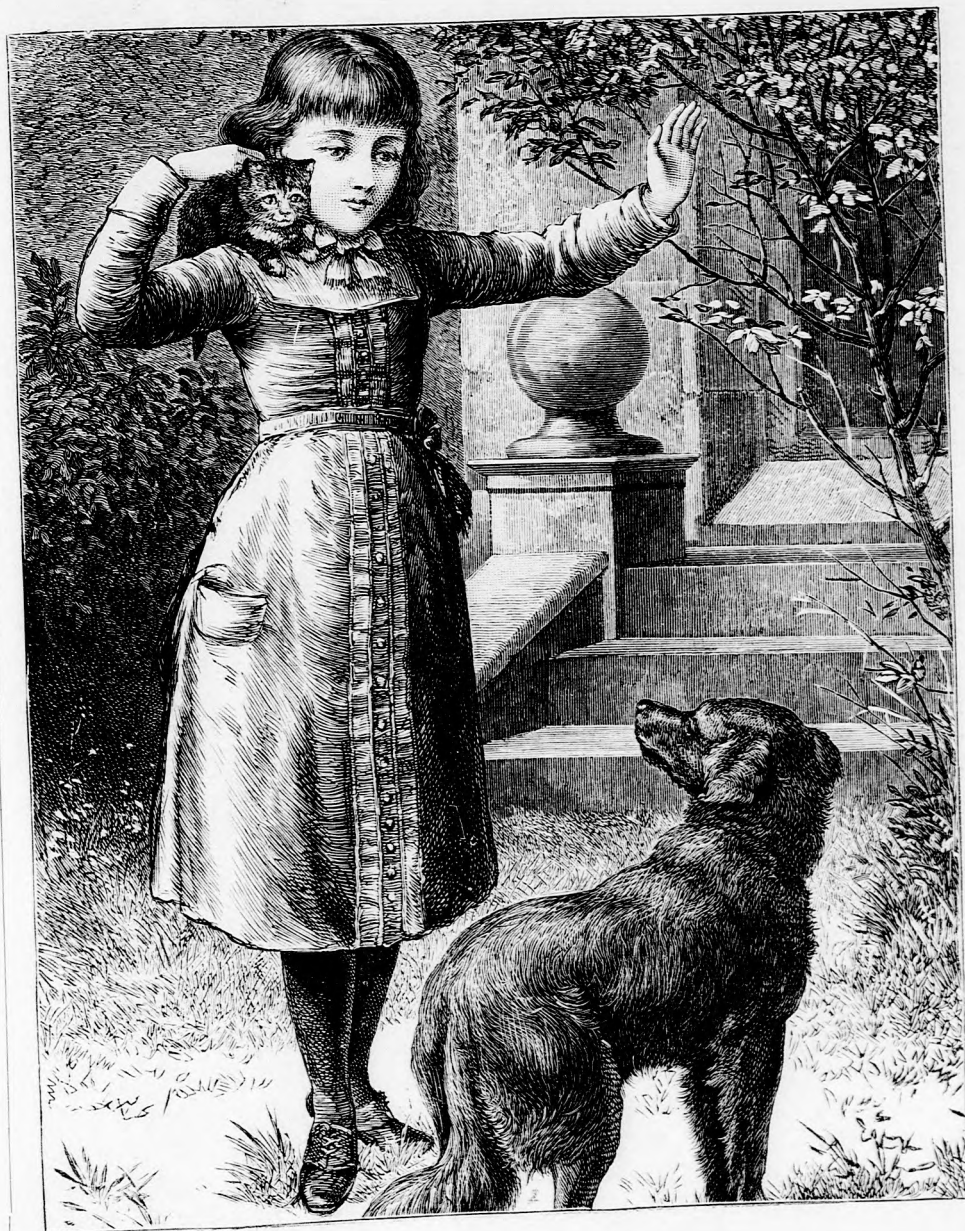
AZ ÚJ KEDVENCZ. (Lásd a 302. lapon.)

ost már fogja, arátom, gondol- kor azt m, hogy dálato- onlit va- a kit szeret- kor önt m, azt Persze, reg em- annyira m s ide yitsam, vagyok. zigazda vehall-