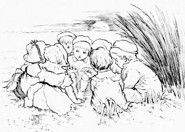
FONTOS ÉRTEKEZLET. (Lásd a 308. lapon.)

Akármerre járt a kis leány, a bocs mindig a sarkában volt. Együtt sétáltak a kertben, a mezőn s a medvének soha sem jutott eszébe a szökés, olyan hiven követte