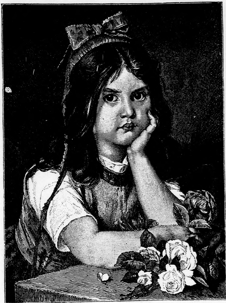
MADÁRHANGOK. (Lásd a 310. lapon.)

féle bohóságot beszélt a medvének, oktatta bölcs dolgokra, a jámbor állat pedig a talpát nyalva roppant komoly képpel hall-