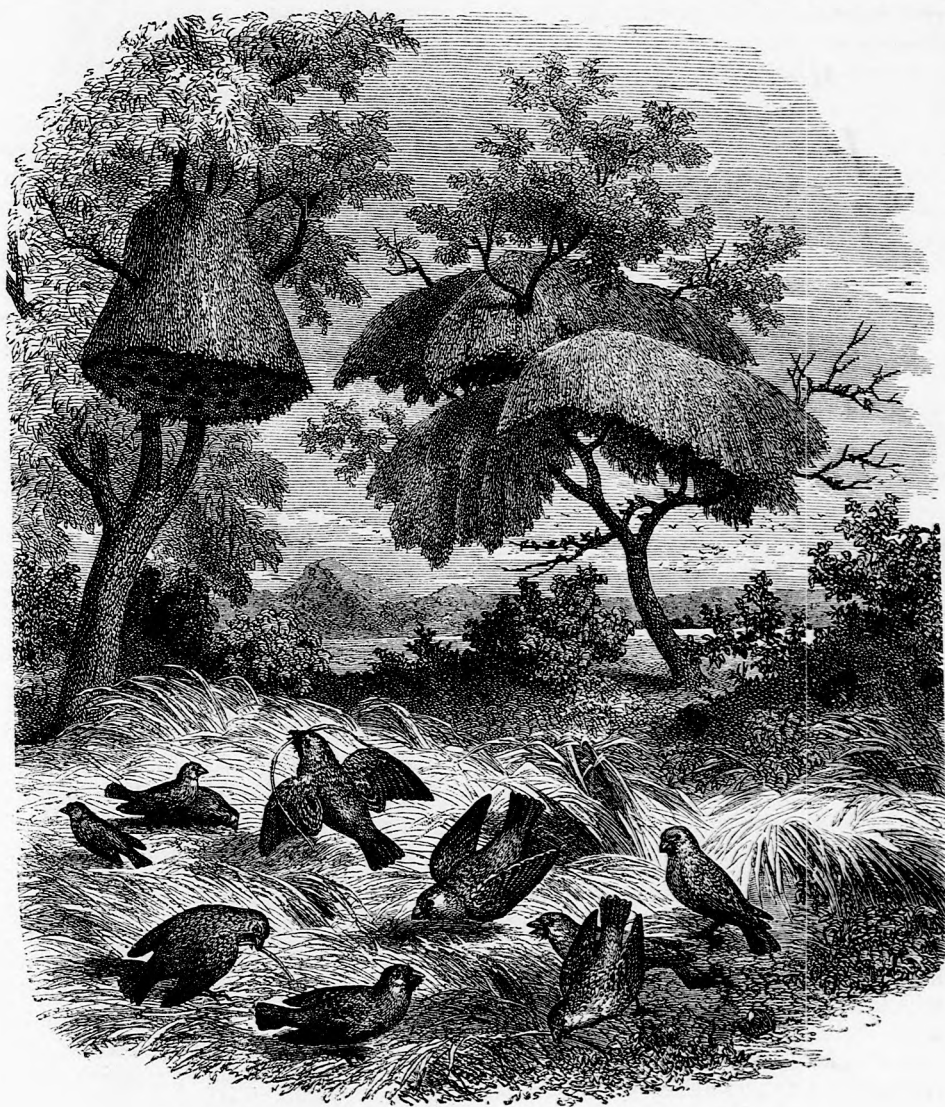
A SZÖVŐ MADÁR. (Lásd a 308. lapon.)

Mikor már nagyon sok uj meg uj fészket építettek egymásra, a felső ernyő,