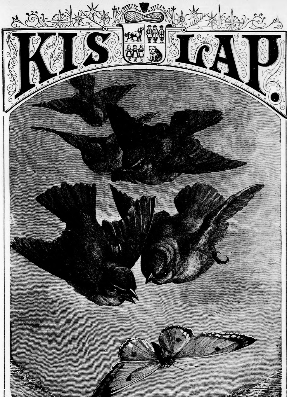
HALÁLOS VESZEDELEM. (Lásd a 332. lapon.)

ek elvég- nyai le- ogy egy alamen- de, mint sa. Leg- on fordul s valami y a her- ólitják a t e fölte- t nem ti kéritek gyik kis magatok joska s a an véve. ost ismé- pot« iro- irodalmi ulattatva ntolással rkesztek. valamit : gyelésnek Buzgó- leg ha, a ségesebb illanatot — Hein- részében et nekem a melyek ny Irén. ásod örö- ? Levele- ta bélyeg — Vécsey ldi csatá- somód el- án csak a e volt té- a 2 frtot n, a gyer- velkédben tt. Valjon x olvasója s levelkéd ülést ; jó isa mellet jtó nevét, l, mindig szíveseb- gy jó kis szenvedő ek már ré-