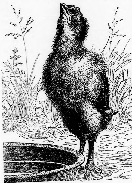
AZ ELSŐ KORTY. (Lásd a 335. lapon.)

Első izgatottságában Imrének egészen összezavarodtak gondolatai. Tehát ő az egykor hatalmas, gazdag gróf Tarnai Imre fia! Az, az; és mégis csak elhagyott szegény árva, a kinek senkije, semmije sincs a világon, ha csak nagybátyjától nem akar segítségért könyörögni. E gondolatra azonban eszébe jutott anyja taná-