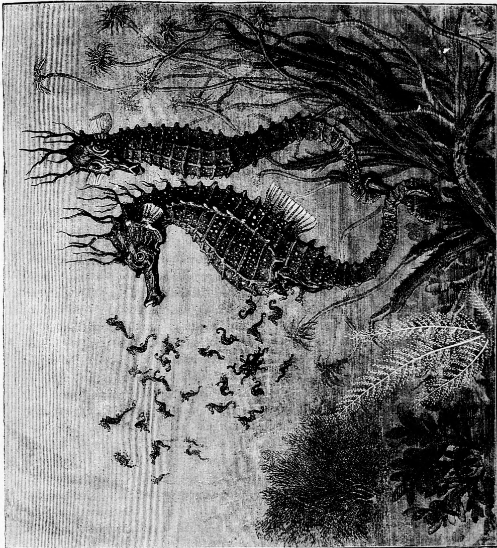
A CSIKÓCA. (Lásd a 331. lapon.)

— No's, kívánom, hogy óhajtásod teljesüljön, szólt a kis csiga. Csak aztán ne legyen okod megbánni.