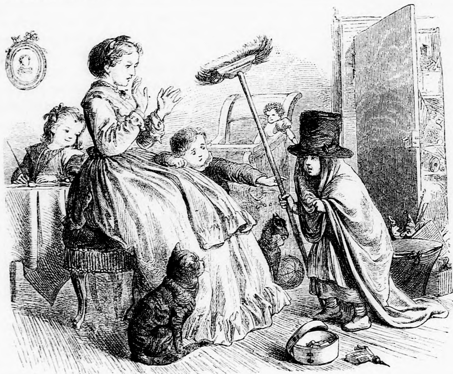
A MUMUS. (Lásd a 383. lapon.)