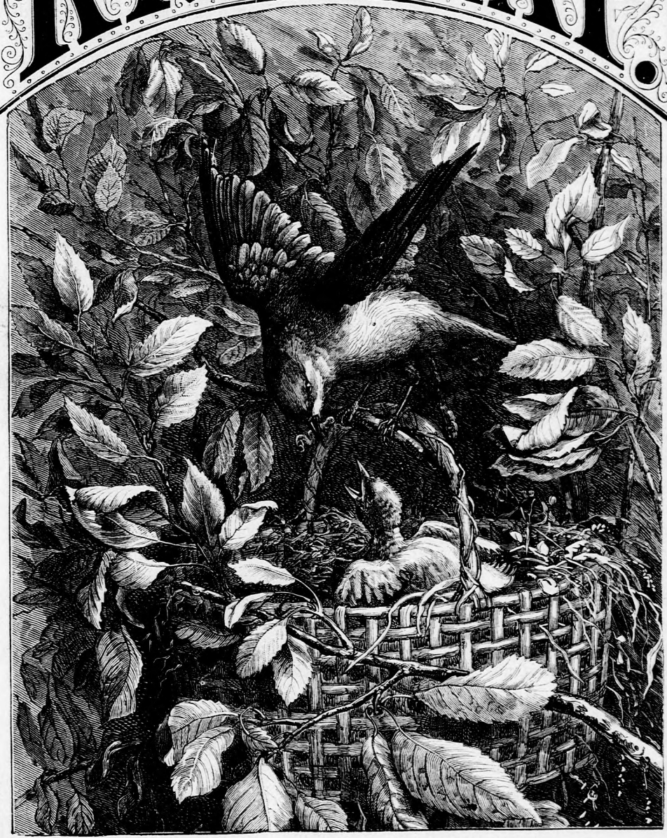
A BARÁTKAMADÁR TÖRTÉNETE.. (Lásd a 374. lapon.)