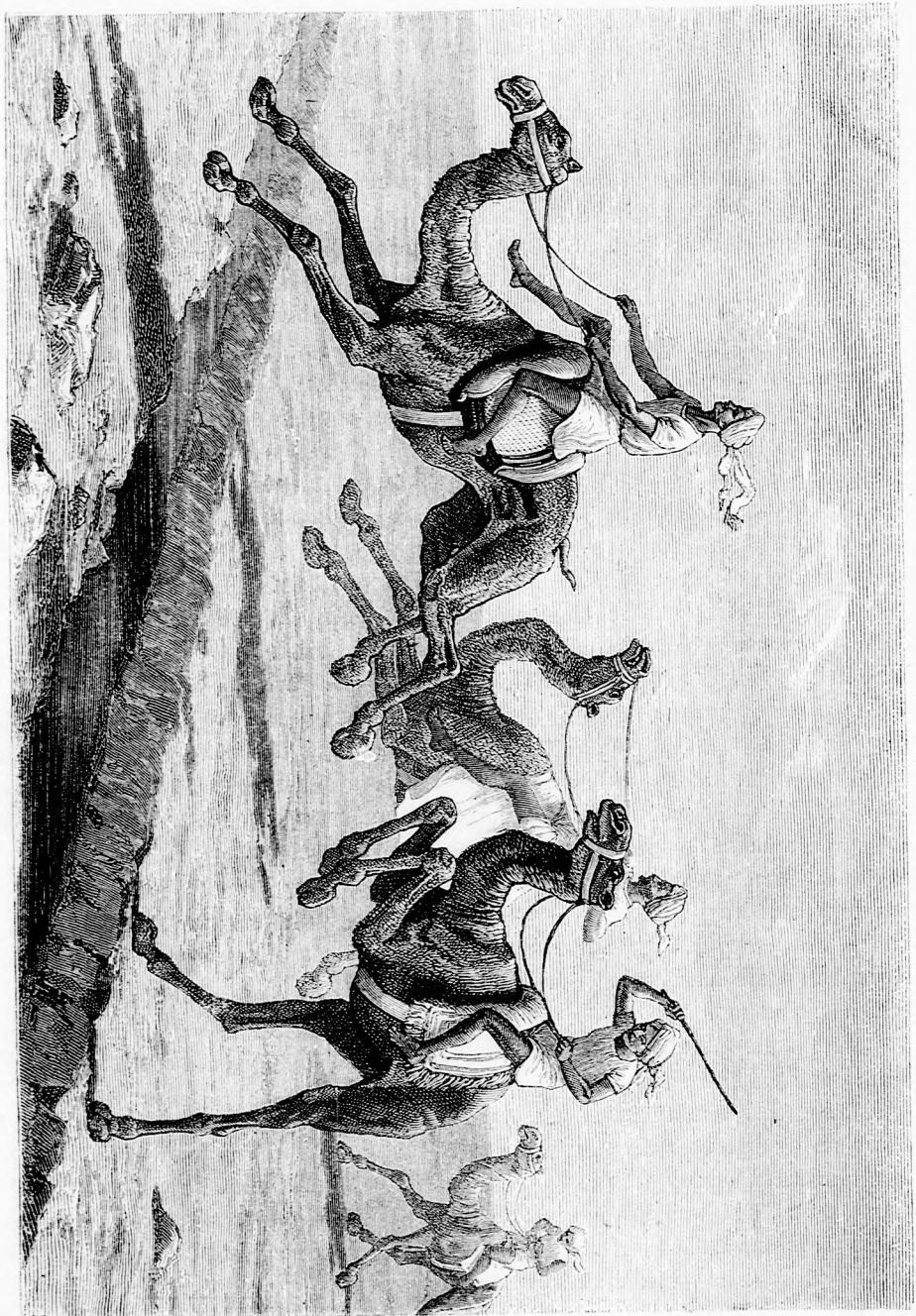
TEVE-VERSENY. (Lásd a 384. lapon.)