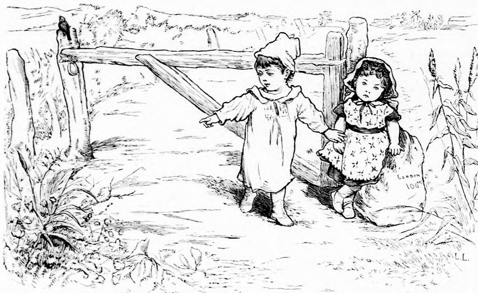
VÁNDORLÁSON. (Lásd a 107. lapon.)

— Szivesen elmegyek, felelé Gábor megalázkodva, de most mindjárt nem lehet . . . mindjárt bevégezem a dolgomat . . .