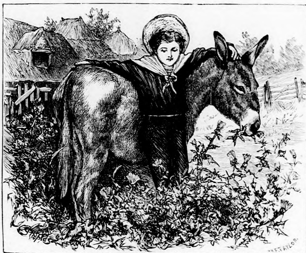
... RÁGICSÁLTA A KÓRÓT. (Lásd a 108. lapon.)

Leugrott s egy közeli bokorról vastag vesszőt tört le, aztán visszasietett a csacsihoz, mely megvetőleg elfordult és tovább ragicsálta a kórót. Gyors szökkenéssel Dezső ismét a csacsi hátán termett s most már nem szóval, hanem mindjárt erős vesszőcsapásokkal kezdte ösztökélni.