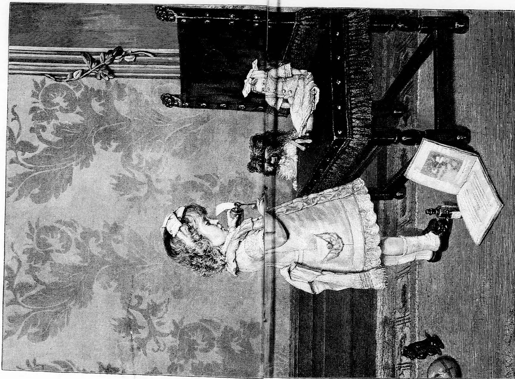
NAGY BETEG. (Lásd a 110. lapon.)